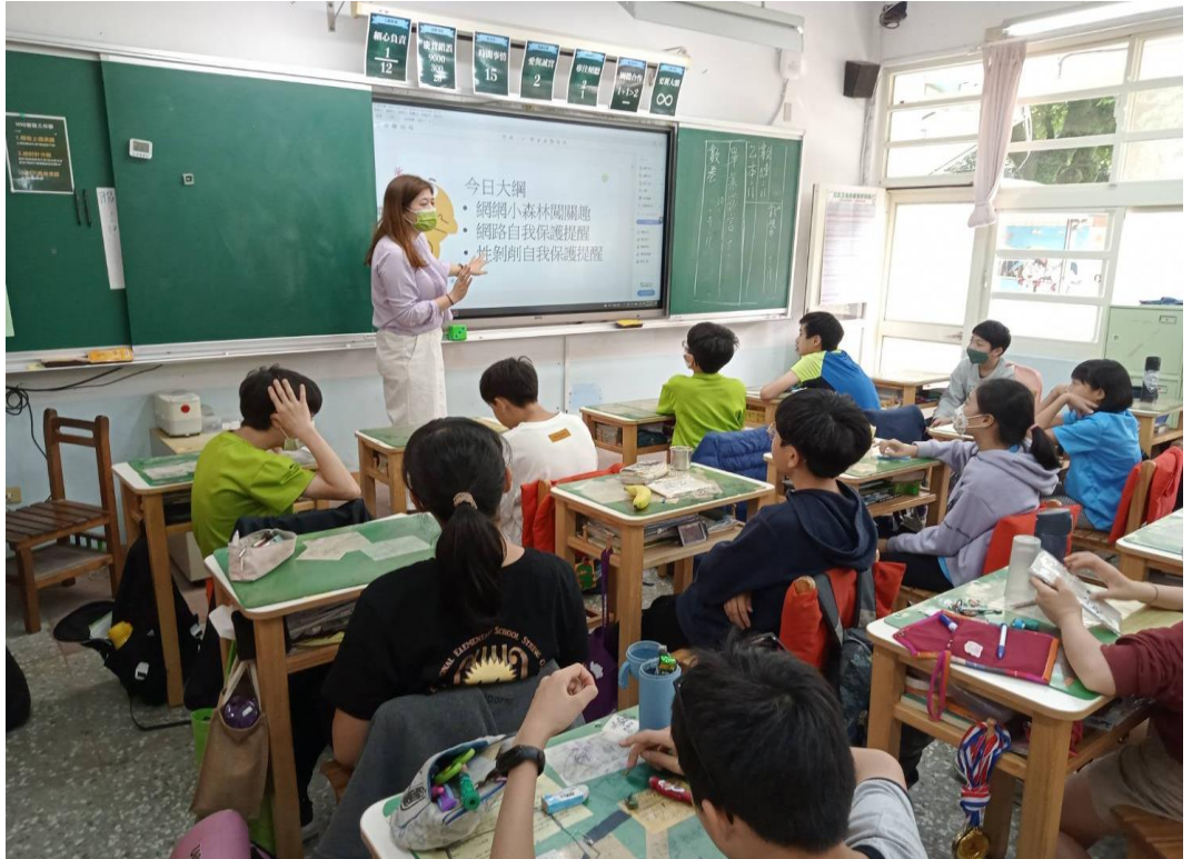
112年4月11日尚仁國小宣導