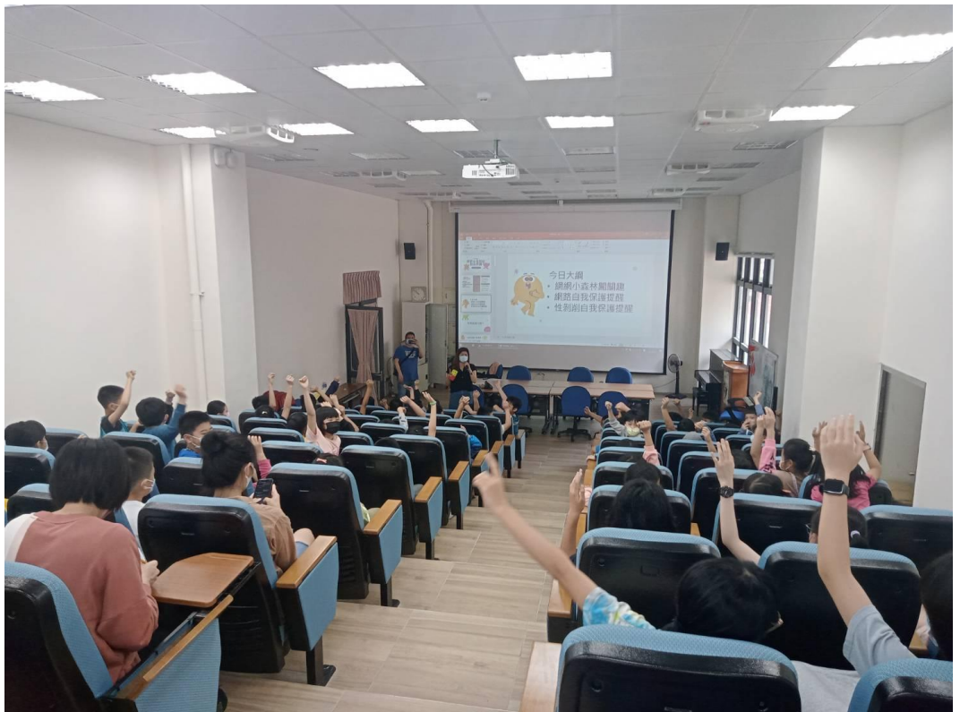
112年4月13日中興國小宣導