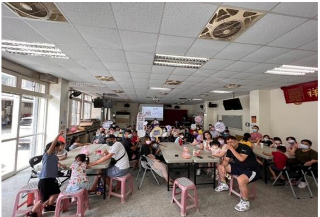
「碇祥聯署零暴力，防暴尖兵真給力」 112.06.03-紫要腕住你，守護兒少、破除迷思，打造有愛城市-兒少防暴宣導 地點：安樂區三民里民活動中心