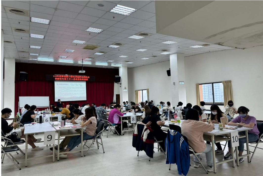
6月12日辦理多重歧視與性別暴力(LGBTQ+)實務探討