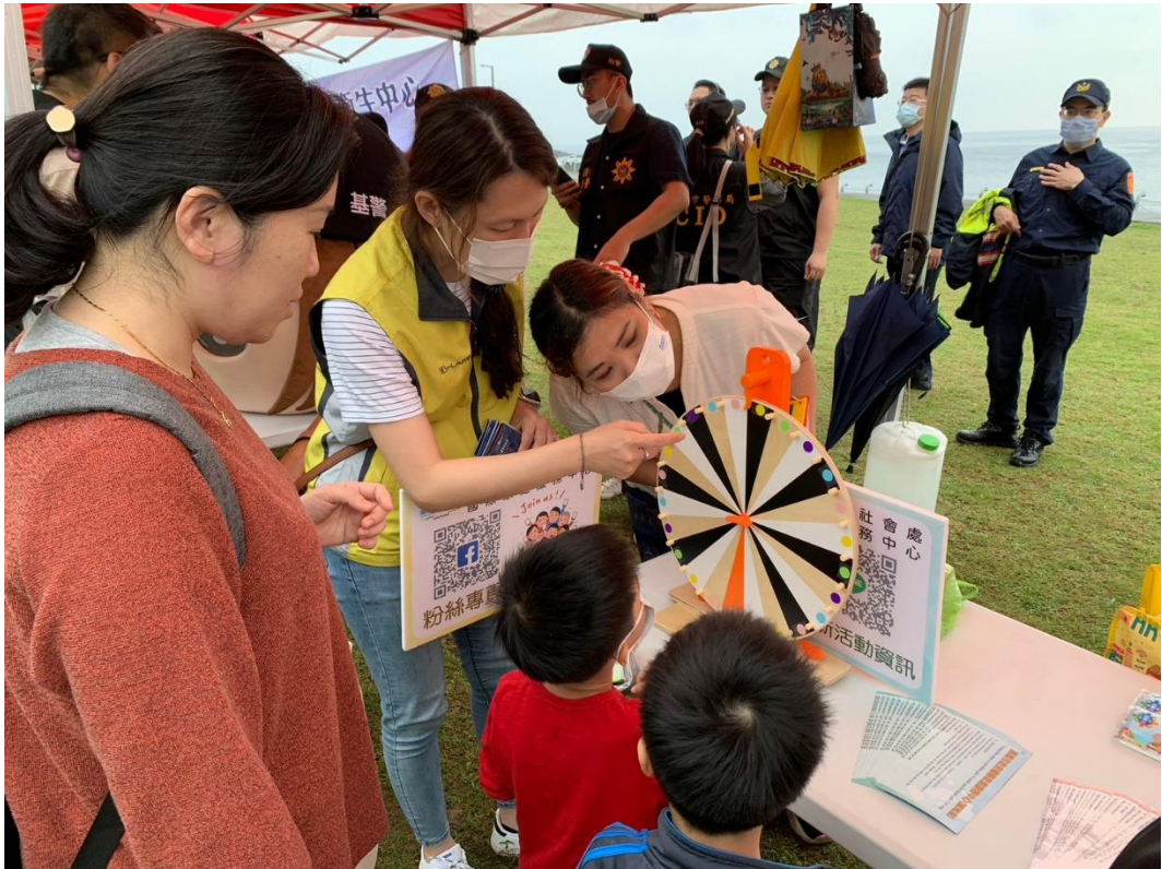
國際家庭服務中心參加「112年全國新住民健行暨嘉年華」活動，透過轉盤遊戲、認國旗大挑戰向市民宣導多元文化與中心服務資訊。

三、運用各種行銷管道，協助宣導國人相互尊重、理解、欣賞、關懷、平等對待及肯定不同文化族群之正向積極態度，並鼓勵推廣多元文化及生活資訊。