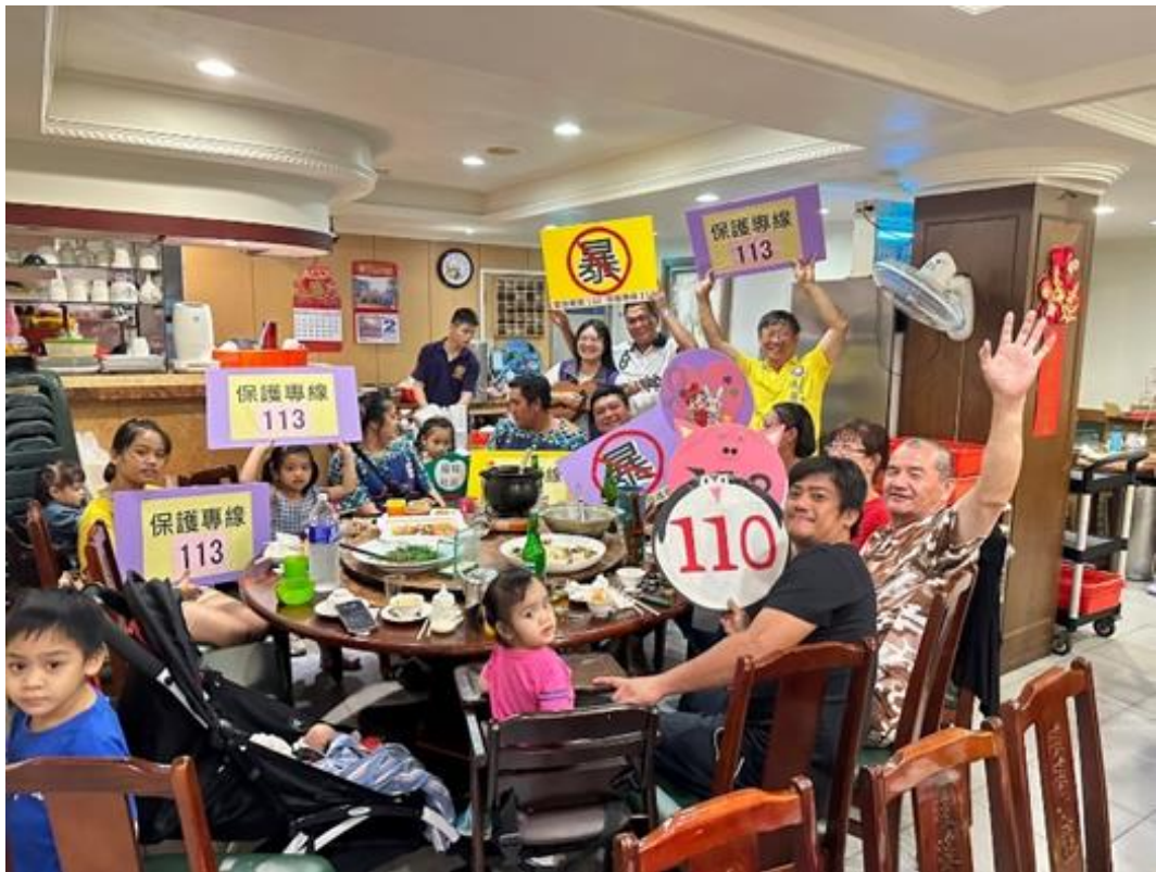
「碇祥聯署零暴力，防暴尖兵真給力」 112.06.02 原住民幹部會議防暴宣導 地點：暖暖小館