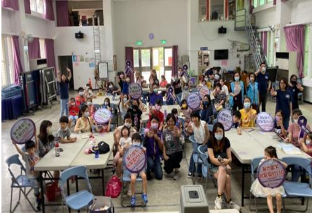
「碇祥聯署零暴力，防暴尖兵真給力」 112.06.03 地點：碇祥里民活動中心