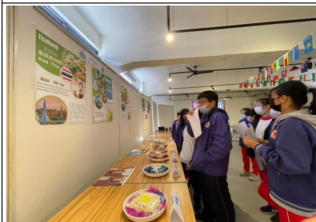
1. 永康國中—美食品嚐區