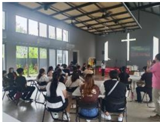
1.2提供社區宣導活動