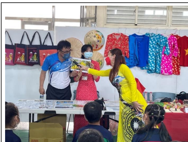
1. 新市國小—校長體驗文化活動