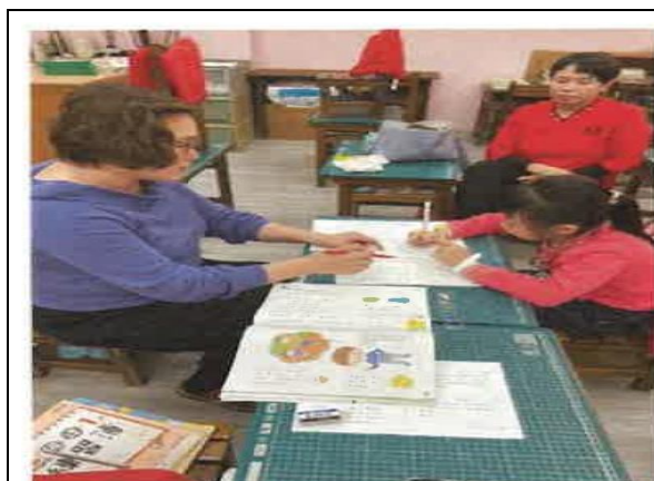
崇學國小—課後學習輔導