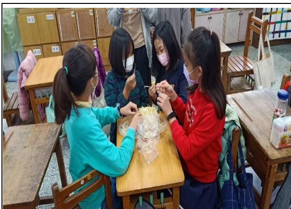
白河國小—體驗活動