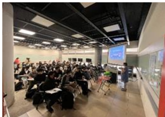
1.2提供社會支持活動