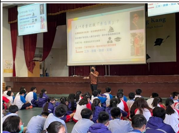
1. 永康國中—分享東南亞冷知識