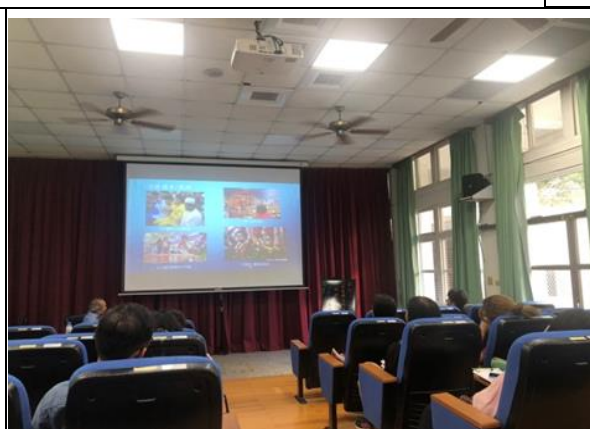
大橋國小—馬來西亞宗教祭拜儀式