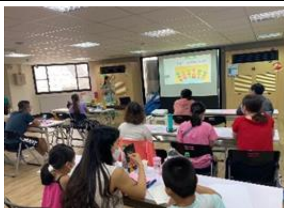
1.1提供個人支持活動