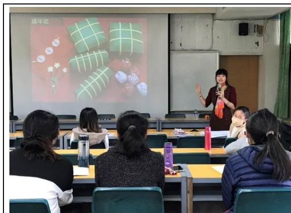
喜樹國小—文化差異方形粽子