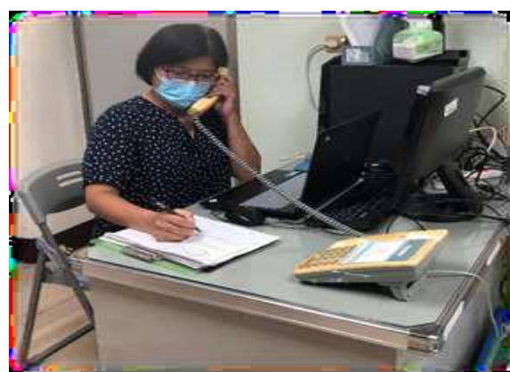
2. 特教諮詢據點駐點教師回復家長諮詢