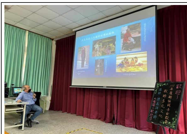
大橋國小—馬來西亞服飾