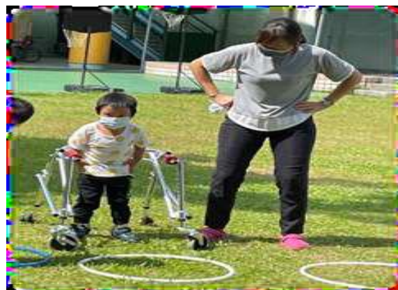
2. 觀察個案輔具使用情形