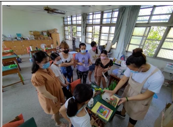
2.2 親職教育課程—親子藝術創作