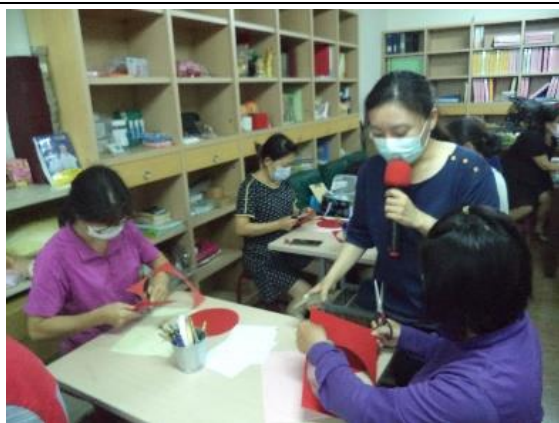
1.1提供個人支持活動