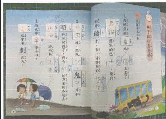
中西區成功國小—學生學習狀況