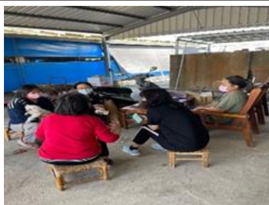
1. 新住民中心社工提供關懷訪視