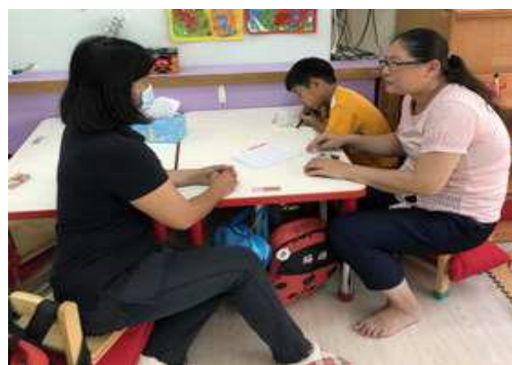
2. 巡輔師與導師討論個案情緒行為問題