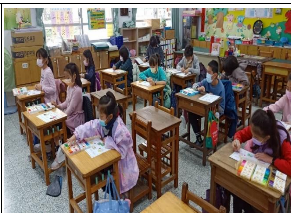
白河國小—在地化課程