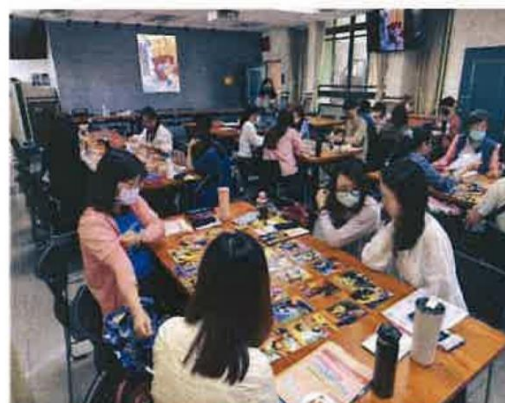
2. 小組腦力激盪可提供資源