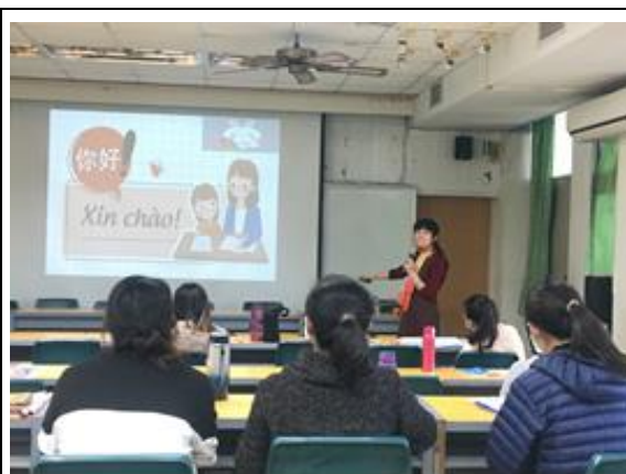
喜樹國小—簡易越南語教學