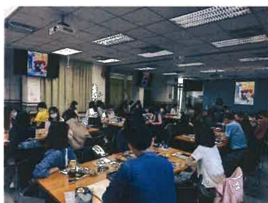
2. 圖卡分析個案面臨困境