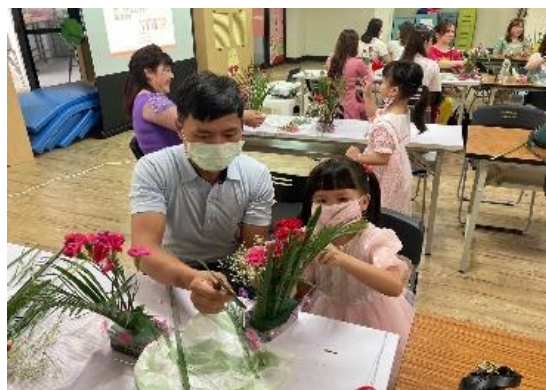
1.2提供社會支持活動