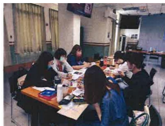
2. 透過畫圖鑲嵌法進行輔導實作