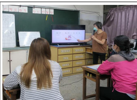
南區新興國小—拼音教學