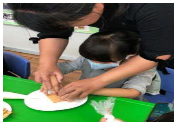
2. 特教助理員為個案進行一對一指導