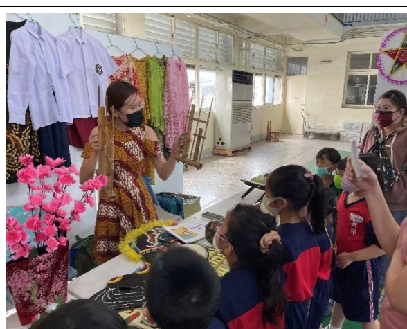
1. 新市國小—傳統文物展示