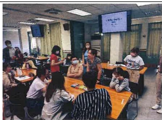
2. 心理師介紹桌遊中調整輔導技巧