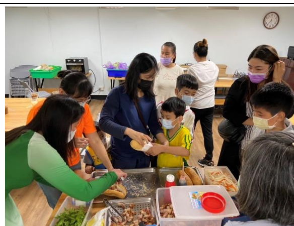
親子共學—愛的加油站活動