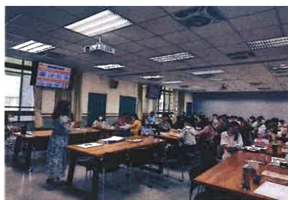
2. 教授介紹數位性暴力