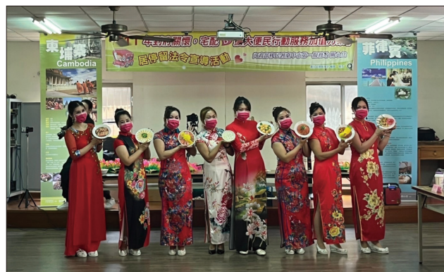
行動劇團展示異國美食料理

國的美食文化，盼望透過戲劇表演呈現多元文化特色，讓更多臺灣人了解新住民的飲食文化，以及新住民剛來臺灣的適應困境，請家人多一分理解，新住民就可以多一點安心，早一點在臺灣站穩腳步。