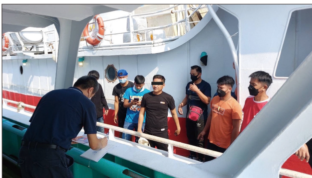
移民署查驗人員至前鎮漁港進行船員人證核對

境外預審機制上路之後，協助船主爭取到更充裕的應處時間，免去因不知情而搭載入境的風