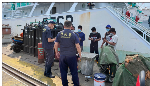
移民署至港區查察遠洋漁船外籍船員

在今年 5 月，有 2 艘權宜輪 (FOC) 外國籍漁船「密克 102 號」及「陶瑪娜 1 號」各載運 1 名大陸籍及印尼籍禁入船員抵高雄港，雖經查獲後順利遣返出國，然耗費成本與承擔風險甚鉅，因此，高雄港國境事務隊建議將「境外預審」功能擴大適用於外國籍漁船，也獲核准自今年 6 月 14 日起實施，至此，國境「決戰境外」的最後 1 塊拼圖完成。