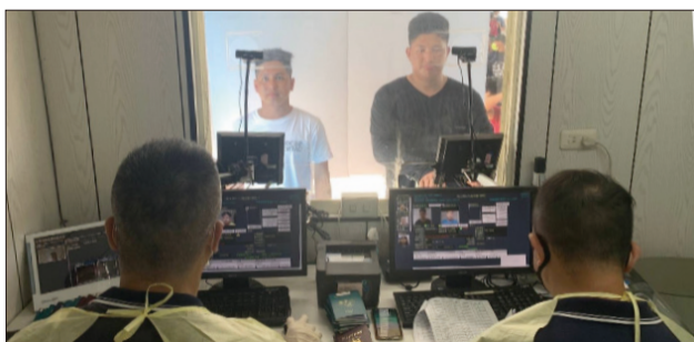
高雄港國境事務隊同仁於安檢所前貨櫃執行遠洋漁船進港查驗

118 艘漁船傳送預審資料，計有管制對象 8 人，因這些漁船是在每年 7、8 月即已出港作業，漁船返航若無第三國港口可供禁入對象下船，船主僅得進港後執行遣返；東港漁港至去年底共有 19 艘漁船傳送資料，審查到 4 名禁入對象，其中 3 名船主在第三港即讓船員下船，另 1 名則在船主獲知後即不僱用，為期 3 個月的試辦初見成效。