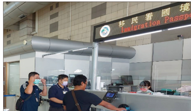
禁入對象由國境事務大隊同仁戒護至機場遣送出境

國境事務大隊向相關漁業公會及漁會等宣導後，獲得公會、船主與業者認同，在各項準備工作完成後，本項境外預審機制於去年 9 月 15 日起實施，第 1 個漁季是 11 月至 12 月，自日本海域捕撈秋刀魚返航的前鎮漁港遠洋漁船，共有