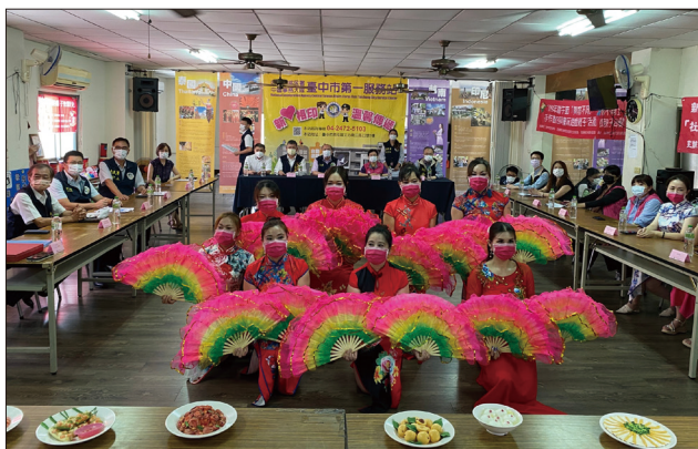
行動劇團配合異國美食帶來的扇子舞表演

林興春副署長表示：「新住民姊妹們自主成立的社區行動劇團，以實際行動發揮影響力在社區展演，可以讓更多人了解新住民的需要。今天很高興參與行動服務列車，看到這塊土地上有這麼多新住民認真生活的故事；目前在臺灣的新住民約57萬人，而新住民子女約45.6萬人，為持續協助他們在臺深耕並提供適當關懷扶助及鼓勵，移民署推動『新住民及其子女築夢計畫』、『新住民及其子女培力與獎助學金計畫』等相關協助，歡迎符合資格的新住民都可以來申請，期盼在臺灣這塊土地生活的新住民，都能勇敢築夢，展開發光發熱的生命旅程。」