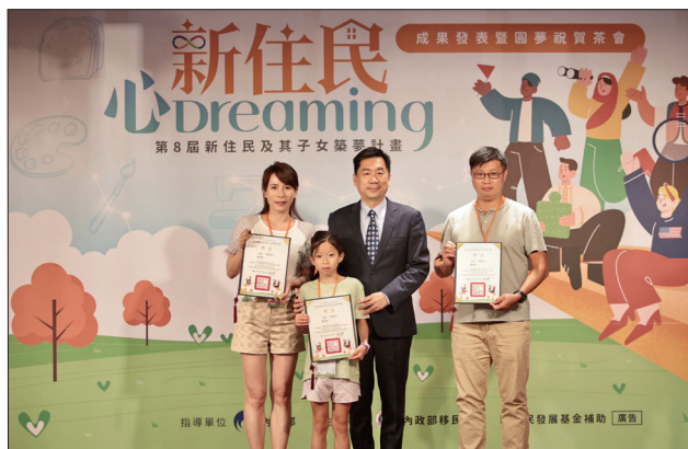
陳宗彥政務次長（右 2）頒發獎狀予獲獎者及其家人

移民署自 104 年持續舉辦新住民及其子女築夢計畫（簡稱築夢計畫），迄今已邁入第 8 屆，期間協助新住民及其子女在臺深耕、完成夢想，累計獲獎組數達 208 組，共 421 人受惠；今（111）年 8 月 13 日第 8 屆新住民及其子女築夢計畫成果發表暨圓夢祝賀茶會於新竹市熱烈展開，活動當天特別邀請內政部陳宗彥政務次長、移民署鐘景琨署長與順利圓夢的 30 組獲獎者一同分享喜悅及成果。