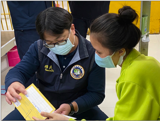
北區事務大隊宜蘭收容所同仁(左)向受收容人宣導接種疫苗事宜

日為收容所內 296 名受收容人接種疫苗，此防護網的建立，不僅為逾期外來人口與第一線的執勤同仁健康安全把關，更降低內部群聚感染的風險，使整體防疫力再升級。而參與接種疫苗的受收容人，也了解疫苗的短缺，返國後也不一定能夠免費施打，所以對於我國政府提供接種疫苗的服務格外珍惜，紛紛踴躍報名，讓疫苗接種率高達 87.7%。