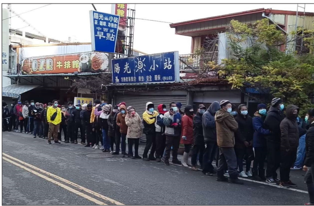
梨山快打站現場排隊人潮踴躍

深山地區的外來人口對於本次疫苗接種專案反應踴躍及由衷感謝，早上不到 8 點，梨山衛生所外早已大排長龍，人龍綿延了 2、3 百公尺，罕見的奇景引起路過民眾圍觀，紛紛拿起手機拍攝甚至製作影片上傳臉書及抖音等社群軟體。衛生所人員眼見原本備妥的 600 劑 BNT 疫苗已經不足以應付，為了響應政策讓遠道而來的外來人口都能在當天接種疫苗，立即通知臺中市政府衛生局緊急協調配送 1,000 劑的 BNT 疫苗與小黃卡，並用救護車火速載運上山。雖然中途疫苗一度全數用罄，全場被迫暫停接種，所幸不到半個小時內增援疫苗趕到，才能繼續服務後面排隊的人潮，也讓在場人員鬆一口氣，工作人員不分你我馬力全開，加快查證及登記身分的速度，並順利在下午 3 時完成施打作業。