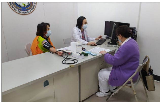
羅東博愛醫院進行巡迴診療服務

受收容人在進入收容所時均會檢查身體有無外傷或不適情形，另於每週二、四安排醫師進行巡迴診療的服務，提供就診平臺，讓受收容人能受惠臺灣的醫療專業及溫情，以更健康穩定的身、心狀態，渡過收容期。