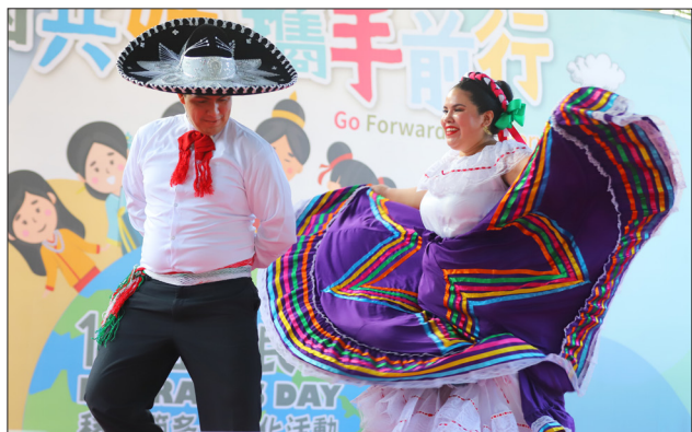
墨西哥哈拉維舞團以男女對舞的踢踏舞呈現精彩表演

南、泰國、印尼、哥倫比亞、埃及、印度、牙買加、祕魯、法國、墨西哥、緬甸、馬來西亞、大陸、奧地利、瓜地馬拉、波蘭、加拿大、日本、玻利維亞、內蒙古、俄羅斯、韓國、土耳其等 23 個國家的文化互動體驗、異國美食及創意市集。