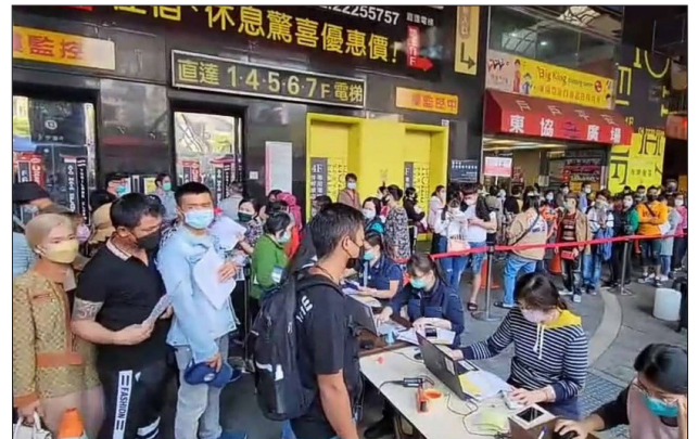
東協廣場快打站外來人口接種疫苗情形

臺中市東協廣場為中部外來人口聚集熱點及交通樞紐要地，設置疫苗快打站，成效更是驚人，吸引眾多南北各縣市的外來人口來此排隊接種疫苗。中區事務大隊臺中市專勤隊及臺中市第一服務站結合臺中市政府衛生局，自去年 12 月 11 日起至今年 1 月 23 日止，每週六、日下午 1 時至 4 時在東協廣場設置疫苗快打站，為外來人口施打疫苗，至今已完成數千名外來人口疫苗接種。