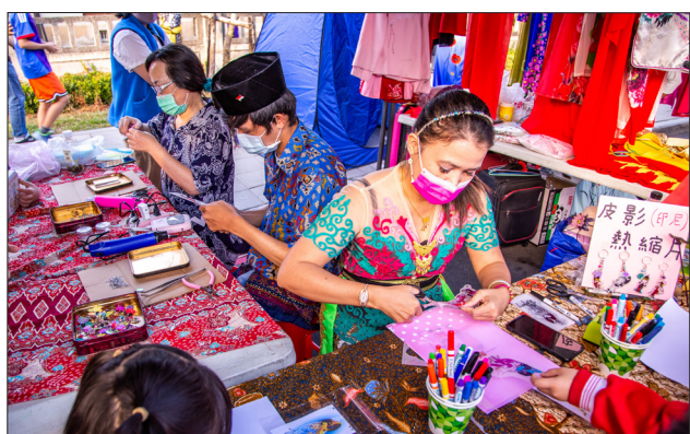
多個國家專屬攤位展示該國傳統服飾、樂器、節慶用品及手工藝品等文物(圖中為印尼皮影戲鑰匙圈製作)

每位來臺的新住民都有一段人生故事，會場中展示著來自 9 個國家新住民的「移人皮箱」，皮箱中每一件隨著主人飄洋過海來到臺灣的親人相片、傳統服飾或家鄉香料等行李，都深藏著獨特動人的生命故事，透過他們親自娓娓訴說，看見移民朋友們在臺灣落地生根的堅毅與勇敢。鼓勵現場嘉賓參與活動，主辦單位還提供具有移民遷徙意象的移民節紀念口罩，以及來自小琉球新住民手作麻花捲作為闖關好禮，讓移民節活動好看、好吃又好玩！