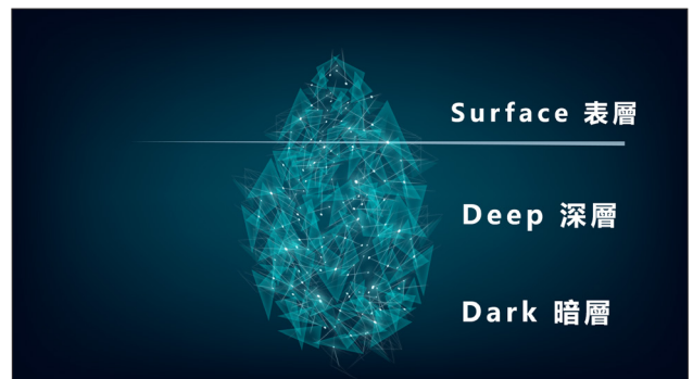
公開來源情資技術取得情訊有限，偵查困難與日俱增