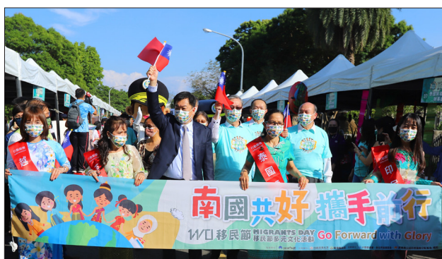
內政部陳宗彥政務次長（第 1 排左 3）、移民署鐘景琨署長（第 1 排左 4）與新住民及移工朋友們一起踩街遊行進場

本次移民節採用雙舞臺進行活動演出，讓現場嘉賓體驗更多異國風情。主舞臺開場表演邀請屏東在地「潮州華姿舞蹈團」以「攜手傳承」為主題，展現多元融合的精神；接著由德國及俄羅斯新住民「長笛與弦樂四重奏」演奏大師級臺灣民謠「四季紅」，讓觀眾沉浸在音符旋律中！副舞臺則由各國新住民帶來墨西哥 JARABE 舞蹈、印尼樂器安克隆、日本津輕三味線及泰國揚琴演奏及新住民家庭歌舞劇等 27 組精彩表演，雙舞臺的精彩節目讓會場熱鬧滾滾。