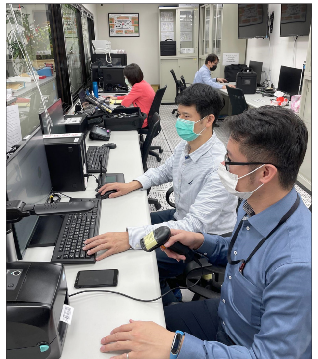
移民署科技偵查中心同仁持續強化偵蒐量能，因應新興科技犯罪之挑戰

移民署法定職權及任務屬性與其他執法機關不同，以非法入出國及移民犯罪案件為主，然因時勢所趨，亦脫離不了科技偵查的範疇。道高一尺魔高一丈，犯罪手法不斷進化的同時，執法機關面對日新月異、察覺不易的各類科技犯罪態樣，唯有與時俱進，並建構先進科技偵查設備或系統，強化偵查機關偵蒐量能，始能將犯罪者繩之以法。