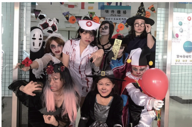
萬聖節裝扮活動，請洽公民眾上網投票最喜歡角色，共襄盛舉

「啊！萬聖節要到了~我們來舉辦活動吧！」服務站節慶佈置的發想，就來自於同仁的一個活動 idea，為了配合節慶的氣氛，站內的同仁紛紛丟出佈置及活動的想法，那年的萬聖節期間，站內佈滿蜘蛛絲跟蜘蛛網的佈置，還有在天花板上懸吊的蝙蝠，不僅洽公民眾嚇了一大跳，也讓服務站充滿外國萬聖節的氣氛。來洽公的外籍老師說：「這比我們補習班佈置得還要專業，感覺像真的在我們美國過節一樣，讓我都想家了呢！」萬聖節前夕還特別邀請附近幼兒園的小朋友來參加「不給糖就搗蛋」的活動，全站同仁打扮殭屍、喪屍及小丑等恐怖造型，之後更開放線上投票，邀請洽公民眾一同投票給最喜歡的角色及造型，邀請大家共襄盛舉，一同參與。