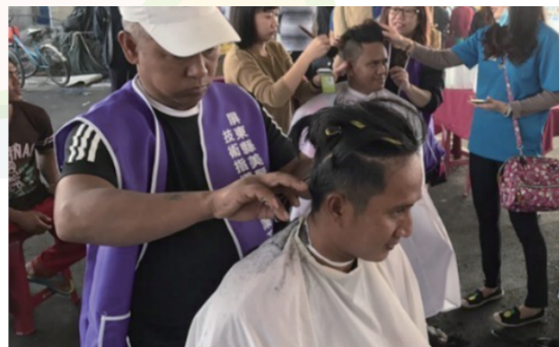
本署屏東縣服務站辦理外籍漁工義剪活動

今(107)年1月20日本站及專勤隊結合屏東縣政府勞工處，在東港碼頭櫻花蝦廣場舉辦外籍漁工免費剪髮、健康諮詢、贈送衣物等活動，特別邀集屏東縣政府勞政及衛教單位設置櫃檯，聯袂服務外籍漁工，並宣導「人口販運防制」及「1955 外籍移工 24 小時諮詢保護專線」，讓保障移工人權的觀念深植於每個人心中。