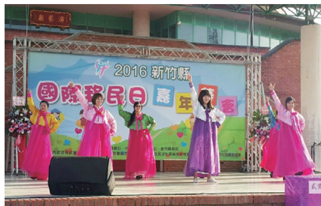
本署新竹縣服務站同仁於國際移民日節嘉年華會，穿著韓服表演韓熱舞

的熱舞表演，第 2 年則是特別請服務站共 8 位同仁準備表演節目，而為了向大家展現出移民官充滿活力不同的一面，特別邀請站內舞蹈專長的同仁，進行舞曲挑選及編舞，呈現羅馬尼亞的「PANAMA」，充滿異國風情的舞曲。表演當天，全體特別穿著整套大禮服進行熱舞，不僅打破臺下民眾對公務員的印象，更是全場鎂光燈的焦點。