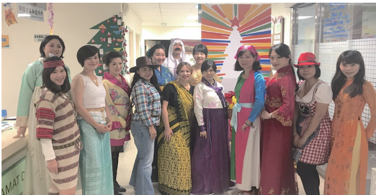
本署新竹縣服務站慶祝國際移民節，全站同仁著異國服裝辦公，民眾耳目一新

走 進移民署新竹縣服務站，不像一般公務機關嚴肅沉悶的氣氛，映入眼簾的是配合節日的特色佈置，耳邊聽到的是悅耳的節慶歌曲，舒適且賞心悅目的洽公環境，帶給民眾最優質的洽公經驗。