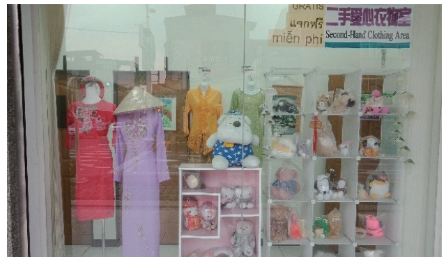
本署屏東縣服務站二手愛心衣物室

屏東地區新住民人數已超過 1 萬 9,000 人，他們飄洋過海來臺只為追尋更幸福的未來，移民署扮演的角色除了是管理者，也是提供幸福生活的賦予者，屏東縣服務站秉持「服務同理心、感動民眾心」理念，提供便捷的服務品質，並真心關懷新住民所需，提供適切協助，期望新住民感受「臺灣就是你的家」、「日久他鄉是故鄉」，在臺灣這塊土地落地生根，展開幸福新生活。