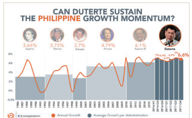
菲律賓亮眼的經濟成長率，吸引外媒分析

菲律賓採取上述簽證措施，成功吸引許多外資進入菲律賓投資。近6年來，菲律賓經濟成長率每年均突破6%以上，優於東協5國，全亞洲僅次於大陸及越南，今(2018)年經濟成長率更上看8%，上述簽證措施功不可沒。除投資門檻不高外，菲律賓吸引外資的方法及制度亦極有彈性及靈活性，其所帶來正面的效果，值得我們進一步深思及觀察。