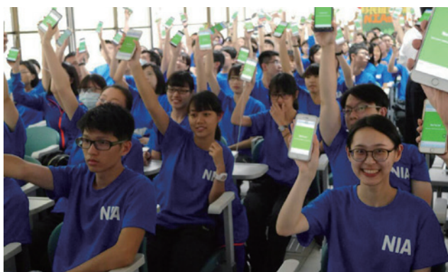
數位化的認人比賽海選

長年繃緊的彈簧，偶爾也需要適度放鬆，在各項訓練與課堂之餘，中心也舉辦多樣活動，激發學員創意，並凝聚團體的向心力。認人比賽的舉行，給予學員適當的動力去認識彼此，而 6 期文康小組亦改變前期學長姐的操作方式，透過更加數位化與創新的作法，讓學員們在緊張刺激的比賽中度過一個充滿歡笑的午後；自主體能訓練則是我們最期待的時間，體健區、籃球場、甚至整個中心園區都有學員們認真運動的身影，擁有相同興趣的人聚集在一起，擅長運動的人帶領體能較差的夥伴同行，大家臉上滴著汗，卻綻放出最滿足的笑容，充實而愉快地度過這段難得的時光。