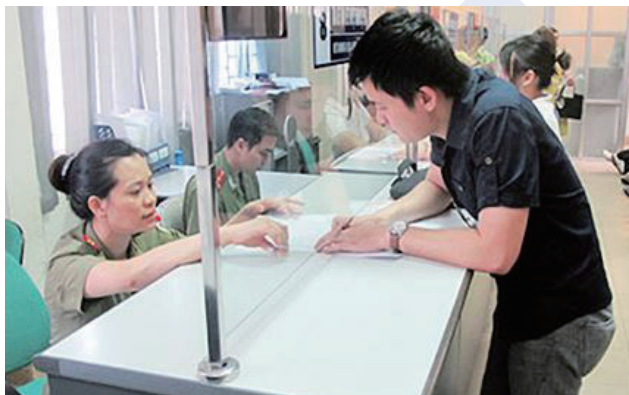
越南出入境管理局民眾洽公情形

越 南因為其政治體制及歷史因素，對於外國人入境前後各種活動之管理與其他國家作法有別，筆者赴任 4 年以來，發現有許多國人對於申請越南簽證，以及在越應遵守的生活制度仍相當陌生，偶因誤解而觸法，期盼讀者藉此初步了解規範，正確地前進越南。