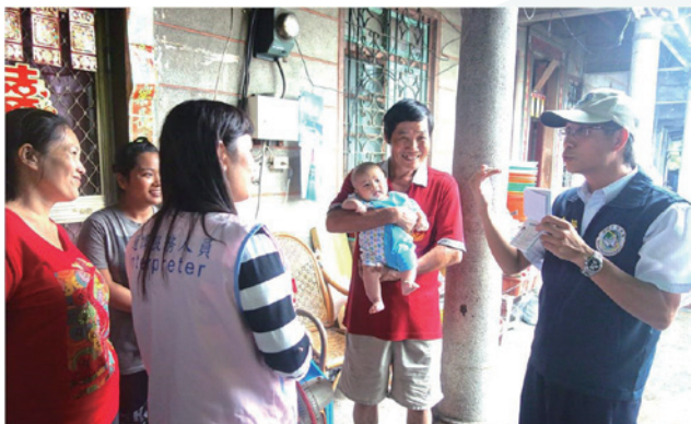
本署屏東縣服務站善用行動服務列車之家訪，為新住民說明居留法令及生活適應資訊

為了擴大服務面向，不僅邀集網絡單位共同宣導業務，更多次結合外交部南部辦事處於現場受理國人申辦護照，將國人與新住民均納入服務範圍；亦結合法律扶助基金會及屏東縣政府衛生局等單位，藉由行動服務列車安排家訪，針對需要協助的新住民提供資源、鼓勵具傑出表現之新住民二代，遇有家庭特殊狀況，適時予以關懷、瞭解問題之所在，除充分發揮資源平臺效能，轉介