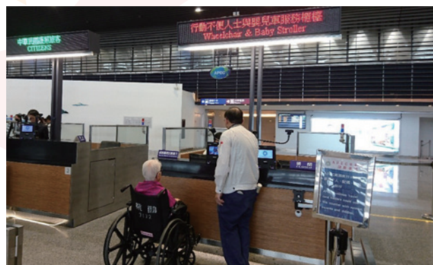
國境事務大隊設置「行動不便及嬰兒車服務專櫃」

為了提供旅客更加多元且便捷的證照查驗服務，本署自 100 年起，於各機場港口設置自動查驗通關系統 (e-Gate)，使用滿意度持續受民眾好評，截至今年 3 月底，使用通關已達 6,110 萬人次。此外，為提供旅客友善的通關服務，也設有不同的查驗專櫃，例如，「行動不便及嬰兒車服務專櫃」專門提供給帶小朋友、長輩出入國或是行動不便的旅客使用，而快速通關櫃 (Speedy Immigration Counter)，則是提供給 1 年內來臺 3 次以上的商務人士、持亞太商務旅行卡 (ABTC)、學術及商務旅行卡及就業金卡之旅客使用。另外，為精進查驗同仁的專業職能，提升通關效率，除定期辦理各種教育訓練外，每年均舉辦「國境管理研討會」，邀請各國移民官來臺研討，互相交流、學習新知，希學習各國國境安全管理及科技，強化國際間的實質合作。