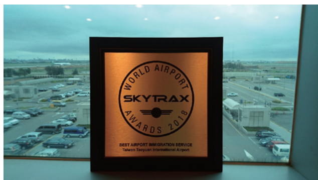
桃園機場榮獲最佳證照查驗服務機場第 1 名佳績

依本署入出境旅客資料統計，去年全臺入出境旅客高達 5,270 萬人次，其中桃園國際機場入出境旅客約 3,974 萬人次，旅客量佔百分之七十五，為因應桃園國際機場 24 小時的營運，國境事務大隊同仁秉持著謹慎的態度與職人的精神，對入出國的旅客，以專業的知能與高效率的科技設備，來落實查核比對。