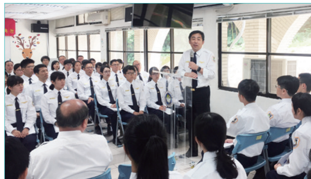
署長親臨指導「每日議題」案例討論分享

本署的優勢之一，就是擁有來自不同背景、不同領域的人才，而大家的差異在需要團隊合作時，就成為了我們的長處，若能善用每個人的才能與智慧，並肩齊行，便能共同推動移民署向前邁進。身為移民班 6 期的一員，我們應該認知到團隊合作的重要性，並善用集體智慧，共同朝向目標努力，並保有報考前的那股熱情與衝勁，期望未來能為移民署這個大家庭注入嶄新的想法及創意，成為一位稱職的移民官。