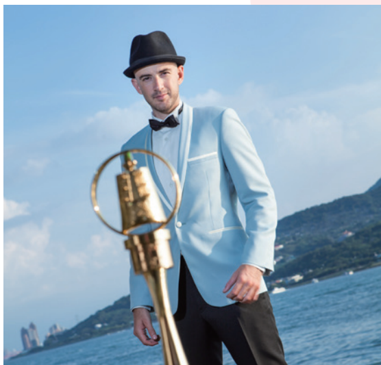
吳鳳是第一位獲得金鐘獎的外籍主持人

土耳其籍、知名旅遊主持人吳鳳，是第一位獲得金鐘獎的外籍主持人，他目前長期住在臺灣，有美麗的老婆、可愛的小孩，吳鳳表示：臺灣人很熱情、很友善，自從他在「愛玩客」節目介紹臺灣後，許多土耳其人向他表示很有意願來到臺灣觀光或投資。為了讓臺灣人也認識他的母國土耳其，吳鳳特別寫了「來自土耳其的邀請函」這本書，於今年2月出版，介紹土耳其地理及文化，希望臺灣人及土耳其人能互相交流認識，實踐每個人都是自己國家大使的理念。