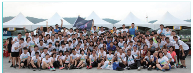
參加「2018臺北馬拉松」夜跑，鍛鍊體魄

另外，體能方面的射擊課程，訓練我們面對危急時刻的沉著冷靜，綜合逮捕術課程教授我們應用的實戰技能，而體能課維持我們基本的體力水準，並讓我們養成自主運動的習慣，警專的每位教官均無私地將其所學一一傳授於我們，甚至與我們分享許多課堂外的知識經驗，每每收穫良多。