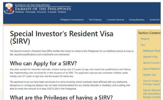
菲律賓大使館在官網詳細介紹 SIRV 及 SRRV

獲發「特別退休居民簽證」者，退休署可以協助持證人向政府相關機構取得外國人工作許可證、駕照、免稅或延期繳交證明、繳稅認可號碼、調查局認可證明等相關文件。