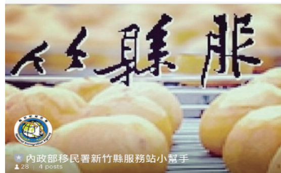
本署新竹縣服務站建立專屬 LINE 帳號群組，提供民眾更多元便利的查詢管道

本署新竹縣服務站前毛兆莉主任表示，站內的同仁年紀都相仿，年輕人除了充滿活力外，腦筋也動得特別快，我們藉由大家各別在不同領域，如藝術、語言、資訊等方面的長才，提供給民眾洽公更好的感受及服務，以及更便民的服務措施，未來期許能在跨機關合作的大活動持續經營，站內也能多發揮巧思，提升服務的品質，當移民署遇上新生代的移民官生力軍，讓每天的工作充滿驚喜，創造力無可限量！