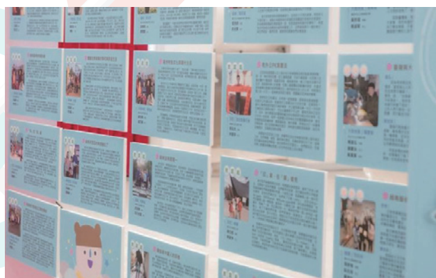
現場展示獲選者的成果圖文

這次活動報名相當踴躍，總共收到 121 件計畫，經甄選後，有 39 組獲選，其中家庭組 36 組及親師組 3 組，包括越南、印尼、緬甸、柬埔寨、菲律賓、馬來西亞、大陸地區共 81 人，每人依前往地區補助新臺幣 2 至 6 萬元，獲選者在國外依照申請時所擬具的學習體驗計畫，回到新住民家長的母國進行為期一週的學習體驗。成果發表會現場展示獲選者的成果報告，各式各樣的主題及學習力的展現，很多同學及親友都駐足觀賞並與自己的版面合影留念。其中評審吳順火委員評閱各組成果報告後，也在當天活動上回饋更多評語及心得，他發現大家撰寫內容豐富、結構完整，在分析比較方面，都比前幾次明顯進步，也符合「培力」計畫的宗旨。