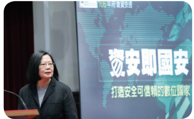
蔡總統出席 106 年府會資安週，強調「資安即國安」

一疏、萬無一失，才能維護個資及政府資通安全，也唯有人人提高警覺、落實全民保防要求，全民作為國家安全最佳後盾，國家的安全和社會的利益才得以確保，國人才能永享自由民主、國泰民安的生活。