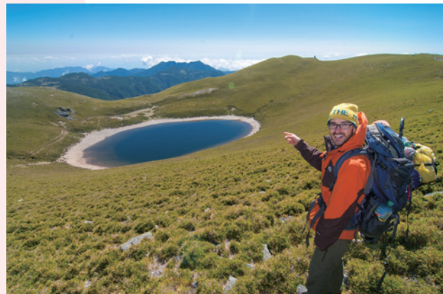
吳鳳主持愛玩客外景節目，向大家介紹寶島臺灣

職導遊的他，於2002年考上安卡拉大學研讀中文與漢學，並在2006年來臺灣就讀師範大學政治研究所，主修中國清末後政治。後來電視台看上吳鳳活潑外向、又有導遊經驗，於是延請他擔任旅遊節目主持人，結果一炮而紅，廣告及片約不斷。