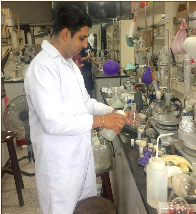
庫納那塔利致力於抗癌藥物研究

統療法，幫助了許多病患抗癌成功，傑出的研究結果讓他在 103 年至 107 年間連續獲得了 5 次臺北醫學大學傑出博士後研究獎，肯定他對臺灣癌症醫療領域的貢獻。