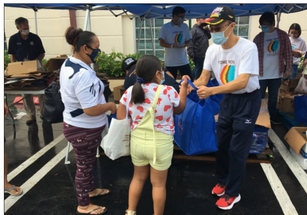
駐邁阿密辦事處在雷克渥斯市舉辦國慶愛心賑濟活動

活動當天，天空飄著毛毛細雨，但當地民眾仍扶老攜幼提前來到市府廣場排隊，準備領取愛心餐盒。在發送餐盒時，我一一向來領取的美國民眾點頭致意，並對他們說：「Thank you for coming! Take care and stay healthy! Good Luck!」以尊重的態度傳達我國政府的關懷與心意，而許多民眾也對我們說：「Thank you, Happy birthday to Taiwan!」雖然細雨中略帶寒意，但看著我國國旗在美麗的佛州濱海小城飄揚，以這樣人道關懷的方式慶祝國家生日，讓我內心澎湃也倍感溫暖，希望疫情早日過去，生活回到常軌。