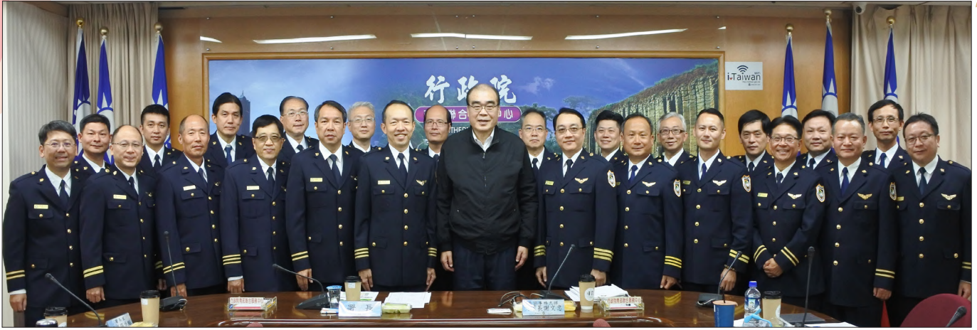
本署邱豐光署長(前排中)於南區事務大隊主持「觀宏專案」旅客脫團案專案會議並與同仁合影

本署動員所轄 4 外勤大隊 - 北區、中區、南區及國境事務大隊擴大追查，並與內政部警政署跨機關合作，也在外交部協助下，與駐越南臺北經濟文化辦事處及駐臺北越南經濟文化辦事處協力進行源頭追緝，並輔以柔性呼籲，透過社群網路發送中越雙語文宣，請在臺越南鄉親勸說脫團旅客自行投案，更提供檢舉獎金，鼓勵民眾檢舉可疑外來人口，在多管齊下的努力下，達成了 2 週內尋回逾半數脫團旅客的成果。去年 1 月 21 日，本案透過科技偵查的不斷抽絲剝繭宣告偵破，查獲了幕後跨國人蛇集團，並移送相關主嫌，更在農曆春節前，遣送首名自行投案者返鄉過年。