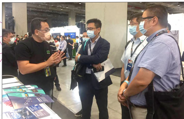
本署科偵中心成員(右1至右3)於臺灣資安大會中吸收資安攻防新知