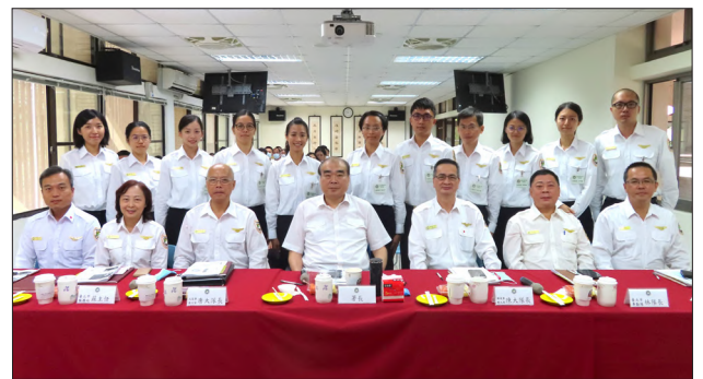
本署邱豐光署長（前排中）蒞臨訓練中心指導移民班第 8 期實習成果報告

署長也囑咐學員在實習期間，要好好向各單位的學長姐學習，要多聽、多看、多學習，體驗在本署的各項勤務工作，並將平時所學與實務結合，達到學以致用。今年 10 月 16 日的實習成果報告，署長特地蒞臨指導，學員們個個卯足全力，使出渾身解數，將最好的成果呈現出來；署長期勉學員們在未來工作崗位上認真負責、盡心盡力，把移民工作當作終身志業，拋開公務員是鐵飯碗的思維，才能樂在工作、創造自我價值。