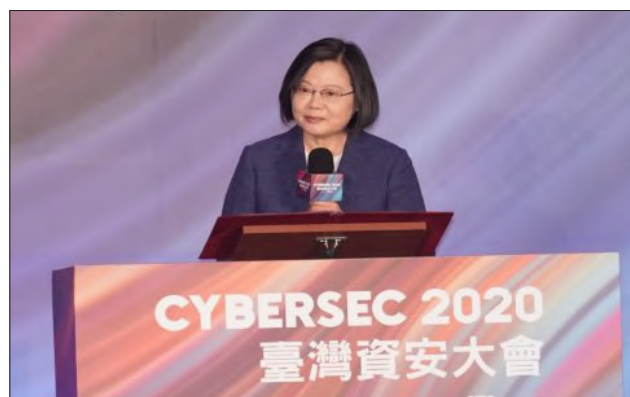
蔡英文總統蒞臨臺灣資安大會開幕式並致詞

政府部門關鍵基礎設施，落實資安防護，建立以數據驅動為核心的主動防禦體系，達到超前部署的目標，提升臺灣整體的數位國力，打造結合數位實力、國家安全及可被世界信賴的資安系統及資安產業鏈。」