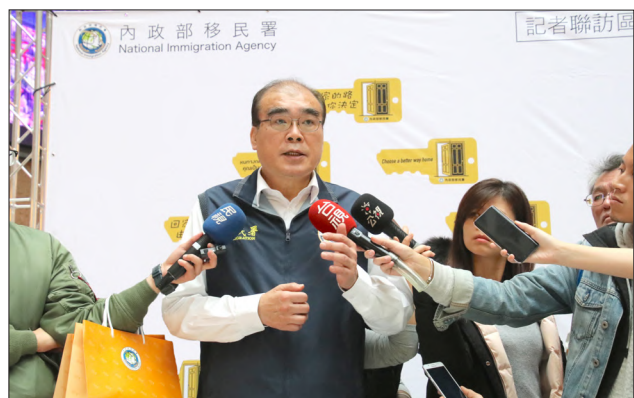
本署邱豐光署長以柔性訴求推動「擴大逾期停(居)留外來人口自行到案專案」

今年，本署邱豐光署長指示繼續推動「擴大逾期停(居)留外來人口自行到案專案 2.0」，以「不收容、不管制、低罰鍰」等較去年更寬容的政策，並延續去年的柔性訴求，呼籲因非法身分而處於黑暗角落的逾期外來人口勇於主動投案，而今年適逢武漢肺炎疫情肆虐，本署邱豐光署長特別指示本署各區事務大隊嚴密規劃受理自行到案之相關防疫措施，本專案經查處之逾期外來人口「零確診」，確實達到防疫滴水不漏。