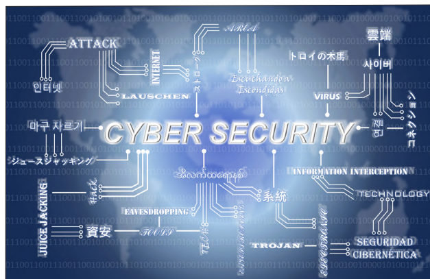
資安威脅無所不在

本署為資通安全管理法所列 A 級安全等級機關，資訊部門平時針對網路釣魚電子郵件詐騙，均定期進行社交工程演練，提高本署同仁警覺性，避免惡意程式藉機侵入造成危害，在日益嚴峻的資安風險下，更要時時刻刻惕勵自我、保障資安。