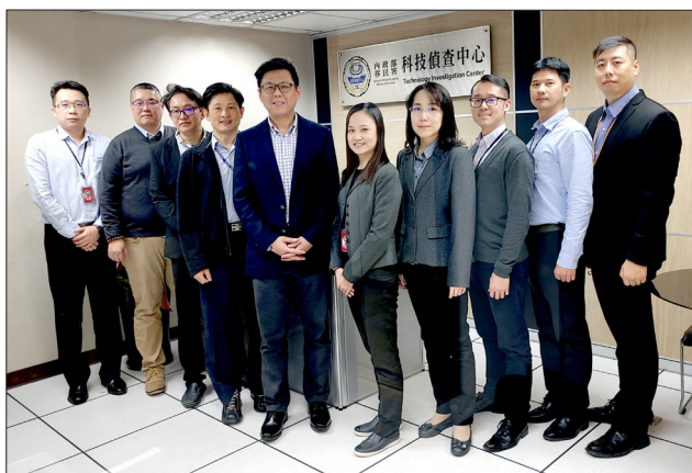
本署成立科技偵查中心

本署邱豐光署長到任後，有感於本署的外勤人員仍停留在傳統的辦案方式，即指示將在任內提升本署的科技執法能力，經過 1 年的規劃與人員培訓，已於 109 年 3 月 2 日成立科技偵查中心，並在北、中、南及國境事務大隊成立科技偵查隊，除進行數位證物勘驗、建置科偵設備、舉辦教育訓練外，並透過數位取證與大數據資料分析偵辦案件，大幅縮短人工比對及分析時間，爭取破案時效。