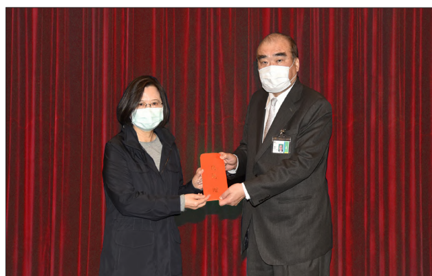
蔡英文總統(左)至桃園機場巡視國門檢疫措施、慰勉本署同仁辛勞並頒發嘉勉金，由本署邱豐光署長(右)代表受頒

本署邱豐光署長亦多次至桃園國際機場巡視國境事務大隊之防疫措施，指示依據中央流行疫情指揮中心發布之最新入境規定，阻絕不符入境資格之旅客於境外；嚴格執行入境資格審查，同時遏止居家檢疫未達 14 天之投機旅客出境；要求入境外國人確實填寫入國登記表，掌握外籍旅客在臺行蹤。