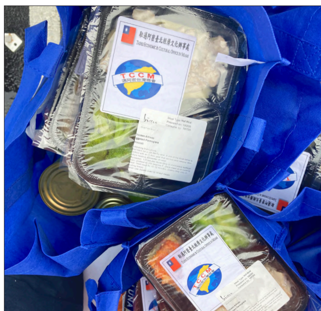
國慶愛心賑濟活動中發放的愛心餐盒