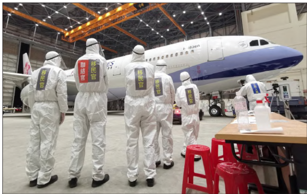
本署移民官位居武漢肺炎防疫第一線，於飛機維修棚廠進行專案包機入境證照查驗

臺灣優異的防疫成績獲得國際上一致認可，在本署邱豐光署長帶領下，一群默默付出的無名英雄，扮演了重要角色。