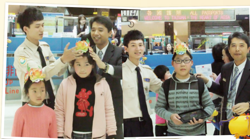
移民署高雄機場國境隊於辦理入境查驗時贈送龍年元宵燈籠給旅客

為讓在臺的所有外籍人士與新移民朋友能安心過好年，移民署長謝立功特別勉勵國境事務大隊執勤同仁，於春節期間持續加強各項入出國通關查驗服務，並多說好話，例如：新年快樂、新春愉快、恭禧發財等祝賀詞，更要常保微笑，留意查驗的禮貌作為，俾讓入境外籍旅客對我國留下良好的第一印象。