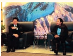
99.01.08 謝署長拜會嘉義縣張花冠縣長洽談移民輔導與人口販運防制合作事項