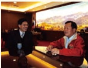
99.01.07 謝署長拜會苗栗縣劉政鴻縣長洽談移民輔導與人口販運防制合作事項