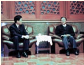
99.01.06 謝署長拜會宜蘭縣林聰賢縣長洽談移民輔導與人口販運防制合作事項