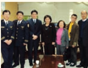
99.01.08 謝署長拜會嘉義市黃敏惠市長洽談移民輔導與人口販運防制合作事項