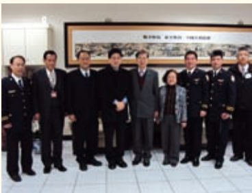
99.01.14 謝署長拜會金門縣李沃士縣長洽談移民輔導與人口販運防制合作事項