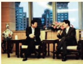
99.01.11 謝署長拜會台北縣周錫璋縣長洽談移民輔導與人口販運防制合作事項