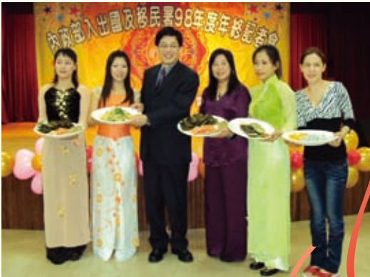
99.01.29 本署年終記者會 - 新住民來辦桌、展示異國美食饗宴