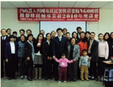
99.01.07 謝署長與苗栗縣NGO團體舉辦移民輔導業務座談會