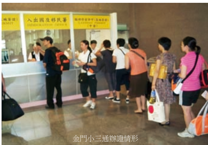
金門小三通辦證情形

( http://taiwanwhatsup.immigration.gov.tw )