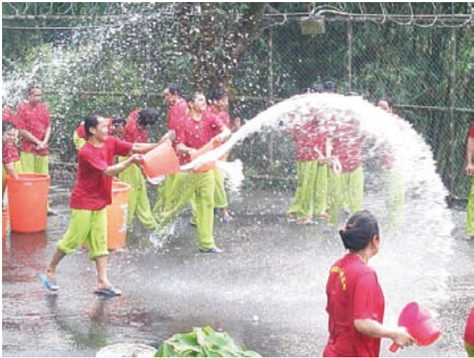
受收容人歡喜過潑水節