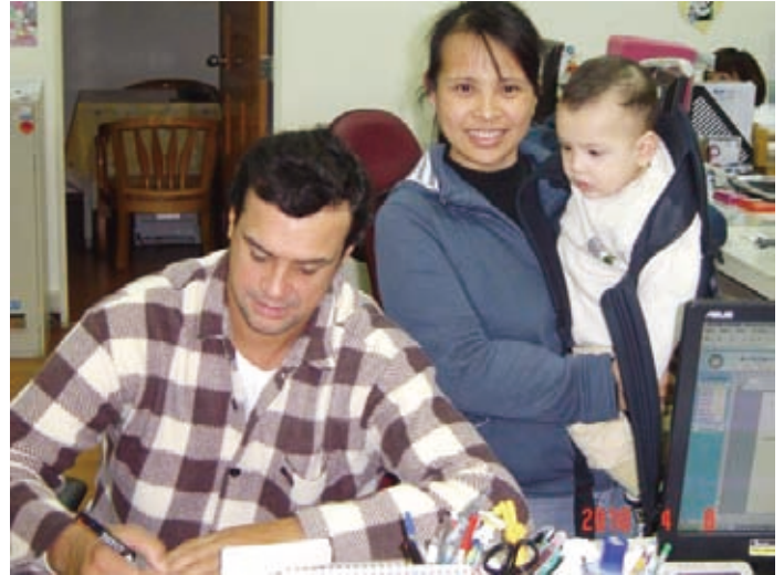
全家人從此展開新的生活

我16歲時父母因病雙亡，隔年（1992）隻身從距離臺灣1萬3千多英里遠的烏拉圭，飛行26個小時來到臺灣，依靠唯一親姐，但是在同一年，親姐與姐夫離婚，無力再照料我及幫我申請在臺居留。那時起，我沒有合法身分，從此開始了將近18年的流浪生活，在基隆與花蓮間過著閃躲警察及移民官的日子。