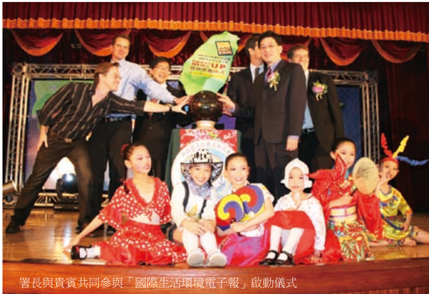
署長與貴賓共同參與「國際生活環境電子報」啟動儀式

行政院研考會所發行《國際生活環境電子報Taiwan What's Up》，自今（99）年4月15日第45期開始，改由本署接續辦理發刊事宜。歡迎各界人士至「移民署全球資訊服務網」及「外國人在臺生活諮詢服務網」免費瀏覽訂閱。