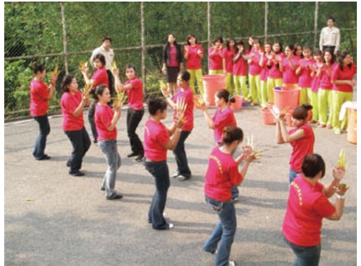
受收容人表演泰國民俗舞蹈