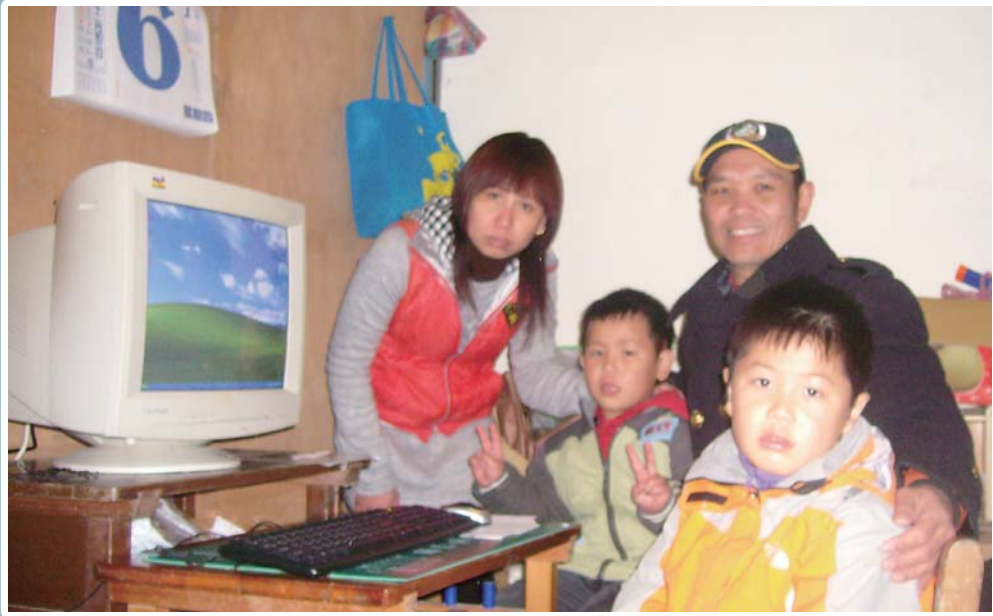
移民署連江縣專勤隊於執行外籍人口的普查工作關懷弱勢外配家庭協助新移民之子取得電腦

移民署所屬轄區最小的「連江縣專勤隊」，執行地區人口及住宅普查任務，同時發揮最大關懷，協助外籍配偶取得1台已報廢但堪用的免費電腦，孩子們高興的說這是他們最好的新年禮物了。