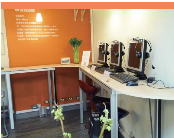
城市學堂所設置電腦E化環境供新住民線上查詢