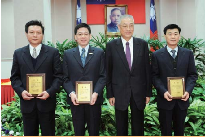
行政院吳院長(右2)親頒獲選出國短期研習人員獎牌1面予農委會副主委王政騰(左1)、移民署長謝立功(左2)及教育部體育司長王俊權(右1)

為加強培訓高階公務人員以拓展其國際視野，並針對國家當前重要政策推動之需要，行政院於建國百年首度開辦選送簡任第12職等以上高階公務人員出國短期研習，並於100年2月16日核定選送行政院農業委員會副主委王政騰、內政部入出國及移民署長謝立功，以及教育部體育司長王俊權等3人。為此，行政院吳院長於100年3月3日親自頒發獲選出國短期研習人員獎牌1面，除肯定面對全球化競爭趨勢，公務人員應拓展國際觀之重要性，並期勉獲選出國研習的3位文官能充分學習並致用，同時勉勵所有高階文官能夠本著為國服務的精神，持續學習創新精進，扮演提升國家競爭力之重要推手。