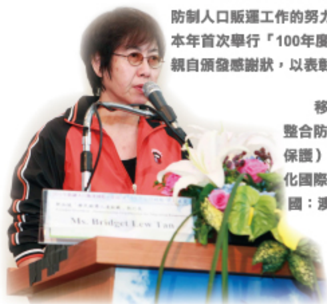
← Ms.Bridget Lew Tan女士（新加坡「移民經濟人道組織」執行長），是新加坡倡導移工勞動人權的先鋒，為2011全球防制人口販運十大英雄之一

移民署長謝立功表示：「今年國際工作坊的主軸理念，即在於整合防制人口販運的4P工作：Prevention（預防）、Protection（保護）、Prosecution（起訴）及Partnership（夥伴關係），並強化國際合作關係。」工作坊議程特別擴大邀請各國政府官員（共計6國：澳洲、美國、越南、蒙古、新加坡及澳門等18人）非政府組織