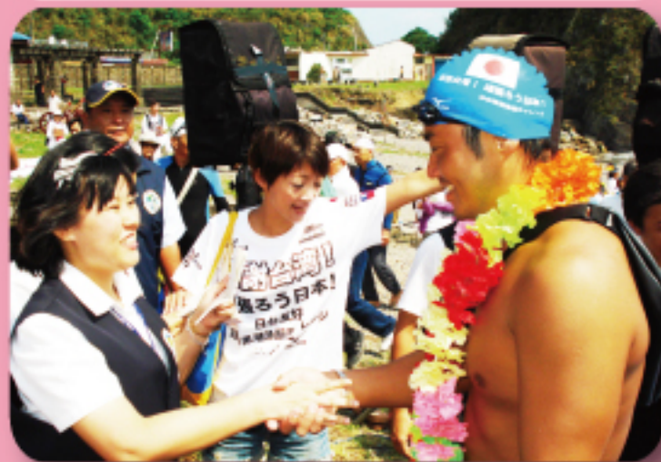
↑ 日本泳士在蘇澳豆腐岬海岸接受移民署基隆港隊移民官入證核對與入境查驗通關程序

日前國際機場協會（ACI）所做的「機場服務品質調查評比」中，移民署負責的旅客查驗相關項目--「證照查驗的等候時間」、「查驗人員是否有禮貌和樂於助人」、「入境證照查驗」均名列前茅，無論機場、港口，身為國門的守護者，移民署查驗人員兢兢業業，提供最優質的通關查驗服務，不僅獲得國人稱許肯定，更贏得國際的高度重視與評價。我們將更加努力，再創佳績，是的，我們一定會做到！