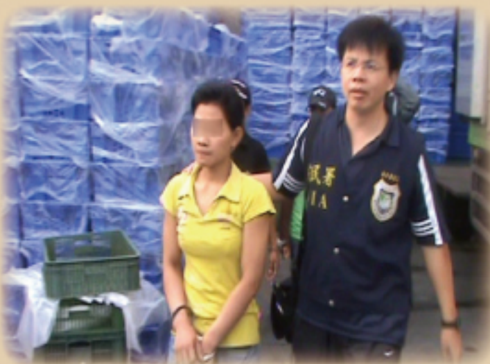
↑ 移民署屏東縣專勤隊查獲9位非法外籍勞工

因該宰鴨場幅地廣大，並裝設監視系統監控大門及過濾訪客，控管人員進出，只有上、下班時間才短暫開門。專勤隊第一次去查緝時，沒逮到非法業者，沒想到業者除了找人來關心之外，還在外造謠，說成是專勤隊擾民。