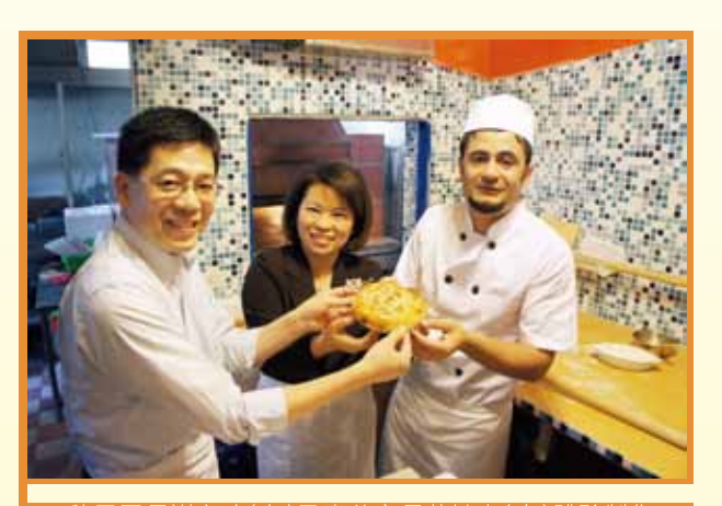
▲ 移民署長謝立功(左)及嘉義市長黃敏惠(中)體驗製作 土耳其式窯烤麵包

100年12月9日國際移民日前夕·移民署長謝立功與嘉義市長黃敏惠特別前往拜訪駱庫曼夫婦·除了親手體驗製作土耳其式窯烤麵包·品嚐道地土耳其美食Pide(土耳其披薩)外·並與駱庫曼夫婦話家常·感受新移民家庭在溫馨諸羅城落地生根的幸福與快樂。