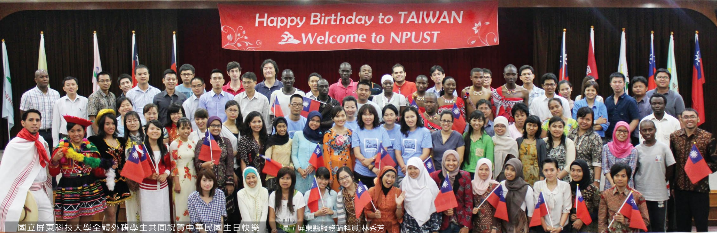
國立屏東科技大學全體外籍學生共同祝賀中華民國生日快樂