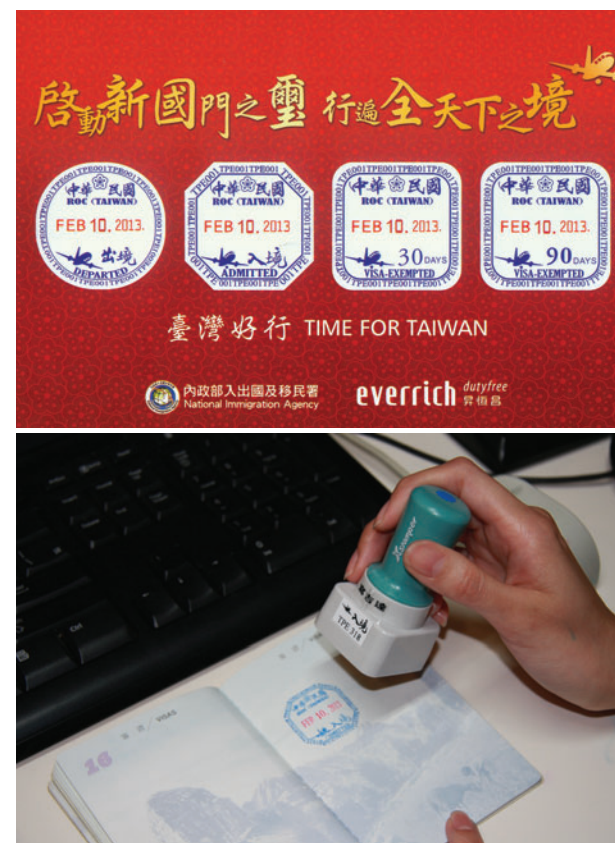
▲ 新版入出境查驗章結合書法大師題字，兼具防偽與藝術風