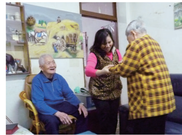
◀ 越南籍看護工阿桃描述辛苦工作到脖子都看不見的阿伯，藉以表達越南農夫們養家的辛勞。