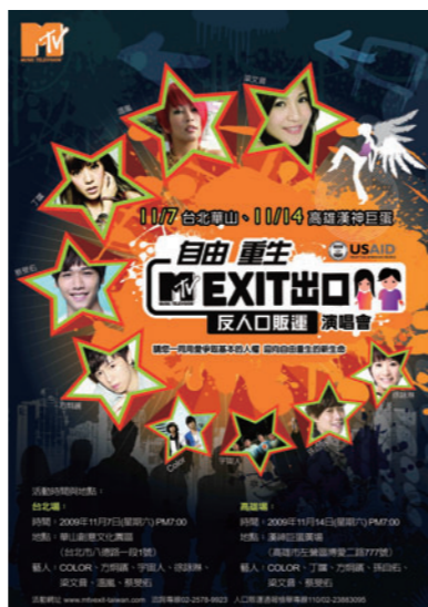
「自由重生—MTV出口反人口販運演唱會」文宣海報 ▶

2009年，移民署、財團法人勵馨社會福利事業基金會、MTV歐洲基金會合作舉辦「自由重生—MTV出口反人口販運演唱會」，以現場活動宣傳防制理念—「自由重生 停止人口販運」、「請您一同用愛爭取基本的人權」、「迎向自由重生的新生命」等，喚起民眾對於反人口販運活動的重視。