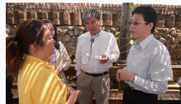
▲ 李鴻源部長(右二)與謝立功署長(右一)聽取民眾詢問有關政府對新住民照顧輔導措施建言。

日前，內政部長李鴻源率移民署長謝立功一行人特別來此感受這樣的「開心」，讚許之餘更對新住民家庭回饋社區的心表示敬佩。訪談至此已是傍晚，望著農場的門口，發現此刻西衛海域映滿了來自西嶼的金色夕照，漫天的晚霞，再加上令人心曠神怡的海風，絕美的情境叫人陶醉無比，而在表達欣羨後，馬玉蘭女士笑著說：「心動了吧！這兒一直都是如此(美)，趕快加入吧，你就可以天天開心又幸福。」