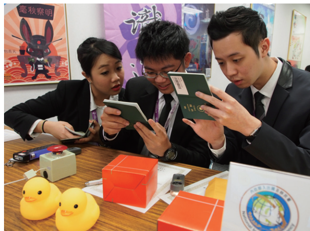
▲復興航空參賽代表於比賽中認真地辨別護照。

比賽 可回溯自5年前，國境事務大隊前任大隊長鐘璟琨曾說：「隨著科技日新月異，偽造技術日益精進，把守第一關的移民官要能不斷學習，找出偽造的護照，將這些非法持有護照人士揪出來，避免危及國境安全」，並交由所屬鑑識調查隊承辦，期望構思活潑新穎的創意來達成這項目標。為了激勵基層移民官的學習風氣，又可兼顧訓練檢驗的成果，辨識達人比賽就此誕生。比賽配合時空背景及國家政策，每年比賽都有不同的主題，今年邁入第五屆，主題聚焦在「辨識為證照查驗之母」，頗有追