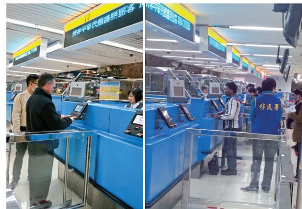
▲入境旅客於高雄小港國際機場使用「外來人口個人生物特徵辨識系統」之實況，身旁有工作人員指導其操作系統。

系統擷取資料將作為旅客於出境時驗證之用，同時再次進行臉部及指紋比對工作，確認入出境旅客是否為同一人，為防止偽造、變造護照者入出國境，這套系統也能輔助查驗人員進行三方比對，防範不法人士入、出國境。此系統使用方法便捷，並不增加查驗時間，也不增加查驗官負擔，查驗官可專注於查驗工作。