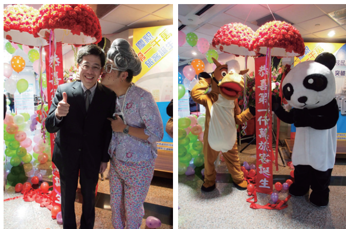
▲於桃園機場舉辦的自動查驗通關系統突破1000萬人次慶祝活動，請來人偶和楊婆婆暖場炒熱現場氣氛。

產品組合送給旅客，讓「千萬幸運兒」出差返國，當場感到既驚訝又歡喜，一回國就收到豐富大獎。