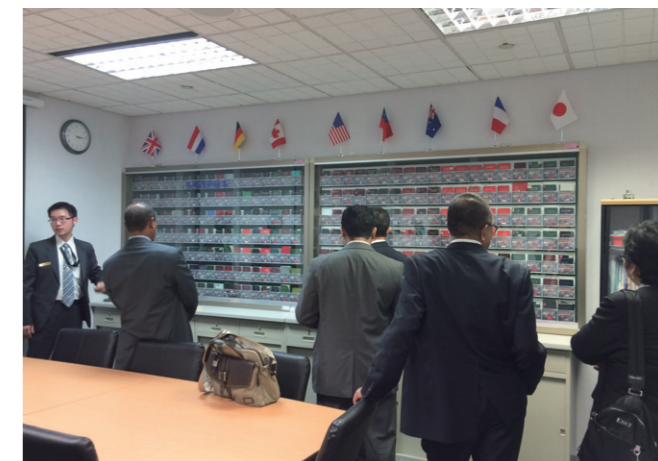
▲印尼移民總局國際合作處Teuku Syahrizal Agam處長與調查執法處Mirza Iskandar處長等人利用此次交流機會還參訪了移民署臺北收容所國境事務大隊，參觀了自動查驗通關系統 (E-Gate)、鑑識調查室以及入出國管理監控中心，雙方就國境安全管理等議題進行意見交換。圖右為參訪國境鑑識調查室的畫面；圖左為參訪國境機場證照查驗作業。