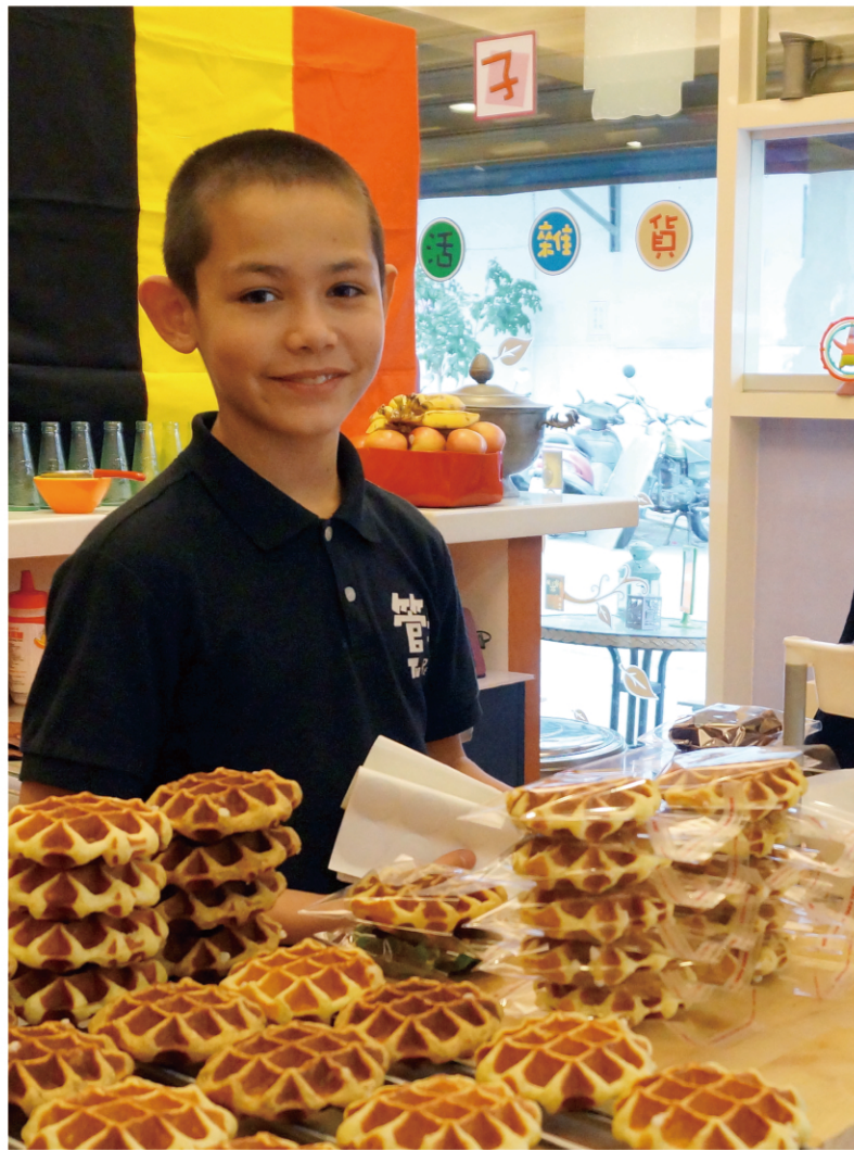
▲ 小管子們從小就要幫忙家計，協助顧店顧攤、打掃整理店面、招呼客人、包裝鬆餅等等...當然大管子還要幫忙照顧弟妹妹。5個兄弟姊妹中排行老大的大哥偷偷說，他覺得幫爸爸包裝鬆餅還比照顧妹妹輕鬆呢！

幾年後因著管子媽對歐洲的惦念，帶著兩個小管子，舉家移居管子爸的故鄉-比利時唯一有海岸線的布魯日省。管子媽認真學習別稱弗拉芒語的比利時荷蘭文：「這是一整區方言的統稱，約有610萬人使用，還可再細分。」但是，管子媽說：「實在太難了！」加上管子家離法國邊界只有幾分鐘車程，想工作也得會法文，她說：「我們住在荷語區，但工廠放眼望去幾乎都是來自法國的女工，因為他們不像比利時人要繳那麼高的稅，找工作反而有利。」雖然我們很羨慕幾個小管子因此從小就會講中文、臺語、弗拉芒語、法語和英語，但管子媽「被無情的荷蘭語和狡猾的方言擊敗了！」