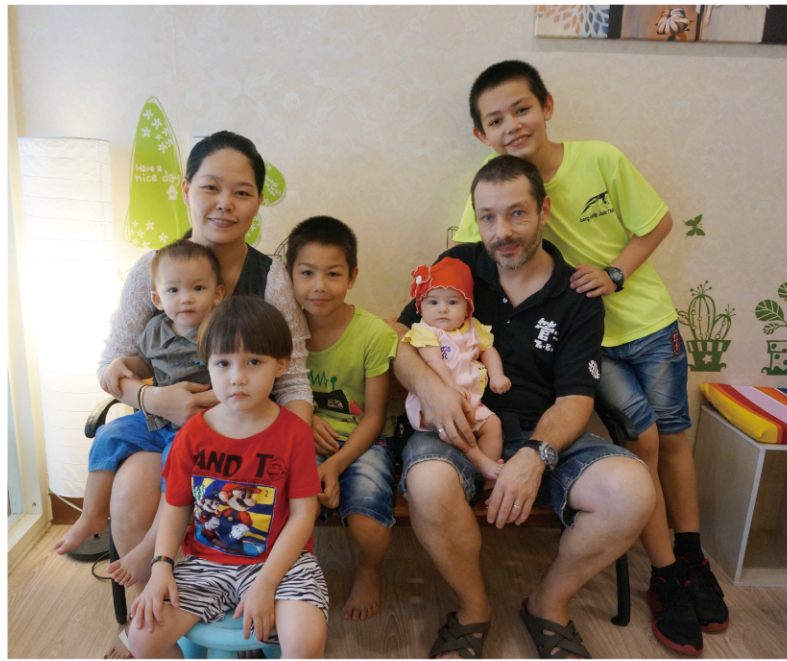
▲ 管子一家7口=管子爸+管子媽+4個小管子+迷你管子公主。