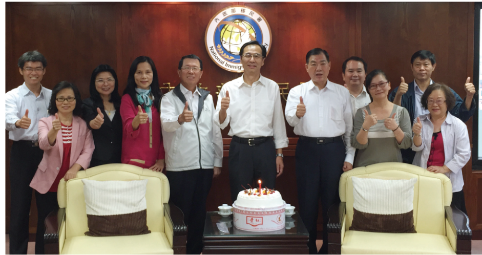
▲ 移民署長莫天虎就任滿1週年，同仁紛紛表達對移民署的期許與感想。