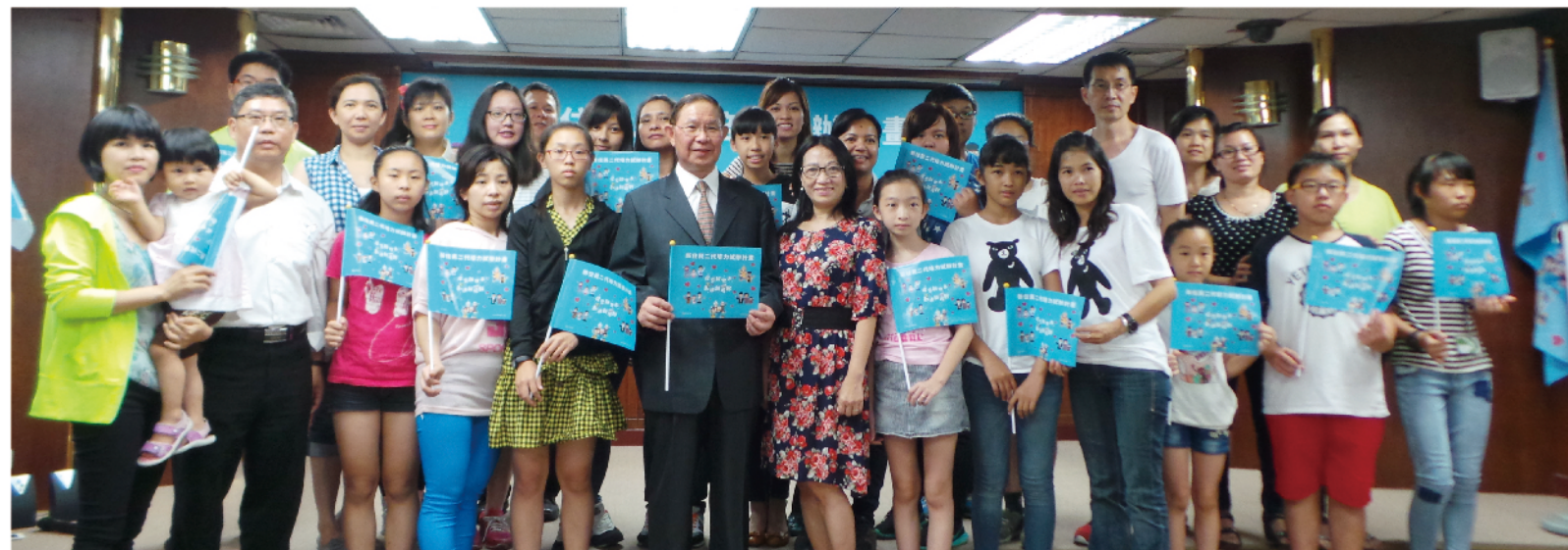
▲ 104年6月27日舉行之新住民二代海外培力試辦計畫行前說明會，由移民署張琪副署長(前排右8)為獲獎者授旗。

為 鼓勵新住民子女利用暑假回到(外)祖父母家進行家庭生活、語言學習與文化交流體驗及企業觀摩體驗，並於返臺後分享相關成果，培育多元文化人才的種子，本署首次辦理新住民二代海外培力計畫。而本活動係以在臺合法居留或已歸化之越南、印尼、泰國、緬甸、柬埔寨、菲律賓、馬來西亞籍等新住民家庭及同校教師或主管為主，期透過學習東南亞語言、多元文化交流、家庭生活體驗、培育經貿人才以接軌國際，鼓勵新住民及其二代與隨行教師均能勇於探索新世界、創造新視野，拓展國家發展新契機。