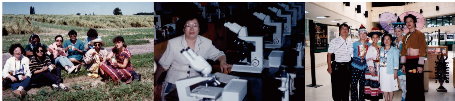
左+中：張組長(左張左1)任職農林廳時赴德參加種子種苗經營管理課程，與來自15國的同儕交流學習。右：張組長(右3)曾任文化局副局長，並以當時的經驗為基礎，推動後來的移民輔導業務。

績效目標導向的張組長正義感也很強烈，在內政部門時還曾因此被稱做俠女。她認為公務員應有所作為，要不斷檢視工作：「只要有心，就能看見問題。」為因應兩岸交流業務急速成長，推動大陸地區專業商務人士來臺線上申辦及陸客來臺觀光連件處理機制：「沒有這些機制之前，急著辦證要來臺的人到處拜託，這種壓力對公務員和其他申請人都不公平，建立制度更能便利申請人規劃行程，提供彈性便民服務。」e化和制度化，也是政府企業化經營的代表：簡政便民及透明快速的政策，才能使民有感。張組長表示她也非常感謝同仁願與她一起達成目標：「國家栽培我幾十年，有機會就把行政經驗和歷練回饋給同仁。希望同仁從做中學中成長，提升自我能力。」