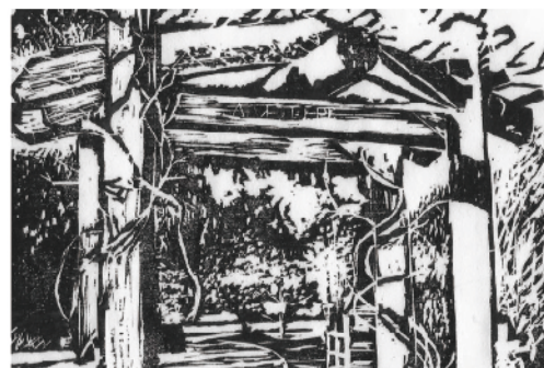
張組長的興趣是旅遊與畫畫，投入繪畫世界中可以放鬆心情，圖為張組長的兩幅版畫作品。

後來張組長任職市長秘書，接觸到各局處不同領域的專業並培養目標導向能力，後又任職文化局，開始學演藝策展和古蹟修葺。面對不斷轉換的跑道，張組長的秘訣就是「認真」：「第一分鐘就開始工作。來之前我也會怕，但敢來就要做，一晃眼幾年就過了，人生不能白走一趟。不要浪費光陰，好好學習，豐富生命，拼命做，累積能力，不會就學！我走了那麼多不同領域，接觸的都是專業團隊，我是來跟同仁學習的。學會了，善用專業，提升績效、解決問題、完成計畫！所以同仁跟著我做事情很辛苦，但培養人才很重要！我鼓勵同仁做中學。任何事都是學習，例如去開會就能看別人怎麼講話和主持會議。同仁不要妄自菲薄，視野要高，要設定自己可以做高一層級的工作而不只是手上這份，有天你升上去，要有能力承擔。」