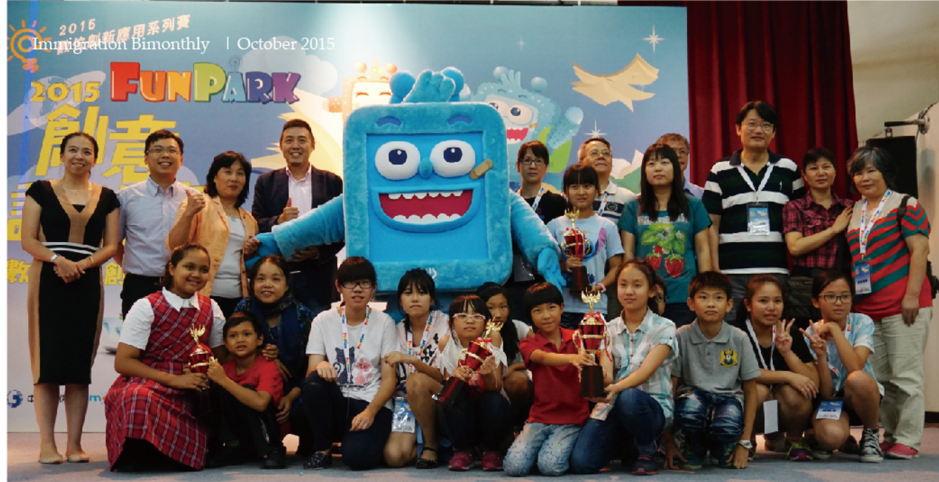
▲ 本屆新住民組獲獎學生大合照。