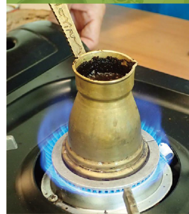
埃及咖啡是用壺煮的，真正的「咖啡」。