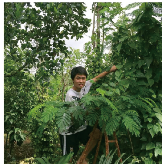
▲ 嘉潤採集cam cam的葉子，這種葉子清洗後放入水中搓揉，會產生黏稠汁液，最後可以做成像愛玉一樣的食品。