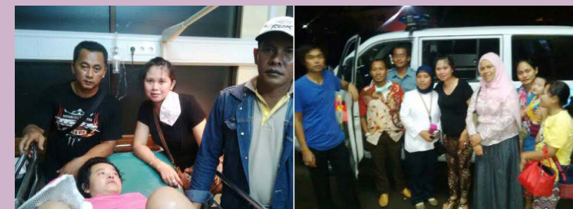
小娜平安與家人會合，家人回傳照片報平安。

則減免部分醫療費用，並聯絡海外印尼分會及阿娜家屬前往雅加達機場接機，派遣1名醫師隨機護送至印尼。至此，阿娜在善心人士贊助與各方單位的協助下，順利返抵印尼雅加達機場。