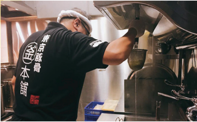
下釜先生家的拉麵都是當天製作的，加上自家熬煮的豚骨高湯，也就是日文中「二刀流」兩者皆優的意思。

湯頭由中央廚房統一出貨。但是下釜家每天提供的拉麵，都是當天自己製作，自家製麵一點也不馬虎，豚骨高湯也是由自家熬煮，拉麵裡的麵條與湯頭都是自家自製，就是日文中「二刀流」兩者皆優的意思。