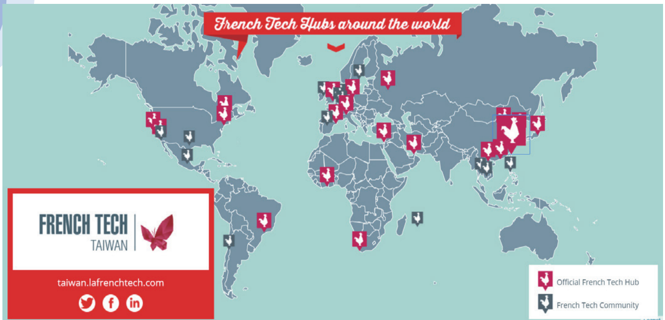
臺法科技工作坊 French Tech Taiwan (紅色為正式 French Tech Hubs, 灰色為 French Tech) 及其新創生態圈分佈

法國協調包含政府及民間資源推動科技新創公司，是以國家的高度延攬國際人才及資金，其法國科技計畫之構想或設計的「法國科技之門」(French Tech Ticket) 競賽(取得新創公司資格)等雄厚策略布局，更有助於我們理解其外人居留便利優惠措施背後的精神。