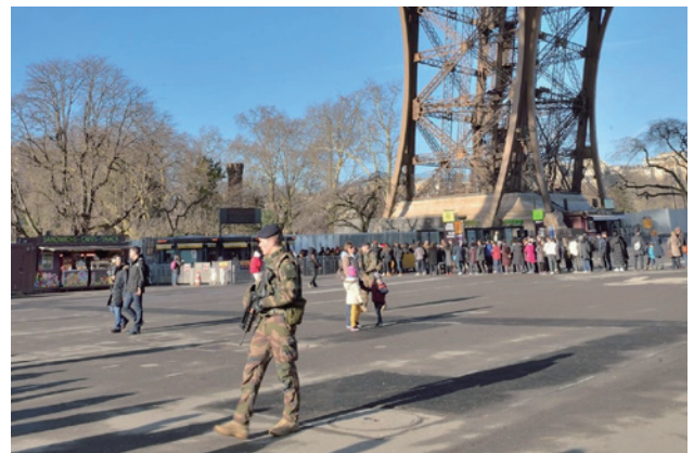
2015 年恐攻後法國在公眾熱點執行哨兵計畫的巡邏軍人。

歐洲難民危機產生大量人流移動及民眾對於人口販運問題的疑慮，因此法國總統馬克宏一方面強調與德國同採開放接納難民態度，或前述放寬高端及創業人才的居留，也一方面希望加強查緝力道，以因應境內約 30 萬的非法移民 (2017 年執行驅逐非法移民人數超過 10 萬人，較前一年增加 35%)，但是在不辜負歐盟共同庇護政策下，法國移民政策是否終能走出所謂同時兼顧平衡接納與拒絕的折衷路線，值得期待與觀察。