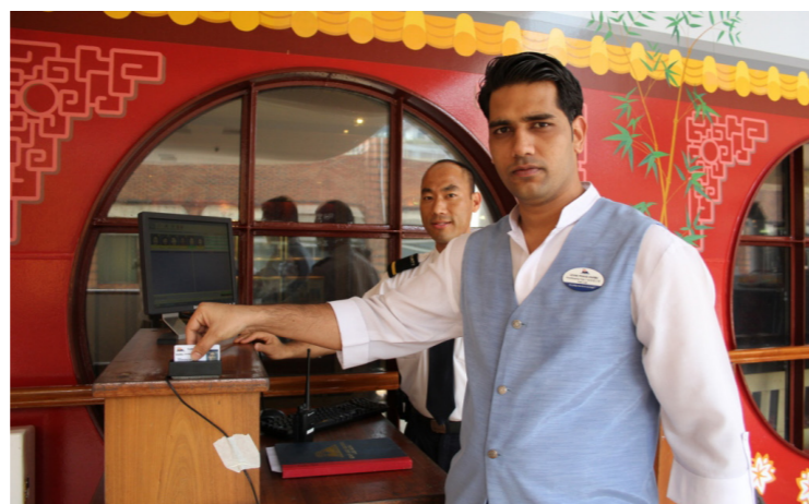
準備登輪的郵輪工作人員，正在進行身份驗證。

像這種大型郵輪推出的旅遊方式，大多是每次靠岸只在一個地方短暫停留，接著又上船，航向下一個城市或國家。因此這些旅客來臺的時間，往往僅有一天甚或不到半天。雖然他們停留的時間相當短暫，但防守國家大門的入出國查驗工作還是不能等閒視之，因此，為便捷大批旅客迅速通關，不至於在極短的停留時間內還要堵塞在上下船的查驗關卡等待，讓這些來臺旅客都能有較充裕的時間觀光，移民署基於便民服務之要旨，配合航商的需求，事先安排移民官搭乘飛機至該郵輪來臺之前一港口點上船，並於郵輪航行來臺途中，即由移民官於船上進行證照查驗，此勤務即為「前站查驗」。