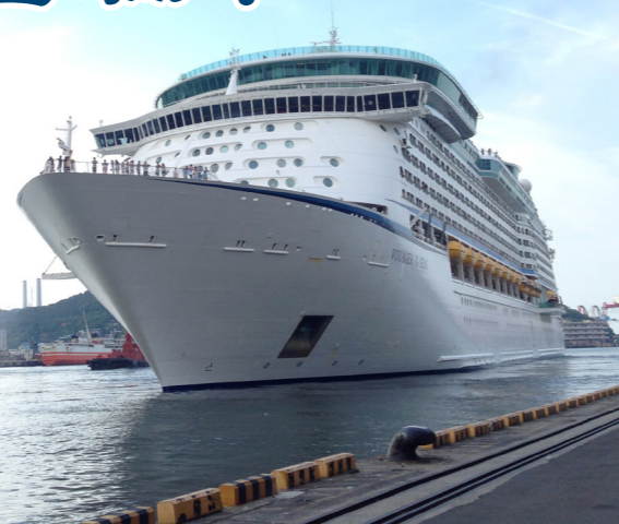
每艘郵輪載運量越高，就代表移民官業務量越大。

像這種大型郵輪推出的旅遊方式，大多是每次靠岸只在一個地方短暫停留，接著又上船，航向下一個城市或國家。因此這些旅客來臺的時間，往往僅有一天甚或不到半天。雖然他們停留的時間相當短暫，但防守國家大門的入出國查驗工作還是不能等閒視之，因此，為便捷大批旅客迅速通關，不至於在極短的停留時間內還要堵塞在上下船的查驗關卡等待，讓這些來臺旅客都能有較充裕的時間觀光，移民署基於便民服務之要旨，配合航商的需求，事先安排移民官搭乘飛機至該郵輪來臺之前一港口點上船，並於郵輪航行來臺途中，即由移民官於船上進行證照查驗，此勤務即為「前站查驗」。