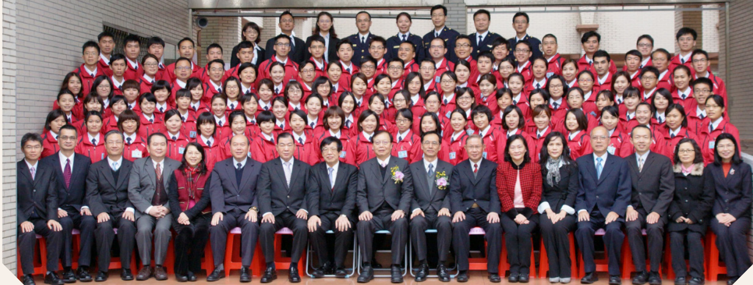
1050131 內政部長陳威仁(前排中)蒞臨移民署移民班第四期學員專業訓練開訓典禮。