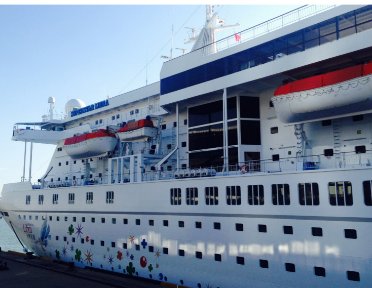
◀ 大船入港囉 ~

前站查驗究竟是什麼呢？這項查驗勤務是起因於近年來，郵輪旅遊之觀光風氣盛行，愈來愈多國際旅客選擇搭乘大型國際觀光郵輪到世界各地旅遊，通常一架班機至多搭載約 100 至 300 人，不過以大型郵輪為例，例如海洋航行者號、鑽石公主號、寶瓶星號等，搭載旅客量高達約 1,000 到 3,000 人，相當 10 至 20 架班機同時入境。旅客選擇搭乘郵輪旅客人數年年屢創新高，曾創下最高紀錄旅客量是 104 年 12 月 23 日入境我國港口之「海洋量子號」，該郵輪搭載共計 4,215 名旅客來臺觀光。