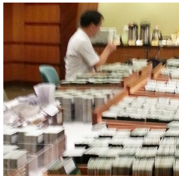
「就是這麼搖！」移民官在深夜於搖晃的船上進行護照檢查，看了這張照片是否就能感受到船搖晃的程度呢？

許多人乍聽這個任務的內容時，都對移民官在船上查驗的工作產生好奇心。然而，就像一般人總覺得搭飛機到國外出差感覺很好，但是其中的酸甜