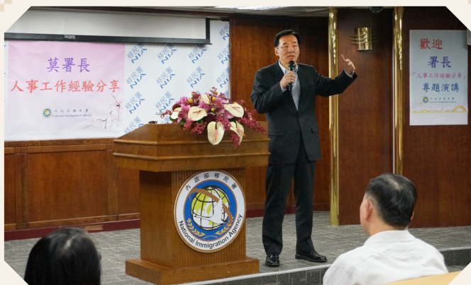
1050304 移民署長莫天虎進行人事工作經驗分享。