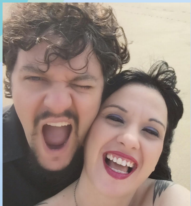
文 / 秘書室 丁周平