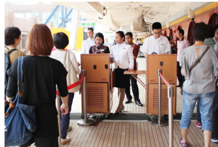
準備上船離境的旅客。

國際郵輪的船舶就像是同時容納幾千人的海上移動城堡，有游泳池、健身房、餐廳、免稅商店及 KTV 等娛樂設施，但其實在移民官登船工作的過程中，幾乎是沒有機會使用船上設施的。國際郵輪的載運量多，也就代表移民官的業務量大，加上查驗時需要傳輸資料，在海上通訊遠不如岸上方便，需要花更多時間處理，且若真遇上有問題的證件，移民官也須即時處理解決，為的就是希望在旅客抵臺下船前的這段時間內，就能夠順利查驗完畢。所以在每次的前站查驗勤務中，很多情況都是難以掌握的未知數。