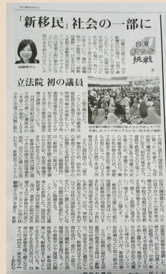
國外媒體採訪我國第一位新住民立法委員林麗蟬，並簡述臺灣移民之古往今來。

麗蟬：誠如我剛剛所言，就是由下而上，照顧弱勢，發現優勢。只要新住民的優勢能夠發揮，像很多企業家或臺商需要這些人才，國人也能因此理解多元文化的重要性。國人理解為什麼我們要照顧新住民，新住民體認到我國對待新住民是非常友善照顧的，國際上也瞭解到我國是一個人道、先進的国家，就能創造出一個雙贏、甚至多贏的結果！■