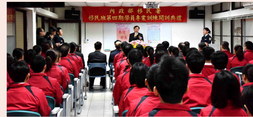
移民班第四期於訓練中心開訓,內政部長陳威仁(中)親自主持。

最後,署長希望同仁一起繼續努力,提升本署辦公廳舍自有率,改善同仁辦公環境:目前本署中區事務大隊辦公大樓興建工程已動工,宜蘭、苗栗、嘉義(站、隊)辦公廳舍興設計畫已奉核定,基隆、桃園、高雄的計畫也在進行中,德景營區的北區事務大隊興設計畫評估作業也即將完成,亟盼能儘早定案,展望未來! ■