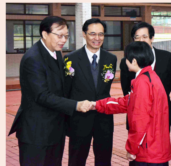
內政部長陳威仁(左1)親自勉勵移民班學員為國所用。