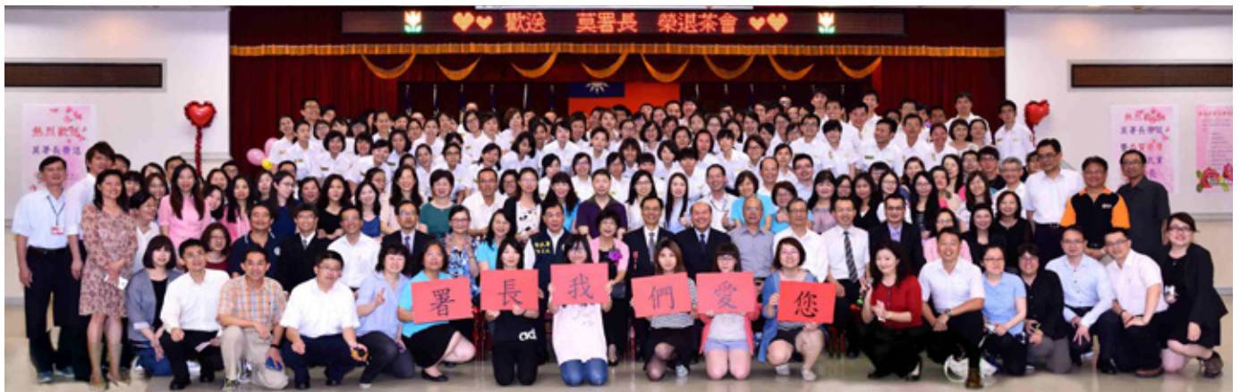
105年5月6日莫前署長天虎榮退歡送茶會上，同仁依依不捨的表達對莫前署長的尊敬。莫前署長來到移民署短短近兩年的時間，但其低調捨己的態度和體恤下屬的舉動，贏得同仁們的感念和愛戴。

指導單位/ 行政院 主辦單位/ 內政部 承辦單位/ 內政部移民署 新住民發展基金 廣告