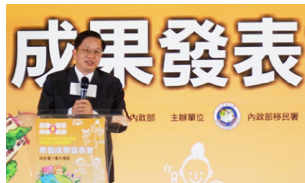
內政部邱昌嶽次長出席成果發表會現場，鼓勵新住民二代串起母親故鄉的血緣與文化。

邱昌嶽次長表示，移民署本次擴大舉辦「105年新住民二代培力計畫」，不限國籍地區別並增加寒假梯次，鼓勵新住民子女利用假期回到(外)祖父母家學習語言、生活體驗及文化交流，同時藉由分享使臺灣社會大眾對新住民多元文化有更實質的認識，並增進族群彼此間的理解與尊重，也能促進新住民及其子女與新住民母國的聯繫與互動，以培育其成為臺灣拓展海外交流與貿易的國際人才。從他們的分享報告中，不僅看到新住民二代對(外)祖父母家的風土民情有進一步的認識外，也可感受孩子與親人之間的相處與互動深有感觸。親人的直接互動，對孩子心靈的啟發，與對家長家人情思的體認，是這項活動最重要的意義。