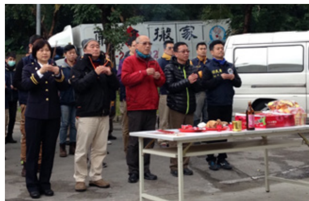
大隊長及大隊部長官率隊及本隊全體同仁在香案前焚香祝禱，在裊裊香煙祝禱聲中，虔心祈求本隊在這塊全新的土地上生根，隊運昌隆。

通常公務機關遇廳舍搬遷，為免影響對民眾的服務，多選擇於假日處理。而專勤隊的業務特殊，24小時不打烊，為求勤務能無縫接軌，1月24日這天，本隊同仁全員到齊，頂著超級寒流來襲的罕見降雪，將辦公廳舍從中正區署本部地下室「瞬間移動」至文山區新廳舍忠誠樓。一批同仁負責採買祭祀用品備置香案，另一批工作人員各自在新舊廳舍部屬待命，引導搬家公司按照排定順序搬運檔案及各區硬體設備。而械彈運送人員荷槍實彈，按照所訂維護運送計畫，將械彈室內之械彈及裝備依序入庫。本隊長官同仁上下一心，打破建置，依照廳舍搬遷細部執行計畫之各項分工，檢視各區軟硬體功能運作情形。