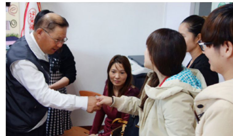
張副署長（左）參加跨部會新住民關懷活動，為新住民加油打氣。

張副署長於 65 年時自文化大學政治系研究所畢業，當時國家執行五年警政建設計畫，張副署長即以優異成績考上美國西北大學赴美受訓，返國後就成為國內最年輕的分局長。雖然公務生涯還算順利，但張副署長也遭遇過低潮，「我 47 歲時，人生最精華的時間，在警政署擔任外事組長兼外事警官隊隊長 8 年沒有調動。我認為公務人員需要歷練，你永遠在同一個職位上，發展就會有局限性，經過不同事情你的看法會改變，不要故步自封。於是我利用那段時間充實自我，去臺大讀 EMBA，也去美國哈佛讀書。」95 年時，張副署長正想退休轉民營單位算了，就被派去保三總隊，「政府原本有意要裁撤這個單位，我去了剛好用我學到的 EMBA 知識去管理，使保三總隊整個振作起來、奠定了如今的基礎。」