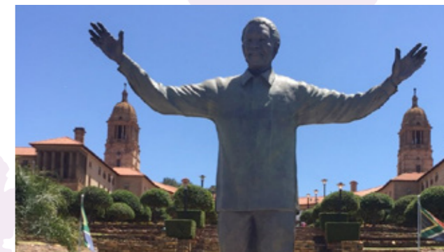
位於普利托利亞的著名的聯邦大樓——南非總統府與曼德拉銅像。

南非出產的葡萄酒是全世界公認優質好喝且性價比相當高的地方，而當地特有的葡萄 Pinotage 所釀之紅酒，更是不能錯過，它是於 1925 年由南非斯泰倫博斯大學第一位葡萄種植系教授 Abraham Perold 將黑皮諾和法國南部特產之仙梭兩種葡萄混種而來，口感上既有陳年深邃的果香馨郁，適合長久保存，又可以是年輕的酒，口感濃郁容易入口。所以，紅酒是來南非必嚐之「土產」。