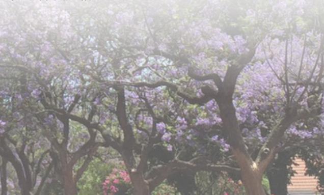
紫葳花夾道盛開，成為普利托利亞 10 月絕美的一景。

普利托利亞 1 年有 3,220 小時的日照時間，與臺北 1 年 1,400 多個小時相比，可是足足多了 1 倍以上。所以不論是春夏秋冬，一年四季幾乎每天都可以感受太陽溫暖光輝的照耀，是個氣候相當宜人的地方，歡迎大家有機會來普利托利亞曬太陽，享受另類非洲風情。■