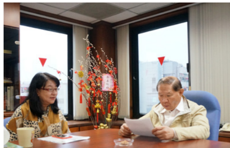
張副署長為人認真親切，接受訪談時也貫徹「確定要做的事情就要好好做」之精神，針對每個問題都預做了準備。

除了事前做好準備可以避免窮忙外，公務員更應透過工作自我成長：「有很多事情是可以不要做的，有很多公文也是沒有效率的。我認為，沒有事情你就不要為了做績效或做給人看而找事情，反而為機關增加很多不必要的事，浪費國家資源。你要自問，你的核心業務是什麼？掌握核心業務，削去所有不必要的事，把人力用在刀口上。要思考若不做這件事，對誰有影響？還有做這件事，是要學習什麼、進步什麼。」最重要的是，「確定要做？那就好好做！」