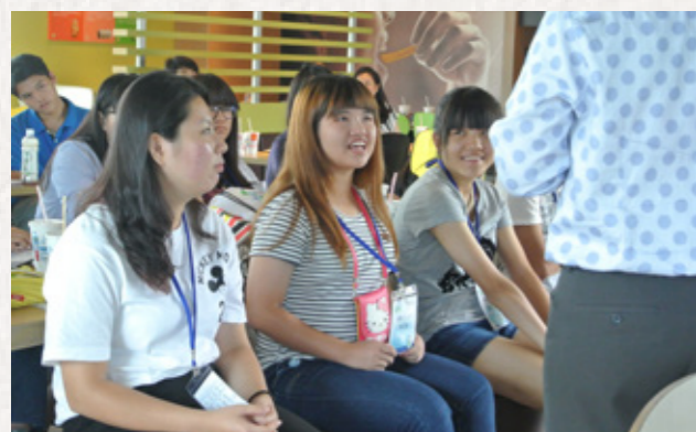
參加研習營的學員參觀臺灣麥當勞，麥當勞帶領學員進行「模擬面試流程」。

105 年新住民二代青年培育研習營目的是協助新住民子女成為拓展新興市場的國際人才，在 5 天 4 夜的研習營中，特結合僑委會、交通部觀光局、臺北市職能發展學院及財團法人海峽交流基金會資源與民間企業團體共同安排一系列職前學習課程、企業見習機會、體驗學習及實際操作等課程，提供充分的就業準備與精采的職場體驗機會，本次活動共計有 50 位新