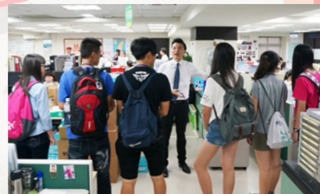
參加研習營的學員參觀東南旅行社，實際參觀員工工作環境。

也不乏真實體驗的系列課程，今年度以「觀光旅遊業」為主題，真實安排導覽活動，再進入到學習如何規劃觀光行程，邀請新住民子女針對觀光行程的企劃，以一個小組為單位，在團隊中發揮自己所長，透過溝通、討論，彼此腦力激盪、相互激發出屬於自己的一套特色旅遊行程，最後讓同學們透過活潑的方式，行銷自己的企劃行程，再由專業委員進行評審，選出最具特色與魅力的前三名行程，不僅能拿到獎金 5 千元，更能和彼此共同分享這學習的榮耀與甜美的果實，未來可使用所設計的旅遊行程邀請新住民子女之祖（外）父母及家人來臺觀光旅遊，促進臺灣與國際連接。■