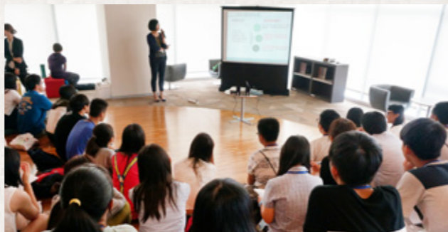
參加研習營的學員參觀中國信託金融園區總部，由中國信託員工講解金融業、新住民二代如何與新南向政策結合。

本屆課程安排非常豐富，邀請到各領域的專家學者說明職場的大小事，以及國家經濟發展和東南亞經濟發展的相互關係，例如：東協 6 國的蓬勃發展，對於新住民子女有著甚麼樣的意義？又給予身為新住