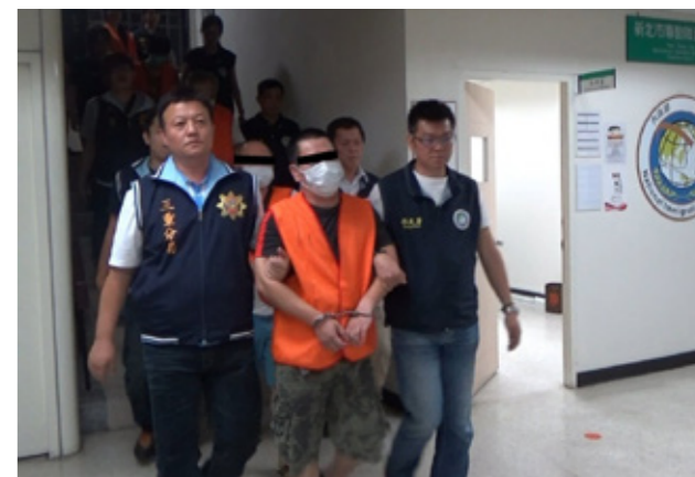
本署同仁查獲偽造居留證相關犯嫌。

也不正常，所以嚮往固定生活方式的人恐怕不適合這份工作。出動之後，難免會有風吹日曬雨淋，有時跟車遇到飛車追逐的狀況，紅單當然也是自己吸收。最慘的恐怕是跟蒐時不能上廁所，有時等了半天，什麼事都沒發生，就在你真的再也忍不住奔向廁所的那幾分鐘，就和嫌犯錯過了。還有為了掌握嫌犯住處、出沒的地方，就算戒備森嚴之下也得想盡辦法蒐證，除了事前推敲之外，更必須視情況靈機應變，偵辦人員也怕被人當小偷啊！」