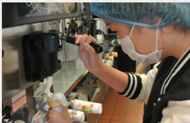
參加研習營的學員參觀臺灣麥當勞，麥當勞帶領學員試做蛋捲冰淇淋。

住民子女參加，他們的父母分別來自大陸地區、印尼、泰國、越南、港澳、菲律賓和馬來西亞等 7 個國家地區，將在團體活動中激盪出新力量。