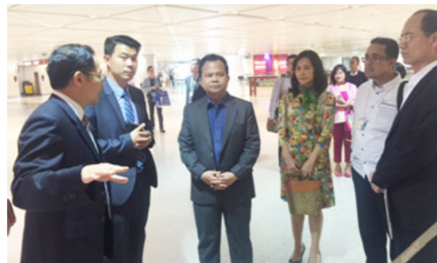
印尼移民總局長羅尼 (中) 參訪桃園國際機場。

會議之餘，我方亦安排印尼移民總局代表團參訪桃園國際機場及宜蘭收容所。羅尼總局長對自動通關查驗系統 (E-gate) 特別感興趣，還拿出自己的護照進行試驗，但由於 E-gate 尚未全面開放給所有外國人使用，移民官很有自信地告知羅尼總局長，這 E-gate 的門一定不會開，也讓這段參訪增添了趣味性。