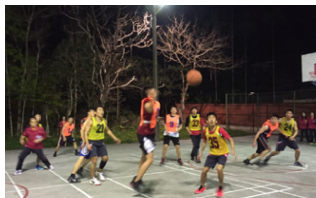
為強健學員體魄，增進團隊合作之情感，學員於夜間在訓練中心進行籃球比賽。

跟著莫前署長健行！記得那天陽光明媚、涼風輕拂，各小隊踏著雀躍的腳步邁出中心大門。從鄰近指南山麓的國立政治大學出發，穿過校園，循二格山登山步道攀登上樟山寺，沿途可遠眺臺北盆地以及高聳入雲的 101 大樓，經過充滿濃濃茶香味的大片包種茶園，學員們一有機會就搶著和莫前署長合影，過程中笑料不斷。