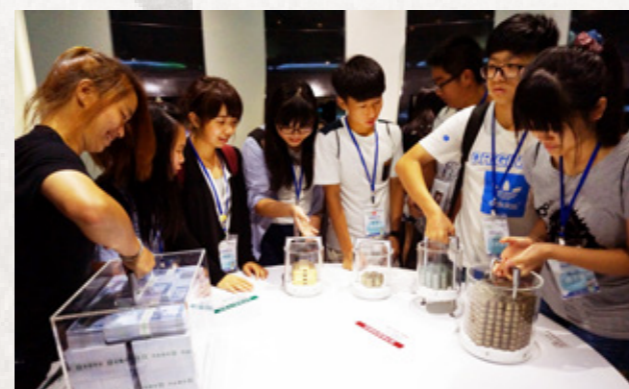
參加研習營的學員參觀中國信託金融園區總部，學員正在體驗「錢的重量」。

民子女的自己甚麼樣的機會？除了在時事脈絡下提供基礎的跨國經貿背景知識外，進一步踏進企業現場，帶領學員們參觀臺灣麥當勞、中國信託和東南旅行社三大企業，讓他們從飲食服務、金融服務和旅遊服務不同的產業別中，除了認識了解到各產業別企業體的文化，也進入到實作現場真實觸碰到工作環境的樣貌，更看見自己未來在就業選擇中的各種機會。