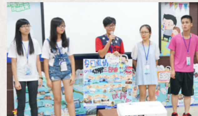
研習營最後一天，學員上臺進行成果發表，分享「夏日風情觀光導遊行程」，榮獲優勝組別。

也不乏真實體驗的系列課程，今年度以「觀光旅遊業」為主題，真實安排導覽活動，再進入到學習如何規劃觀光行程，邀請新住民子女針對觀光行程的企劃，以一個小組為單位，在團隊中發揮自己所長，透過溝通、討論，彼此腦力激盪、相互激發出屬於自己的一套特色旅遊行程，最後讓同學們透過活潑的方式，行銷自己的企劃行程，再由專業委員進行評審，選出最具特色與魅力的前三名行程，不僅能拿到獎金 5 千元，更能和彼此共同分享這學習的榮耀與甜美的果實，未來可使用所設計的旅遊行程邀請新住民子女之祖（外）父母及家人來臺觀光旅遊，促進臺灣與國際連接。■