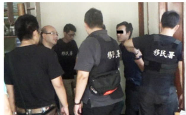
本署同仁執行行蹤不明外勞查處過程。

施視察表示，再來的就更困難了，就算同仁已取得各種證據，但要罪嫌坦承犯行，等於要讓他們面臨冗長的司法程序，並有前科紀錄、繳納罰金或甚至入監服刑等不利的處境，因此絕非易事！在電影或新聞常見到的描述：「對犯嫌突破心防、始偵破全案。」其實事前需要花非常多的時間調閱資料、蒐集證據，掌握了證據之後還要擁有充分的詢問經驗和技巧，才有機會使罪犯坦承犯行。