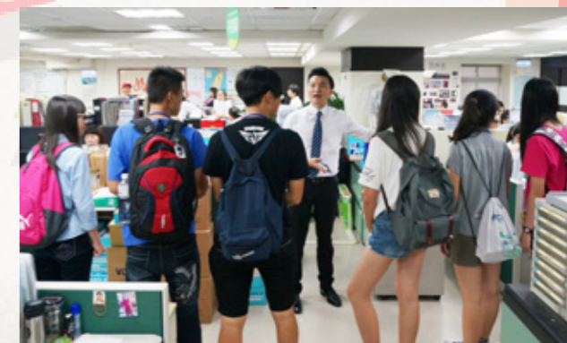
參加研習營的學員參觀東南旅行社，實際參觀員工工作環境。

也不乏真實體驗的系列課程，今年度以「觀光旅遊業」為主題，真實安排導覽活動，再進入到學習如何規劃觀光行程，邀請新住民子女針對觀光行程的企劃，以一個小組為單位，在團隊中發揮自己所長，透過溝通、討論，彼此腦力激盪、相互激發出屬於自己的一套特色旅遊行程，最後讓同學們透過活潑的方式，行銷自己的企劃行程，再由專業委員進行評審，選出最具特色與魅力的前三名行程，不僅能拿到獎金 5 千元，更能和彼此共同分享這學習的榮耀與甜美的果實，未來可使用所設計的旅遊行程邀請新住民子女之祖（外）父母及家人來臺觀光旅遊，促進臺灣與國際連接。■