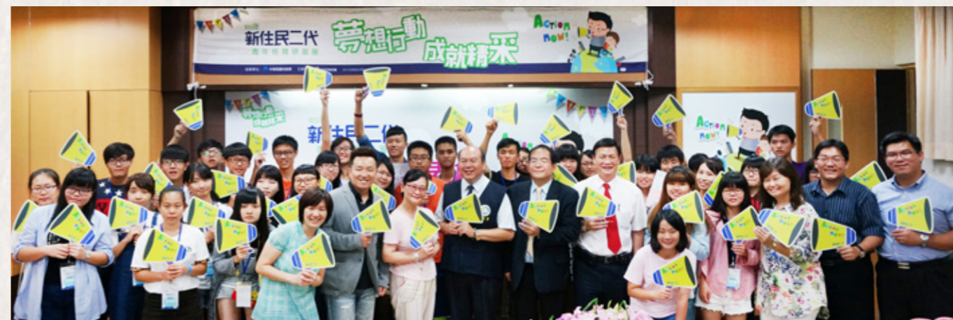
5 天 4 夜的新住民二代青年培育研習營在學員滿滿的收穫與歡呼聲中，完美劃下句點。