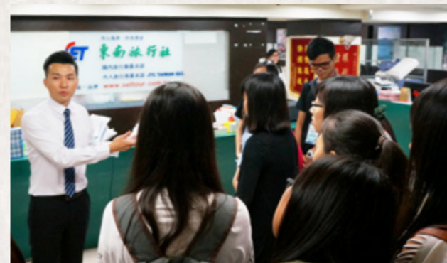
參加研習營的學員參觀東南旅行社，由東南旅行社員工講解旅行業區分為網路、外人等部門。

在麥當勞，我們看見跨國飲食服務業的地球村思想；在中國信託則能知道金融業前進東南亞的遠見；在東南旅行社，發現自己具備的語言能力將成為自己未來進入職場的利器。連續的 5 天的緊密課程當中，