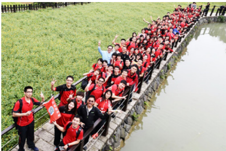
莫前署長帶領訓練中心同仁及 4 期班學員一同郊遊踏青。

訓練中心實施集中住宿的管理措施，開訓以來 2 個月，期待好久的 4 月 1 日，4 期學員終於可以外出