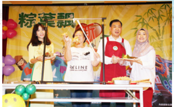
105年6月4日平常也會下廚做菜的移民署長何榮村(右2),化身成主廚教新住民一起學包臺灣粽。