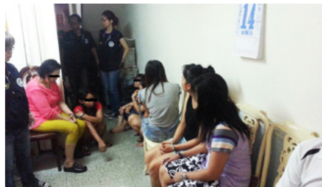
本署同仁於容留處所查獲行蹤不明外勞。

施視察認為，同仁對於常態形勤務加以熟稔之後，對業管案件的處理程序、法令規定會有相當程度的瞭解，也可培養出對不法案件的敏銳度，長時間經驗的接觸、累積後，孕育出對不法案件的邏輯思考能力，無形中對結構複雜的集團性案件或從基本案件衍生、進化的特殊性案件，也可以立即做出反應，從多個面向切入，進行突破，發掘解決之道。