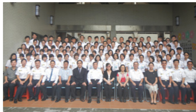
移民班第 4 期 4 等班專業訓練結訓儀式合照。

跟著莫前署長健行！記得那天陽光明媚、涼風輕拂，各小隊踏著雀躍的腳步邁出中心大門。從鄰近指南山麓的國立政治大學出發，穿過校園，循二格山登山步道攀登上樟山寺，沿途可遠眺臺北盆地以及高聳入雲的 101 大樓，經過充滿濃濃茶香味的大片包種茶園，學員們一有機會就搶著和莫前署長合影，過程中笑料不斷。