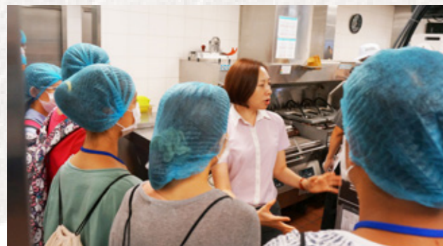
參加研習營的學員參觀臺灣麥當勞，麥當勞員工為學員講解廚房衛生安全。