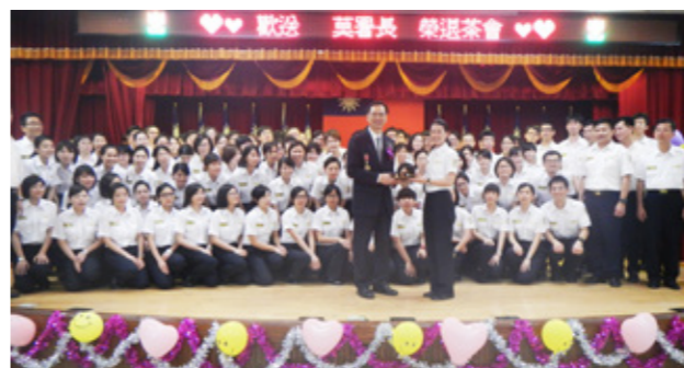
移民班第 4 期學員歡送莫前署長。

6 月 25 日學員共同參與半程馬拉松，何榮村署長還專程到現場為大家加油打氣，開跑前跟同學彼此打趣說，大概 10 公里我們就會不堪腿軟吧！沒想到