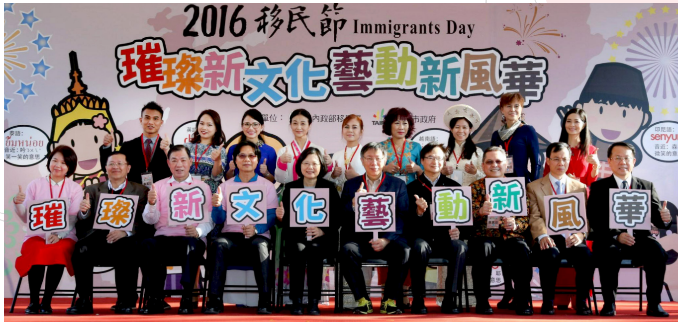
蔡英文總統（前排左 5）、內政部葉俊榮部長（前排左 4）、臺北市柯文哲市長（前排右 5）、移民署何榮村署長（前排左 3）一同為 105 年移民節活動揭開序幕。