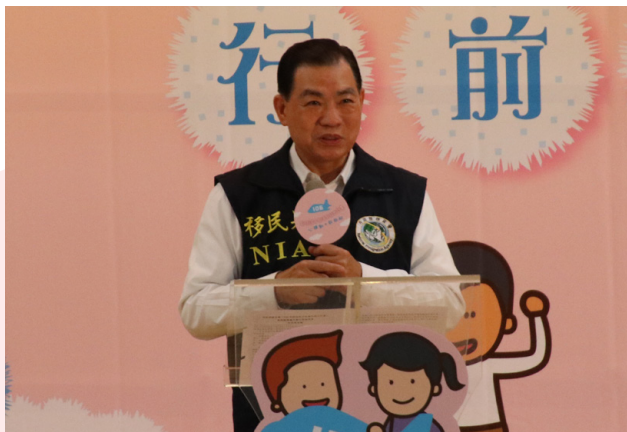
何榮村署長勉勵獲選者透過學習交流，與國際接軌。