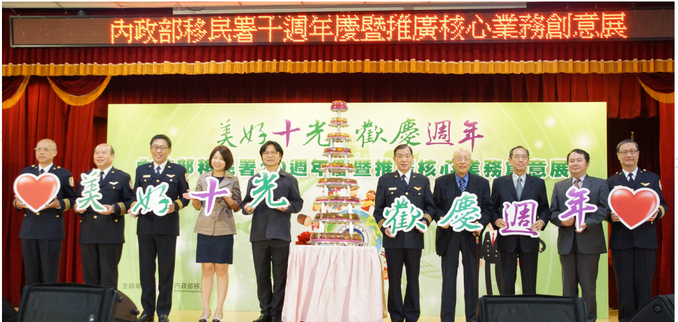
移民署 10 歲生日，內政部長葉俊榮（左 5）及新住民立法委員林麗蟬（左 4）與移民署長何榮村（右 5）及前署長吳振吉（右 3）、前入出境管理局長汪元仁（右 4）等人一起為移民署慶生。