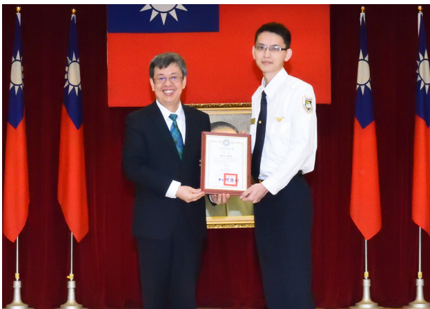
陳建仁副總統與三等訓練成績第 1 名學員陳虹均合影。

副總統致詞時也分享了自身經驗，他說，記得以前每次去美國的時候，進入海關也都要經過嚴格的審查，但是當移民官給他一個微笑和一些尊重時，讓他覺得這是一個很有品味的、很文明的國家。所以，移民官確實代表一個國家的尊嚴，更重要的是要讓人家看到臺灣社會講公義、仁愛，而且好客的傳統。