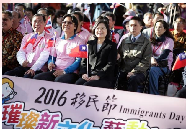
蔡英文總統、內政部葉俊榮部長及移民署何榮村署長參加「105 年移民節活動開幕典禮」。

主社會充滿活力，臺灣會繼續把門打開，包容多元文化，移民與移工都是臺灣的一份子，希望大家關心來自周遭不同的朋友，感受文化交流所帶來的快樂，並向移工及移民朋友說聲「辛苦了，移民節快樂！」