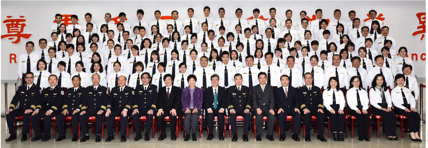
陳建仁副總統於 105 年 12 月 20 日參加本署移民班第四期結業典禮，勉勵新一批結業的移民官除了展現專業外，更要尊重人權。