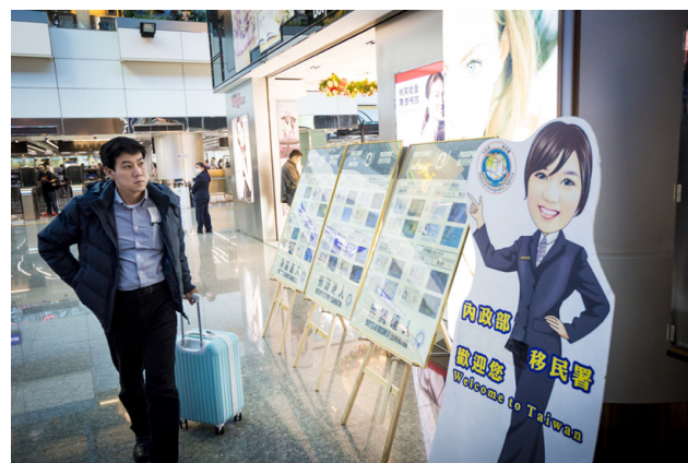
現場展示各國護照樣品、防偽特徵及護照製作介紹。

因此在簡化我國入出境管理流程，推動各項快速通關措施的同時，也必須達到確保國境安全與提升服務效能兩大目標。在這樣時空背景下，國境事務大隊所舉辦的 105 年「辨識達人」比賽便以「查驗零失誤、資料無疏漏」為活動主題，目的在檢視同仁經過這一年中的各類專業訓練及工作經驗累積，阻絕不法於國境並維護國境安全。此外，為了讓旅客實際瞭解本次主題並加深印象，現場還準備了平時用來做為教育訓練用的論文海報，從呈現防偽特徵的角度陳列各國真實版護照樣品，使旅客大開眼界。