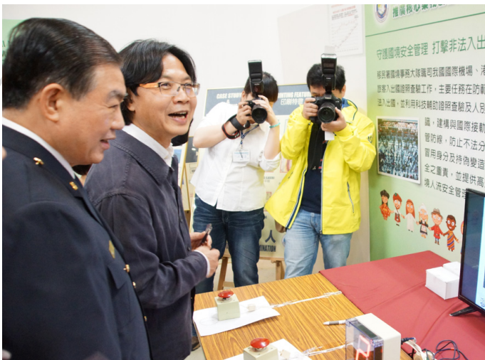
內政部長葉俊榮 (左 2) 參觀移民署推廣核心業務展。

此外，移民署宣布 106 年將開始實施兩項新便民措施。第一項是 106 年元旦起正式推動港澳居民搭乘郵輪來臺者得 1 次申辦 2 張網簽 (1 張 2 證)，供 2 次入出使用，希望能協助業者積極拓展港澳居民搭乘郵輪來臺旅遊之市場。第二項是同樣是自元旦起，役男可於「役男短期出境線上申請作業系統」，申請短期出境，申請獲准的役男，可自行列印核准通知單，並持此通知單出境，不需要再到各鄉、鎮、市、區公所臨櫃或到移民署辦理。