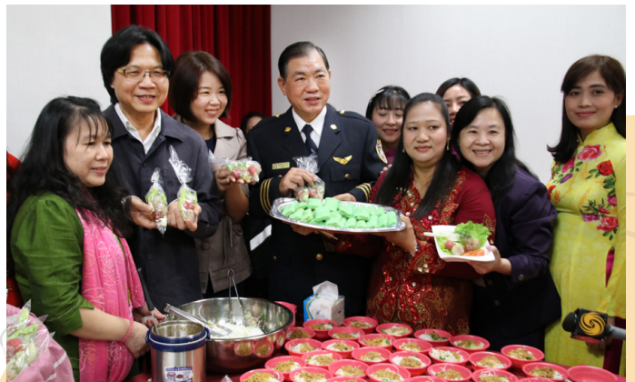
內政部長葉俊榮(左 2)、移民署長何榮村(左 4)以及立法委員林麗蟬(左 3)與新住民姊妹一起開心品嚐緬甸乾麵、泰國肉圓、四川黑糖涼糕以及雲南黃涼粉等各具特色的異國美食。

10 層署慶 3D 立體水晶果凍大蛋糕於大合照後，切塊分享供現場嘉賓及民眾食用，同時還有 6 個異國美食攤位，有印尼椰子捲包紅糖、印尼蝦餅、泰國小肉圓西米球、越南春捲、緬甸乾麵、四川黑糖涼糕、雲南黃涼粉等餐點，都令人食指大動，現場嘉賓與新住民及新二代享受一場豐富的盛典。 ■