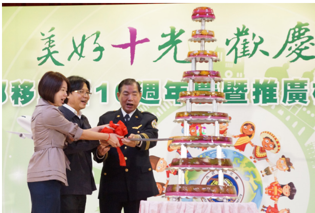
內政部長葉俊榮（左 2）與立法委員林麗蟬（左 1）及移民署長何榮村（左 3）一起開心切蛋糕。

葉俊榮部長在頒發模範移民官致詞表示, 十年前, 他還是政務委員的時候, 曾經與當時陸委會主委蔡英文,