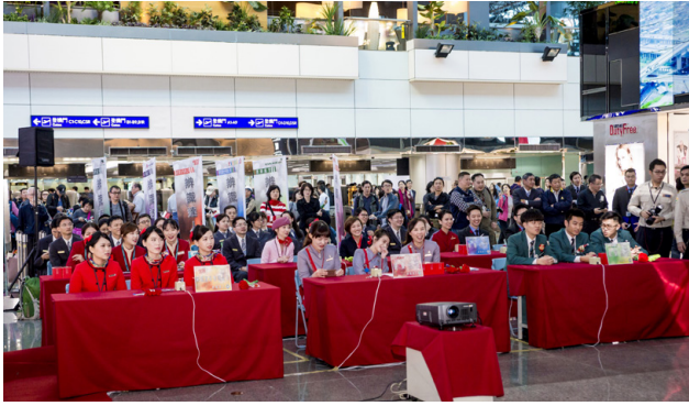
由航空公司組成的「業餘組」進行趣味搶答比賽。