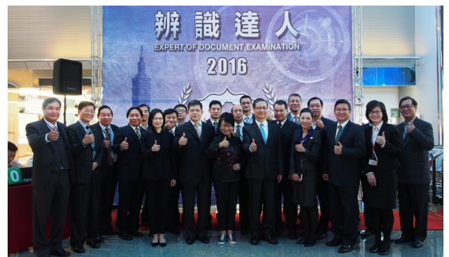
移民署鐘景琨副署長與機場各單位單位合影。

陳大隊長並表示，為使自動查驗通關系統自助、快速與便捷的優點，廣為民眾周知，本次活動地點特別選在在桃園國際機場第二航廈管制區出境查驗大廳後方廣場（出境自動查驗通關系統正後方）辦理，以推廣讓更多國人使用，且活動中有多家媒體採訪，更增添宣導能量，另統計 105 年全年查獲假護照相關績效已計 107 件，本次活動已經對意圖偷渡闖關的不法人士產生嚇阻作用，國境事務大隊以國境安全管理為首要，兼顧優質服務理念，朝著「保障合法，打擊非法」之國境人流管理目標邁進。因此，當出入國的旅客拿著護照在機場準備通關時，移民官在短短幾秒鐘就必須檢查出護照的真偽，以防止不法人士蒙混闖關，需要具備專業知識及精準的眼光才能落實工作。本比賽最大目的在於透過實用證照辨識教學與趣味性競賽，為機場相關單位訓練櫃檯人員專業知識並促進相互合作關係，創造更安全的機場環境並延伸國境線查緝防禦能力！ ■