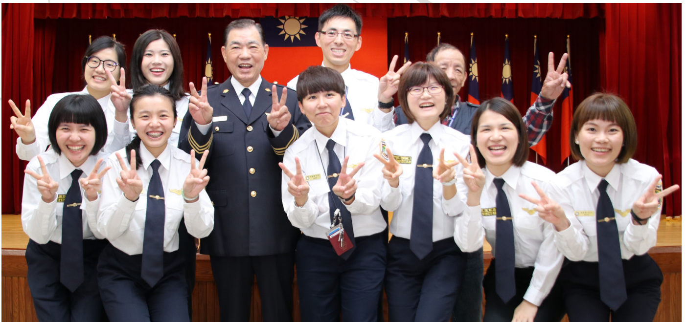
移民署何榮村署長與移民班第四期結業學員合影。

最後，副總統勉勵移民官要一起努力，使國家好的形象讓全世界都看到，讓全世界來到臺灣的人能經由移民官了解臺灣的美麗，而且了解臺灣對於法治、人權的尊重。政府也會支持移民署，持續招募具備語言專長、擁有文化敏感度的優秀人才，來充實我們國家移民官的團隊。