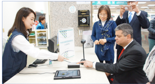
卡里略局長（右 1）及其他貴賓實地體驗自動查驗通關系統註冊。

會議結束後，卡里略局長前往移民署臺北市服務站參訪自動查驗通關申請註冊櫃檯，透過專人解說申辦流程，並親身體驗註冊，讚嘆臺灣自動查驗通關系統之便捷性，由於正逢農曆新年期間，卡里略局長及其他貴賓入境隨俗跟站內同仁及臺灣民眾拜年。巴拿馬位於中美洲重要關鍵之地理位置，連接大西洋與太平洋之巴拿馬運河位於巴拿馬中央，對世界航運、物流的影響力與貢獻，舉世皆知。巴拿