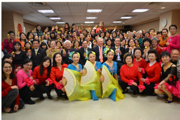
106年2月16日移民署鐘景琨副署長(第2排右3)參加中華救助總會「金雞報喜迎新春 大陸配偶春節團拜」活動。