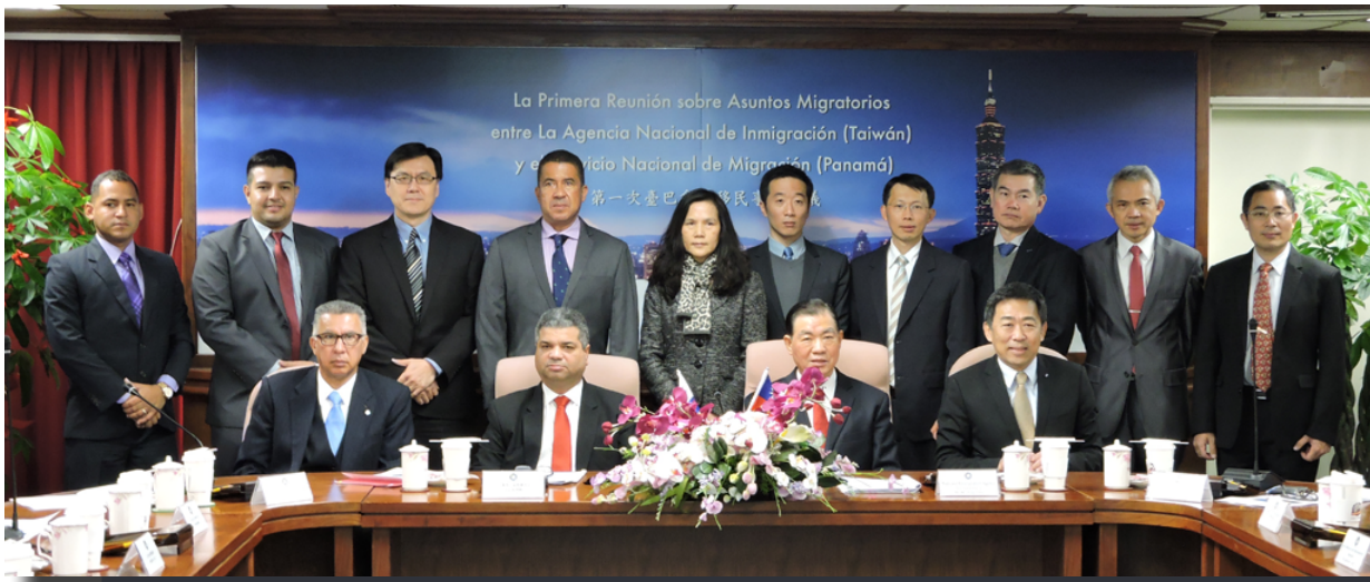
巴拿馬海維爾·卡里略局長（前排左2）參加首次由內政部移民署舉辦之兩國移民事務首長會議，何榮村署長（前排右2）率領移民署同仁熱情與會。

為落實中華民國與巴拿馬兩國於105年6月27日在雙方總統見證下完成簽署「中華民國政府與巴拿馬共和國政府間有關移民事務與防制人口販運合作協定」，巴拿馬公共安全部移民局海維爾·卡里略局長（Javier Leonelli Carrillo Silvestri）於106年1月22日至26日率代表團一行3人來訪臺灣，參加首次在臺灣舉辦「中華民國與巴拿馬移民事務首長會議」，並於會後進行各項參訪活動。