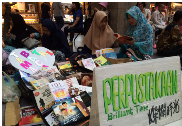
燦爛時光書店於臺北車站大廳編號24號柱子舉辦的地板圖書館活動，移工朋友非常踴躍借閱書籍。

105年初開始，每週日下午2點於臺北車站大廳編號24號柱子旁設立書攤，以提供假日在此聚會的移工朋友借閱，一開始是延續書店的模式，但常有民眾誤以為他們在推銷賣書而去檢舉，引來警察關切，所以最後決定憑藉著對顧客的一份信任，不收取任何押金。