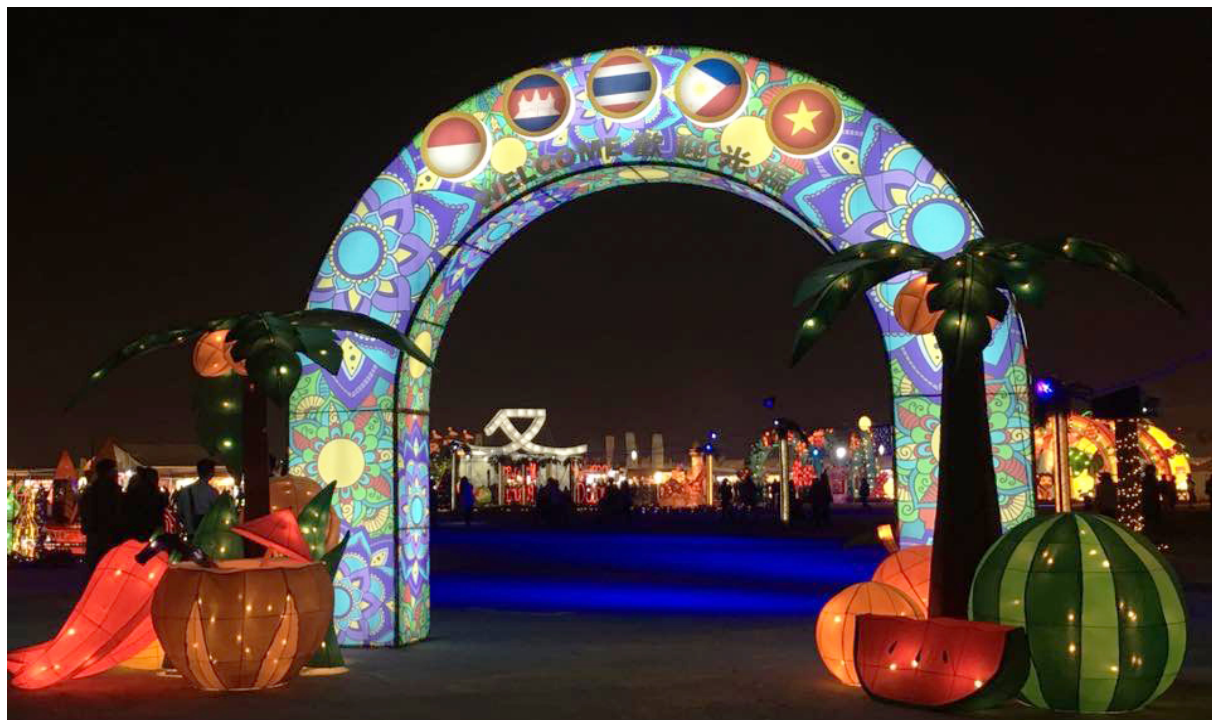
2017 臺灣燈會新住民專區入口處拱門，拱門上方為東南亞 5 國國旗圖像。

2017 臺灣燈會從 2 月 11 日至 2 月 19 日在雲林縣舉辦，為展現對於新住民的尊重及對其母國文化的重視，燈會 28 年來首創新住民主題燈區，由新住民發展基金補助經費新臺幣 738 萬 4,000 元，展現越南、泰國、柬埔寨、菲律賓及印尼等 5 國的主題花燈。透過雲林縣內新住民姐妹們踴躍參與每一場說明會並提供寶貴的意見，讓燈區的呈現更趨近於東南亞母國的原汁原味，同時招募新住民擔任導覽志工及提供翻譯服務，促進多元文化交流。希望可以藉此讓新住民母國特色燈飾在臺灣發光，讓新住民們也可以成為臺灣燈會的要角，並且在臺灣的年節時刻感受到新住民母國過年團圓的氣氛。