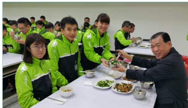
移民署何榮村署長（右1）與學員零距離共進午餐。

「紀律、專業、團隊、創新」不僅是訓練中心精神指標，更是對移民班學員深切的期許。隨著時代變遷，在現今多元化的社會中，人民對移民官的期待不再僅限於做好執法的工作，更是關懷及服務態度的提升。還記得全體學員第一次練唱署歌時，學員們深深感受到移民官對國家安全工作的不可取代性，以及長官對未來新血的高度期望，「竭誠達成使命，綻放榮譽的光芒」，經過專業訓練，移民班第5期學員們將散播到全國各地，以身為移民署一份子感到驕傲，成為守護安全、傳遞希望的種子。■