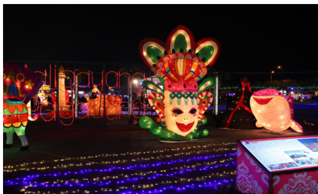
2017 臺灣燈會菲律賓燈區有「巴科羅的微笑」、「彩牛祈福」、「鯨遊山間」。

菲律賓燈區有「巴科羅的微笑」、「彩牛祈福」、「鯨遊山間」，其中「巴科羅的微笑」代表菲律賓巴科羅面具嘉年華 (Bacolod Masskara Festival)，是菲律賓著名節慶，於每年 10 月舉辦，在活動的面具上都可以看到大大的微笑，也因此讓巴科羅有了微笑之都的美稱；「彩牛祈福」慶典的主角是農神：聖依斯朵拉 (San Isidro)，慶典的第一天下午，教堂前廣場聚集許多裝扮得五顏六色的水牛，為豐收祈福。未來這座「彩牛祈福」燈組將在燈會結束後放置於移民署雲林縣服務站民眾大廳典藏，讓來洽辦案件的民眾均可欣賞到這座美麗水牛的風采；「鯨遊山間」代表常被人拿來和日本的富士山相比美而近乎完美的圓錐形山體，號稱「最完美的圓錐體」，搭配菲律賓宿霧歐斯陸著名保育動物鯨鯊，也是菲律賓 100 元披索背面設計圖。