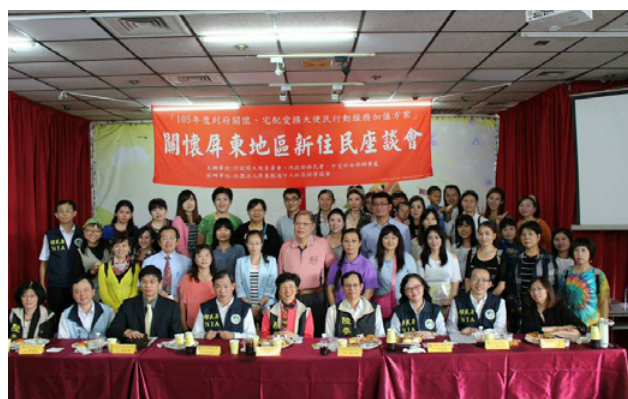
陸委會張小月主任委員(第1排左5)、移民署何榮村署長(第1排左4)、海基會黃國瑞處長(第1排左2)關懷屏東地區新住民座談會合影。

何榮村署長表示，因應多元社會結構及國家長遠發展，移民署移民輔導的面向擴及新住民及其子女，從落實多元文化向下扎根，透過築夢計畫、培力獎助學金、海外生活體驗、二代青年人才研習等活動，強化新住民及二代增能、展能，鼓勵發揮文化及語言優勢，以厚植國家競爭力，期能成為「新南向政策」與國際接軌的重要關鍵力量。■