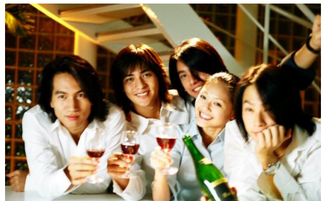
麥大傑所執導風靡一時的「流星花園2」偶像劇劇照。