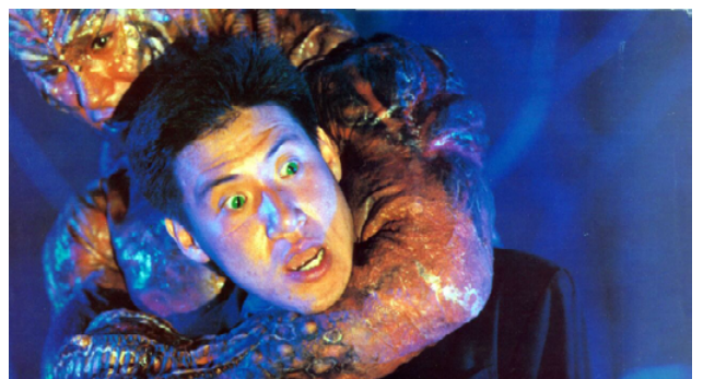
麥大傑於 81 年拍攝的《妖獸都市》，當中嘗試翻轉鏡頭、濾鏡與色彩的大膽使用手法到目前為止都還很少見。

也間接影響他日後電影風格，如 81 年拍攝的《妖獸都市》，就是以動畫改編翻拍而成的怪獸動作片，他在這部電影導入卡通元素，嘗試翻轉鏡頭，濾鏡與色彩的大膽使用手法到目前為止都很少見。