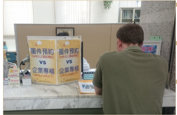
106年2月15日臺北市服務站在1樓4號櫃檯設置企業申辦專櫃並受理團體預約案件，俾方便移民公司、旅行社或企業專人申辦業務。