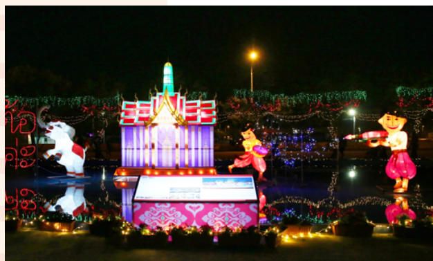
2017 臺灣燈會泰國燈區有「泰麗皇宮」、「潑水納福」、「泰象萬千」。

泰國燈區有「泰麗皇宮」、「潑水納福」、「泰象萬千」，其中「泰麗皇宮」以曼谷大皇宮為主題，在18到20世紀，曾是暹羅王國的皇宮，也是泰國王室公定的居住地點，在所有泰國王宮中有著重要的地位；「潑水納福」意指泰國的潑水節，人們互相潑水慶祝，象徵著把過去一年不好的運氣、事件等通通洗去，也祈求來年能煥然一新，順順利利，是全球知名歡樂慶典；「泰象萬千」代表泰國人民的生活中具有舉足輕重的地位的大象，牠是泰國的象徵，更是泰國人民的驕傲，大象與泰國的歷史、文化、宗教、經濟的關係極為密切，幾乎人人都喜愛大象，大象造型的製品更是隨處可見。