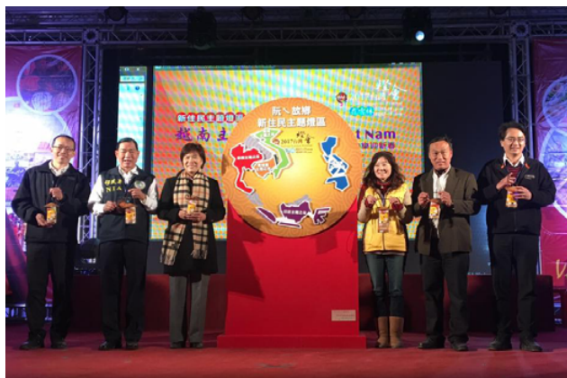
越南之夜——在越南、泰國、柬埔寨、菲律賓及印尼拼圖完成後，林慈玲次長（左3）、何榮村署長（左2）與其他長官貴賓與背板一同合影。

林慈玲次長及何榮村署長於主燈開燈儀式過後，立即回到新住民燈區參加越南之夜啟動儀式，除觀賞越南傳統斗笠舞表演及服裝走秀之外，也一同與來自越南、泰國、柬埔寨、菲律賓及印尼等5個國家的新住民姐妹將不同國家形狀的拼圖黏至圓型背板，拼出故鄉地圖。