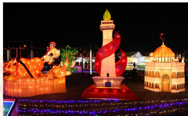
2017 臺灣燈會印尼燈區有「馨香立國」、「奔牛歡騰」、「信仰清真」。

起來的，是雅加達市的象徵，位於市中心的獨立廣場公園中央；「奔牛歡騰」是印尼蘇門答臘的巴東每年在稻米收割季節結束後都有賽牛的傳統活動，來自各方約有幾百頭以上的牛隻參賽，盛況非凡，場面十分壯觀；「信仰清真」以印尼的清真寺為設計主題，清真寺為印尼大宗教信仰之地，也象徵大多數印尼新住民之歸屬。