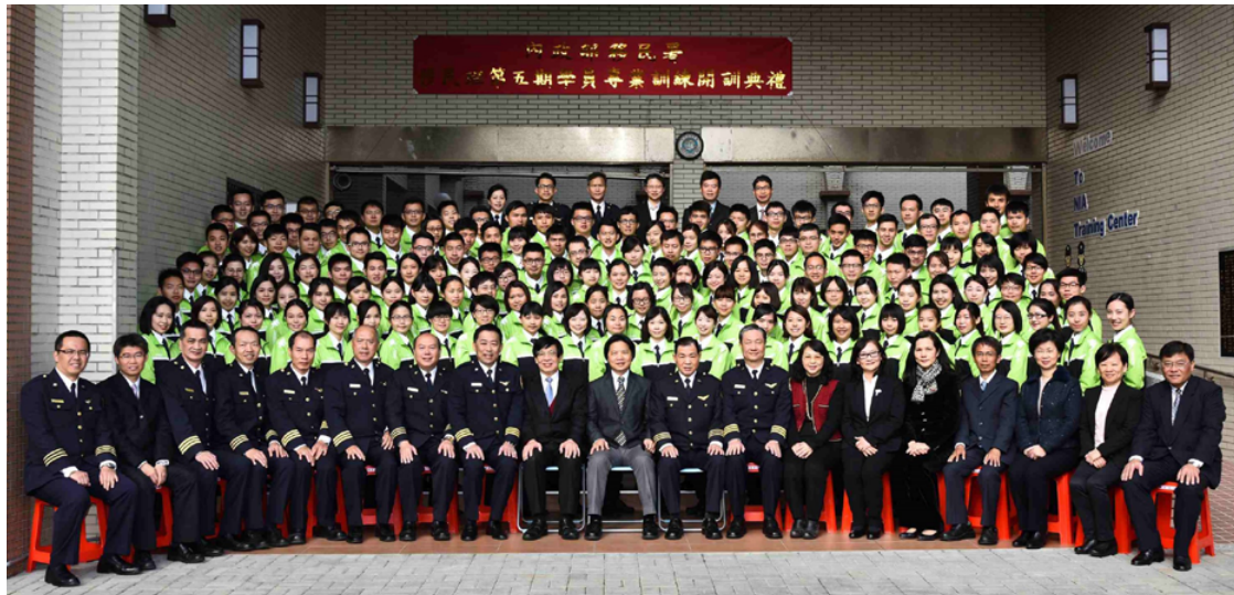
內政部葉俊榮部長（第 1 排中間）與移民班第 5 期開訓典禮學員合影留念。

內政部葉俊榮部長於 106 年 2 月 13 日蒞臨訓練中心，參加移民班第 5 期學員開訓典禮。葉俊榮部長表示我國百分之百擁抱多元文化，並勉勵初著制服的學員們在專業訓練的期間，都能相互學習、共同成長，成為兼具熱情與專業的移民官。