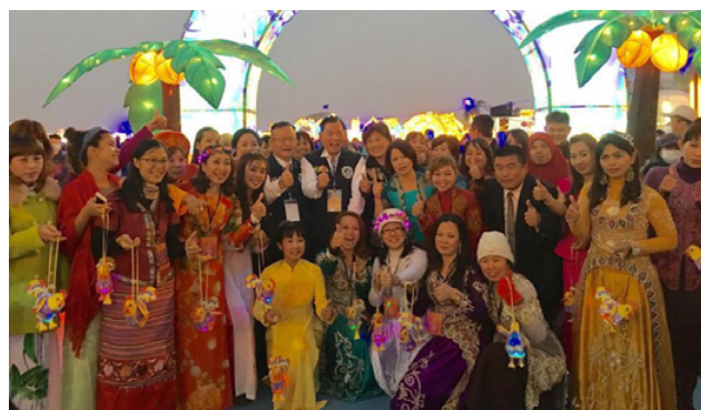
新住民穿著各國國服手持小提燈「幸福奇雞」於燈區迎賓拱門前與林慈玲次長（第 2 排右 5）及何榮村署長（第 2 排右 6）一同合影。

式，特地在開燈儀式前到新住民主題燈區探望，現場新住民姊妹們及其二代子女於寒冷的夜晚穿著國服於燈區迎賓拱門前熱烈迎接林慈玲次長及何榮村署長的到來，大家手持今年燈會發放之雞年小提燈「幸福奇雞」一同合影，同時何榮村署長特地帶來近百個小紅包發放給新住民姊妹及其二代子女，讓大家一同感受臺灣的年節氣氛。