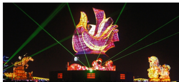
2017 臺灣燈會主燈「鳳凰來儀」，造型設計為鳳凰昂首飛揚降臨於山之巔，振翅翱翔天際象徵帶領臺灣飛向新紀元。

2017 雲林燈會總計超過 1,300 萬人次參觀，各燈區皆盡情展現其最富特色的一面，新住民主題燈區除了代表各國傳統特色的大型花燈，還有融合東南亞各國的地面彩繪母親河及雞年蛋型投影，「母親河」總長度超過 100 公尺，一脈相承著越南的湄公河、印尼的卡普阿斯河、泰國的湄南河、菲律賓的卡加延河、柬埔寨的湄公河，象徵著 5 國多元文化緊緊相依、互相扶持，河內有大大小小的魚隻，代表著新住民與台灣的民族血脈融合，川流不息；雞年蛋型投影將 5 國文化縮影輪播，呈現出多元文化及民族融合之美，引領民眾進入熱情的東南亞文化藝世界。■