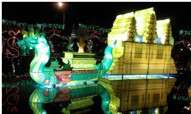
2017 臺灣燈會柬埔寨燈區有「凜凜吳哥」、「迎水送福」、「舞出靈性」。