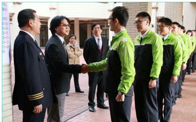
學員以專長外語問候內政部葉俊榮部長（左2）。