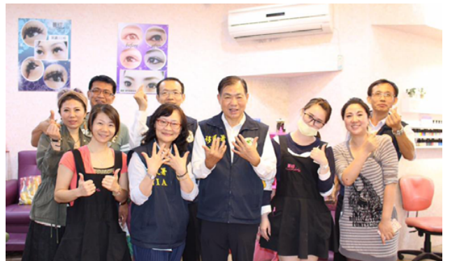
移民署何榮村署長(前排右3)與李臨鳳組長(前排左2)開心展示美甲彩繪之成果。

另一位來自內蒙古的漂木雕刻藝術家林峰，他在自宅經營「林峰藝術工作室」，其作品以自然環保為題，擅長將漂流木或廢材，經其獨到的慧眼及