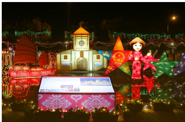
2017 臺灣燈會越南燈區有「濱城夢想」、「星亮前程」、「勢如龍灣」。

新住民主題燈區現場都有標示說明，共有5個主要燈區，越南燈區有「濱城夢想」、「星亮前程」、「勢如龍灣」，其中「濱城夢想」代表越南胡志明市大型室內濱城市場，位於胡志明市重要的交通樞紐，是西貢時期少數保留至今的建築之一，因此成為越南最具代表性的地標，這裡是許多越南人維持生計的地方，不僅僅是代表著越南，也承載著許多人的夢想；「星亮前程」象徵越南國旗星星國徽，更有「照亮前途」的意涵；「勢如龍灣」代表聯合國教科文組織認定的世界遺產下龍灣，海灣中