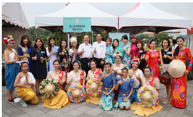
本署楊家駿署長（後排左 8）、行政院新住民事務協調會報羅美玲委員（後排左 3）、新住民發展基金馮燕妮委員、陳琳鳳委員（後排右 2、右 4）、林興春主任秘書（後排左 7）與新住民及其子女們合影。

為了擴大推廣效應，使各界瞭解新住民培力發展資訊網站主題資訊及網站 Line 官方帳號，邀請政府機關與民間團體現場進行宣導推廣活動，將本網站之新住民生活輔導、法令宣導、教育與學習、培力