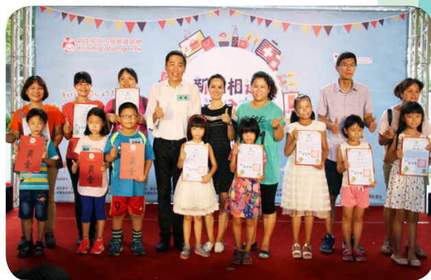
本署楊家駿署長(後排左 4)與低年級組得獎者代表及家屬合影。

楊家駿署長表示，目前超過 52 萬新住民及家庭與我們生活在臺灣寶島，為使新住民儘速適應在臺生活，展現其多元文化及語言優勢，移民署會將持續在法律、制度及執行面上落實各項新住民照顧服務，並與各部會、地方政府及民間團體密切合作與相互學習，成為新住民守護者，提升新住民及其子女的競爭力，讓更多新住民能更安心、放心、寬心的在臺灣，成就更和諧幸福的社會。■