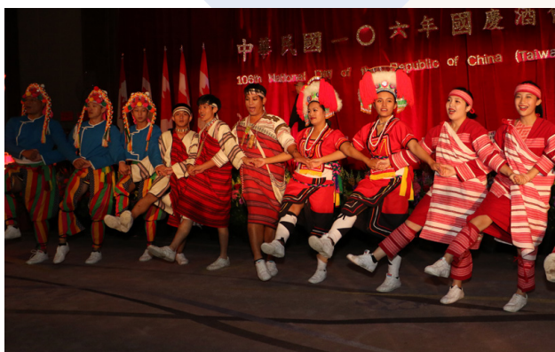
泰雅原舞工坊國慶表演。

10 月 6 日在 Ritz Carlton 五星級飯店舉辦的國慶酒會，來自加拿大聯邦、省、市府三級政要、警政、移民、學界、商界、僑界等賓客高達 500 人，進場時與徐詠梅公使一一握手道賀，眾議員 Hon Jamie Schmale 上台致詞，用中文高喊「中華民國萬歲」，更讓現場愛國僑胞及賓客 High 到最高點。今年國慶酒會設計以陳列原住民傳統服飾為主，泰雅原舞工坊舞蹈團，在會場熱情穿梭演出；享譽國際樂壇並擁有「當代第一魔笛」美譽的演奏家及作曲家——身為臺灣女婿的龍笛先生 (Ron Korb)，現場以竹笛、長笛、哨笛接續演奏；壓軸則由多倫多臺灣室內樂團，以弦樂四重奏型式演奏多首臺灣民謠後，圓滿落幕。