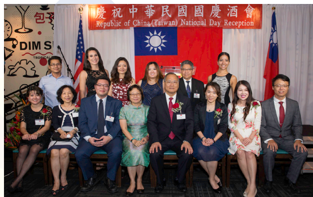
國慶酒會工作同仁大合照。

我國駐邁阿密臺北經濟文化辦事處於 10 月 3 日晚間，在大利飯店 (Tropical Chinese Restaurant) 舉辦 106 年國慶酒會，出席貴賓來自州郡市政府官員暨來自奧蘭多市、天柏市、墨爾本市及邁阿密地區之僑領等約 350 人。