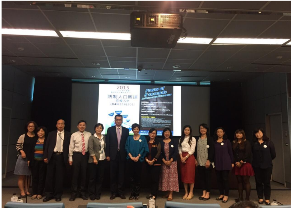
與港商美格豐遠東分公司於桃園機場共同舉辦宣導活動