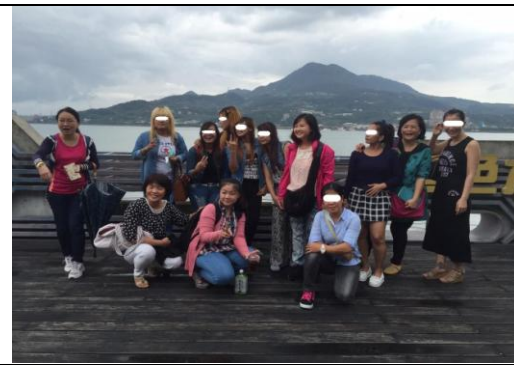
大型出遊活動：經票選後依多數被害人期待，規劃至臺北 101 大樓及周邊的一日遊活動，讓被害人留下在臺灣的美麗印象，也藉此增進團體間的契合度。