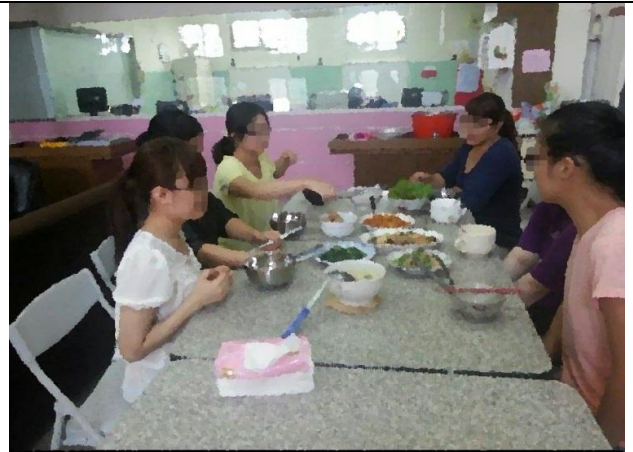
家庭日餐敘~異國料理製作分享，從飲食文化間增進多元文化了解。