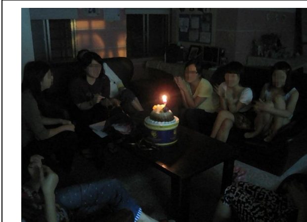
慶生會~為生日個案辦理慶生派對，許願與祝福。