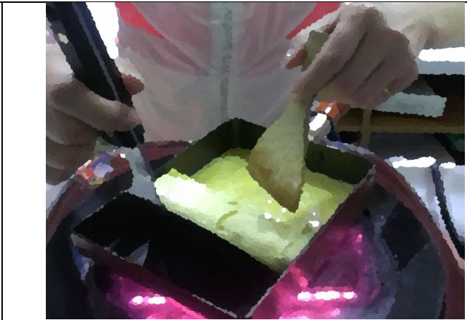
技能學習課程「玉子燒」~依據個案需求，結合志工資源教導，供案主返鄉後創業。