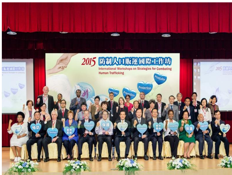
馬英九總統與國外學者專家合照