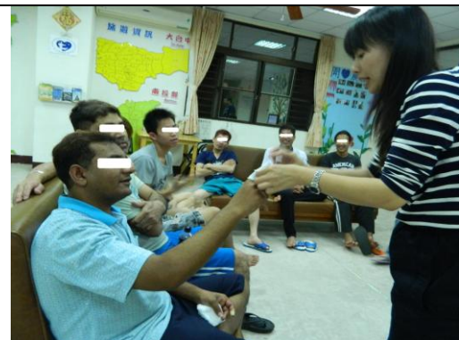
專家講座：依被害人所需，研擬專家講座主題，例如：法律諮詢、職災預防等，期以藉此提昇被害人之相關知識及預防能力。