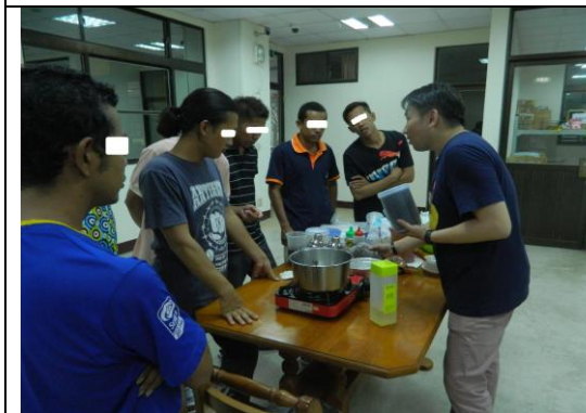
技能課程：規劃被害人期待之相關課程供被害人參與，使被害人有更多機會接觸不同技能課程主題，並藉由各課程的探索，找尋合適自己發展之技能。