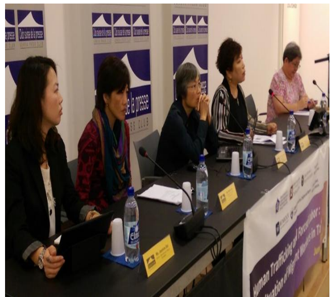
2015 年 6 月於日內瓦參與第 104 屆國際勞工大會