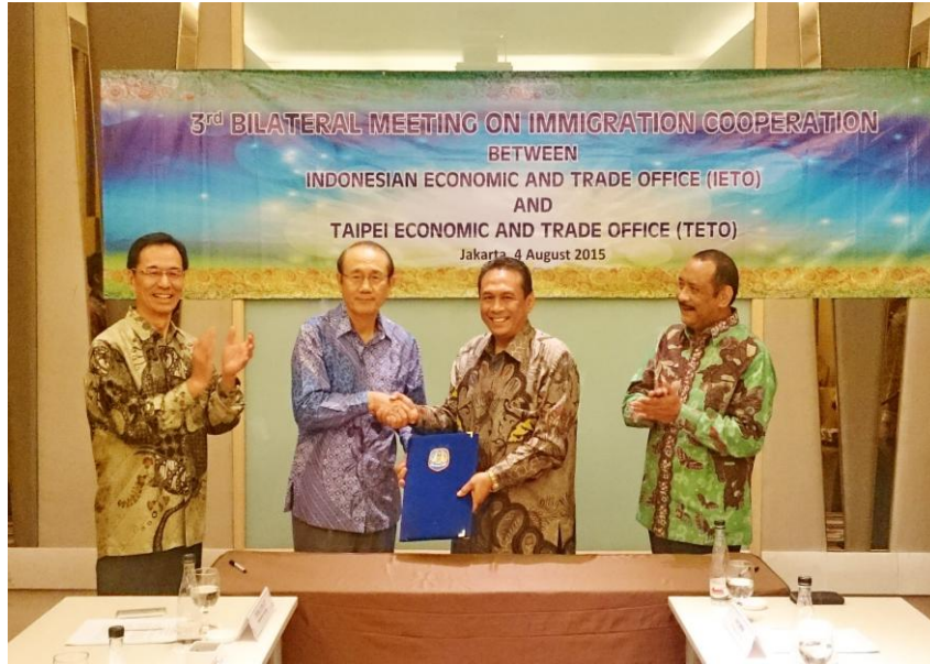
莫署長見證我國駐印尼代表處大使及印尼駐臺代表處代表簽署「第3次臺、印尼移民事務會議」議事錄