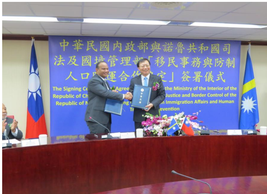
我國內政部長與諾魯共和國司法及國境管理部長簽署防制人口販運合作協定