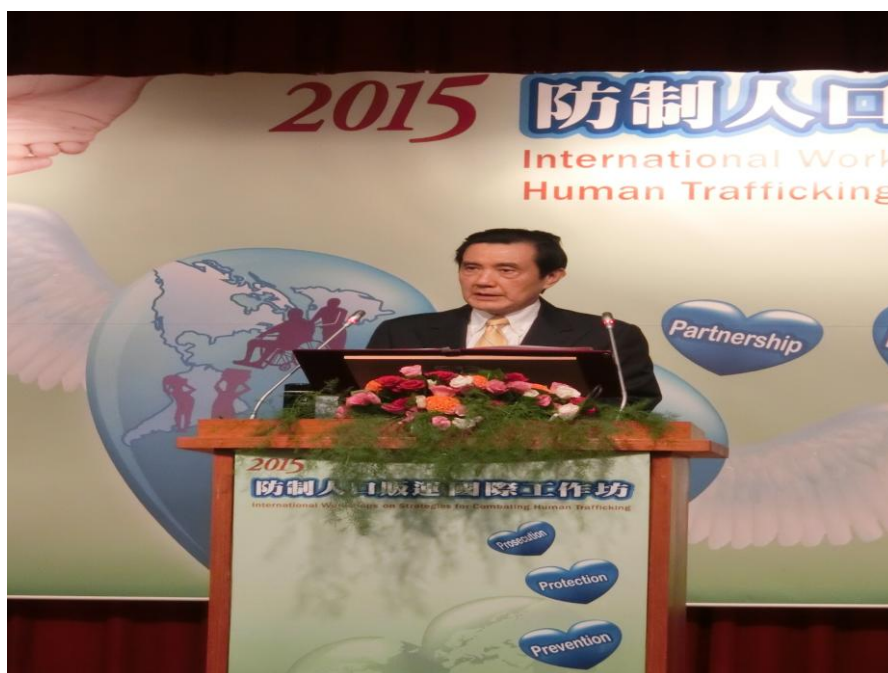
馬英九總統於開幕典禮上致詞