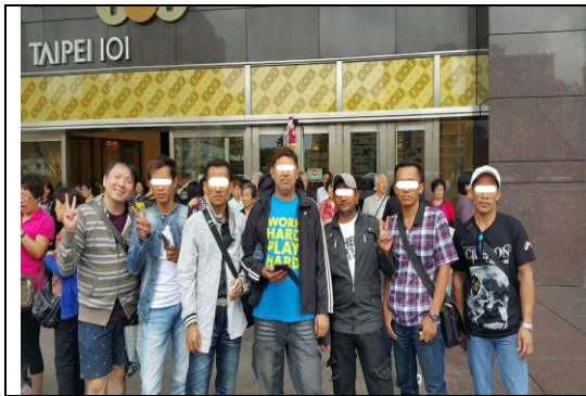
大型出遊活動：經票選後依多數被害人期待，規劃至臺北 101 大樓及周邊的一日遊活動，讓被害人留下在臺灣的美麗印象，也藉此增進團體間的契合度。