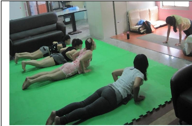
Sovananda Yoga 瑜珈~身心靈放鬆與平衡、釋放身心壓力情緒。