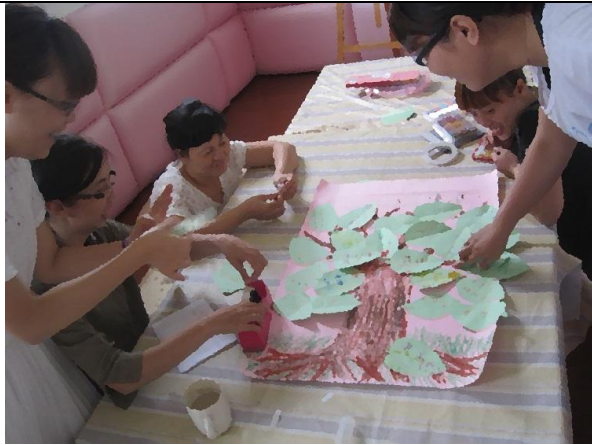
成長團體「我的優點樹」~人際溝通與自我成長。