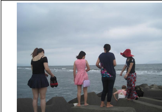
戶外休閒活動~想像大海的另一端是家鄉，站在沙灘上踏著浪，離家鄉的距離更近一些。