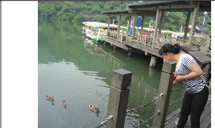
散步與環境認識~交通資訊與外出路線熟識，散心與壓力紓解。