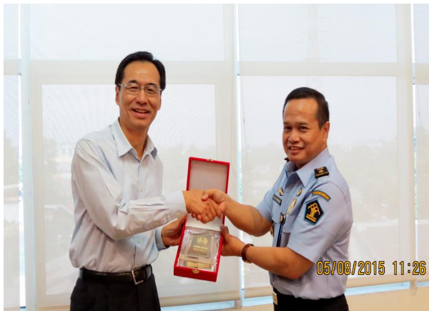
莫署長與印尼雅加達南區移民局局長討論雙方於移民事務合作及人流管理經驗，並交換紀念品