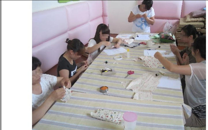
多元文化課程「端午香包縫製」~因應節慶與習俗文化，慶祝端午節。