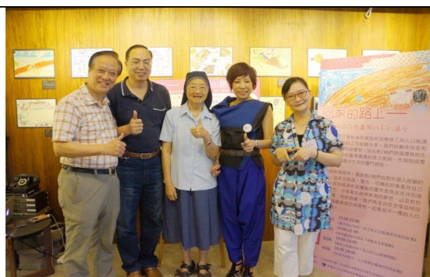
2016年「回家的路上」—移工與人口販運倖存者畫展暨系列講座：政府與民間團體的合作，共同響應730國際反人口販運日，為守護人權而努力。