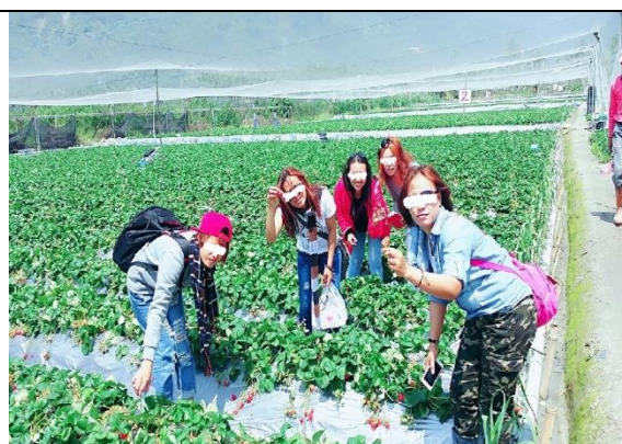
戶外活動：透過體驗親自採摘草莓之趣，欣賞、體驗臺灣文化之美。