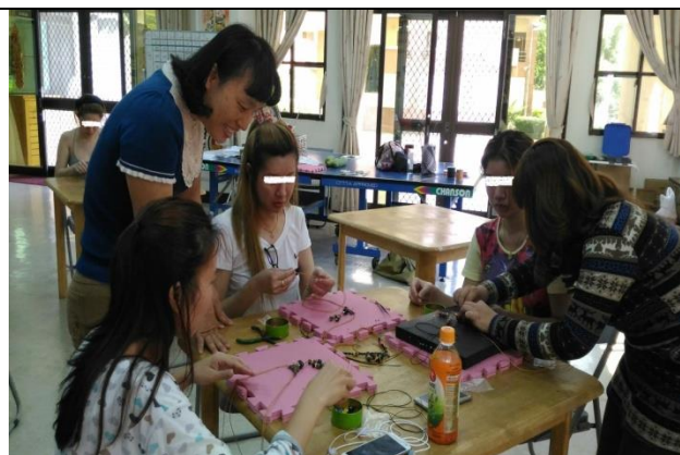
技能課程：所內工作人員規劃被害人期待之相關課程供被害人參與，使被害人有更多機會接觸不同技能課程主題，並藉由各課程的探索，找尋合適自己發展之技能。