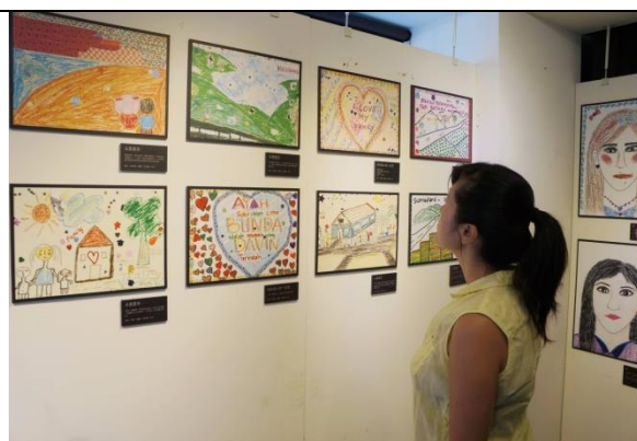
2016年「回家的路上」—移工與人口販運倖存者畫展暨系列講座：畫展同步透過文字敘述，呈現創作者的心路歷程，提供觀覽者深入了解畫作背後的故事。