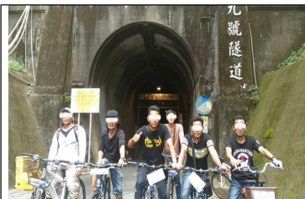
戶外活動：「后豐鐵馬道之旅」藉著騎自行車，漫遊在沒有汽、機車干擾的自行車道上，放鬆身心之旅。