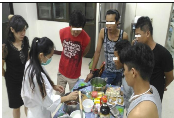
技能課程：所內工作人員規劃被害人期待之相關課程供被害人參與，使被害人有更多機會接觸不同技能課程主題，並藉由各課程的探索，找尋合適自己發展之技能。