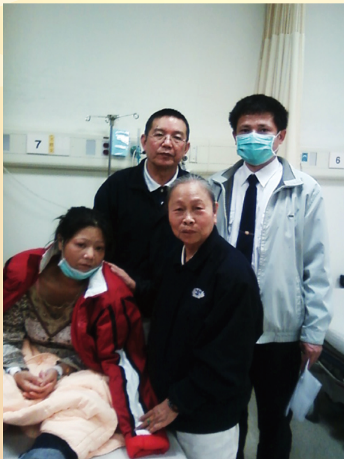
慈濟志工玉秀師姑（右二）至慈濟醫院探視洗腎外勞