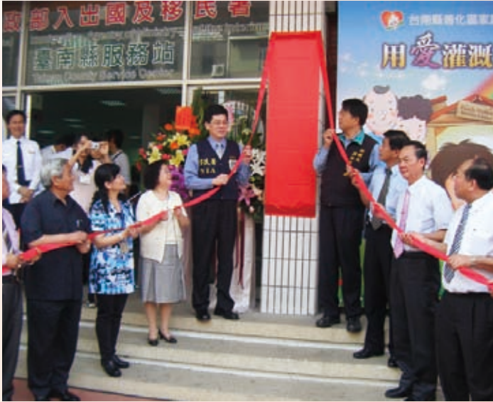
謝署長與臺南縣顏純左副縣長等貴賓共同參加「臺南縣善化區家庭福利服務中心」揭幕儀式

臺南縣的新移民朋友們有福了！移民署臺南縣服務站為提升外籍與大陸配偶照顧輔導服務，自從98年5月開辦「新移民家庭服務窗口」後，本（99）年2月持續邀請「社團法人臺南縣基督教疼厝邊全人發展關顧協會」提供駐點服務。另外，配合「臺南縣善化區家庭福利服務中心」於3月3日在服務站1樓揭牌啟用，增加邀請「法律扶助基金會臺南分會」安排律師來服務站駐點免費法律服務，未來將能提供給轄區新移民朋友更完善的服務。