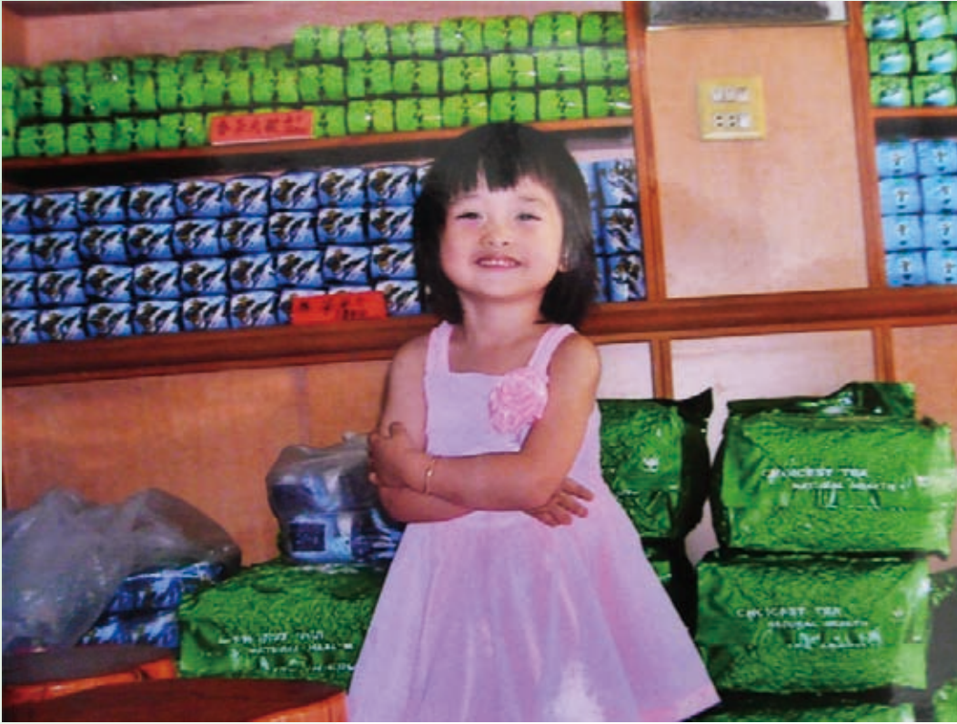
在越南，小朋友的這個動作是有禮貌的

近年來，由於全球化的影響，跨國遷徙現象日漸頻繁，我國新移民人數亦隨之增加。依據內政部統計資料，我國婚姻移民總數已達40餘萬人，若包含在臺居停留的外籍人士，則總數更將逼近百萬人，其中多數均來自東南亞地區。