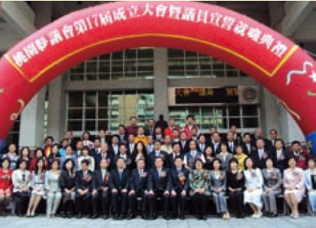
99.03.01 內政部指派謝署長擔任桃園縣新任正副議長就職監交人