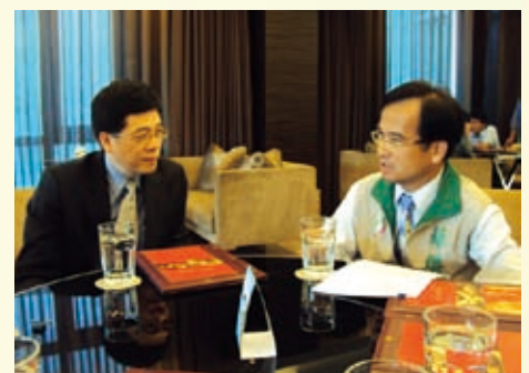
99.03.03 謝署長拜會臺南縣蘇煥智縣長洽談移民輔導等合作事項

發行者：內政部入出國及移民署 發行人：謝立功 編輯委員：何榮村 張琪 胡景富 李臨鳳 張素紅 黃昆明 施明德 黃順超 唐敏耀 鐘景琨 林興春 陳達璋 詹素景 羅仕郎