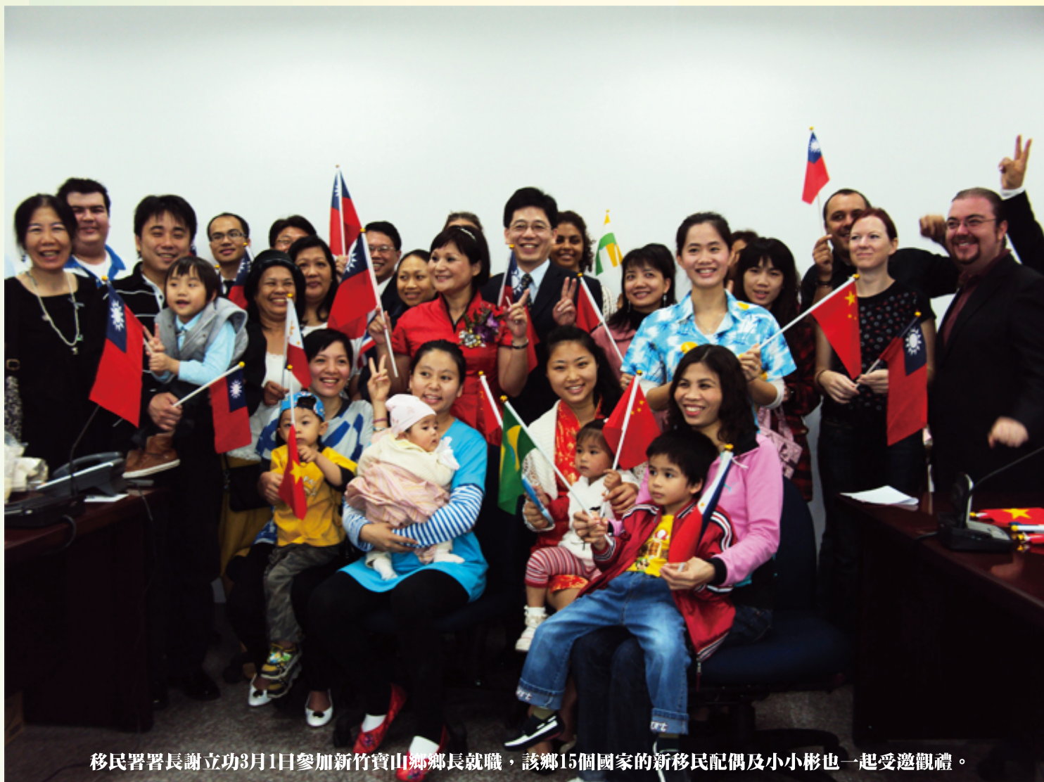
移民署署長謝立功3月1日參加新竹寶山鄉鄉長就職，該鄉15個國家的新移民配偶及小小彬也一起受邀觀禮。