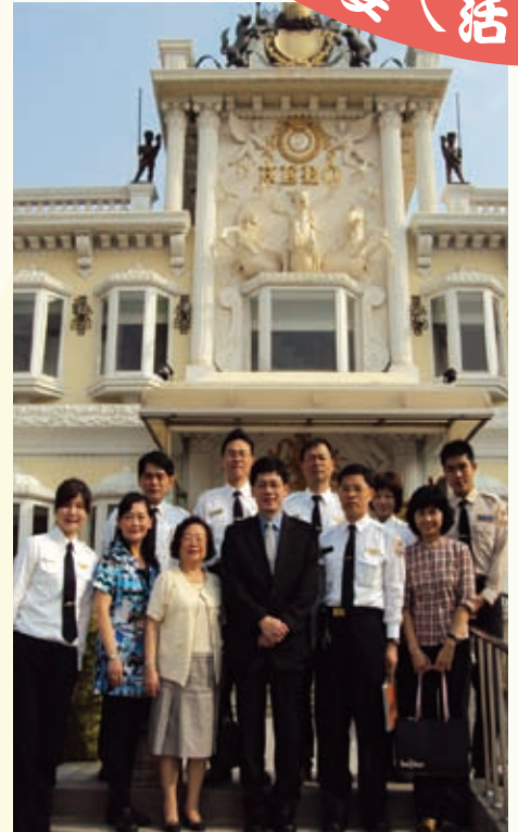
99.03.03 謝署長前往臺南市服務站慰勤