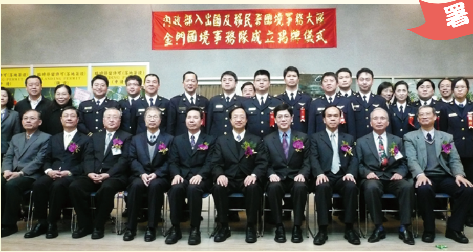
99.03.04 內政部江部長親自主持本署金門國境事務隊成立揭牌儀式