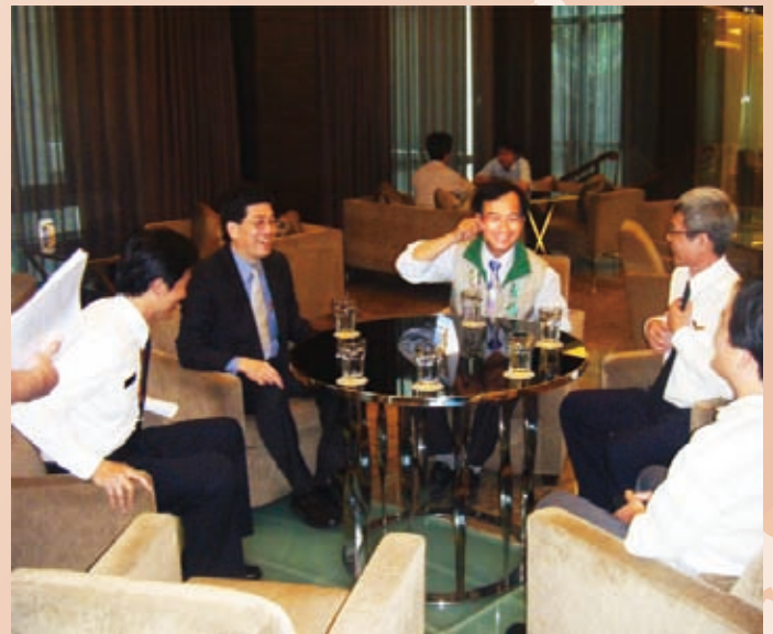
謝署長與臺南縣蘇煥智縣長洽談推動移民照顧輔導與人口販運防制等合作事宜

現在，臺南縣服務站所要努力的是建構「移民」、「社政」、「民間組織」三位一體的合作模式，以發揮更大的效能。對於新移民的資源連結、弱勢外配家庭或遭受家暴姊妹個案輔導及法律諮詢、轉介服務等，提供迅速及完整的服務，要讓每一位來到南瀛落地生根的新移民朋友，都成為幸福快樂的新移民。