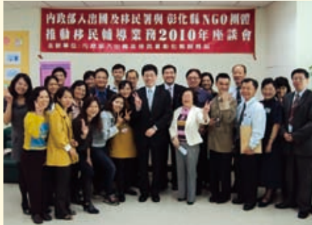
99.03.02 謝署長與彰化縣NGO團體舉辦移民輔導座談會