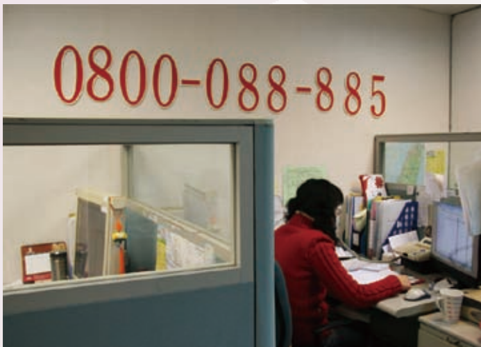
外籍配偶保護諮詢專線接線情形

為暢通外籍與大陸配偶照顧輔導諮詢管道，內政部於92年設置「外籍配偶保護諮詢專線0800-088885」，97年更名為「外籍配偶諮詢專線」，提供外籍配偶全方位資訊及諮詢服務。另於94年設置「外國人在臺生活諮詢服務熱線0800-024-111」，提供外國人在臺生活諮詢服務，移民署於96年成立後，兩專線均接續提供服務，使新移民獲得在臺生活之各項資訊及資源，協助新移民順利融入臺灣社會。