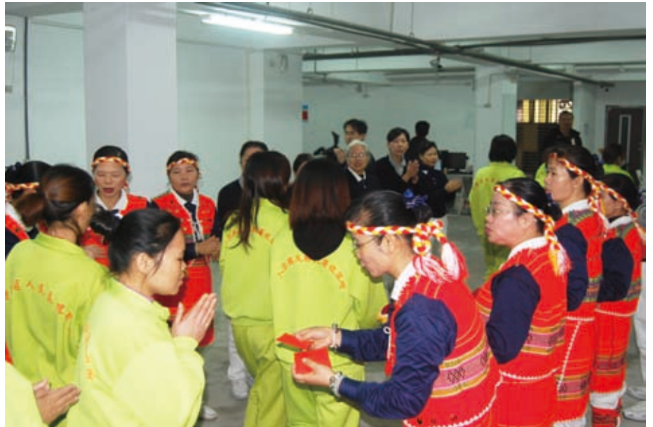
愛灑活動結束後，發送代表「平安吉祥」的紅包給每位受收容人。

「我的快樂，來自你的笑聲，而你如果流淚，我會比你更心疼……，因為我們是一家人，相親相愛，彼此都感恩……」，每個月慈濟義診後的第二天，慈濟的師兄姐，固定至南投收容所舉