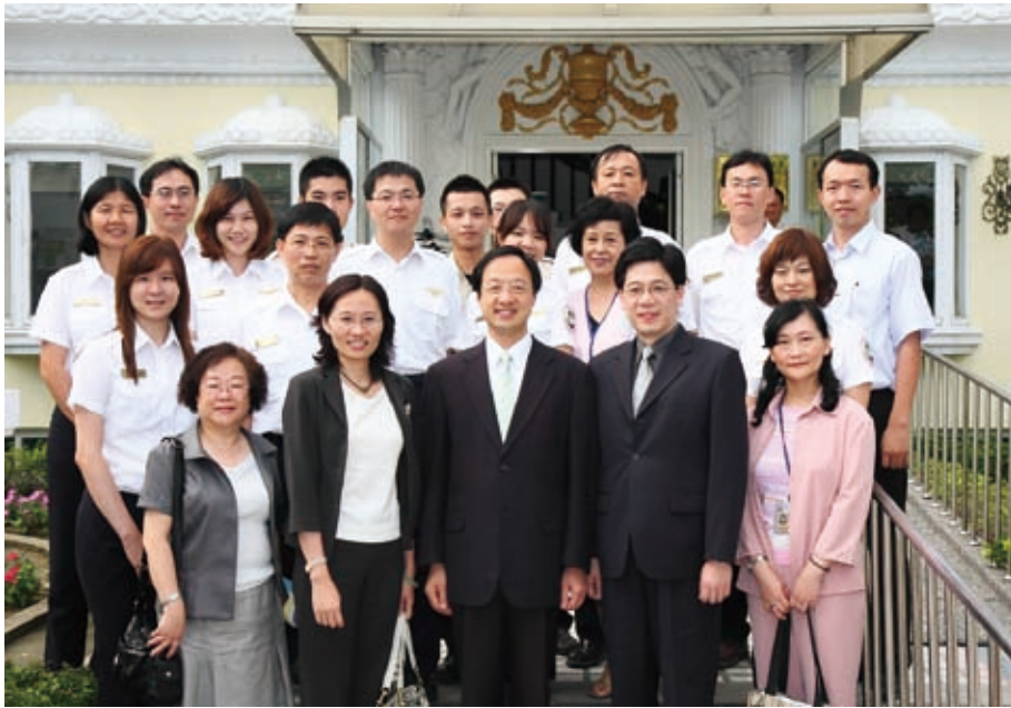
署長陪同部長視察臺南市服務站並與同仁及志工合影

內政部部長江宜樺於99年5月24日下午至國立成功大學參加「民主向前行～從人權角度談新移民適境照護」論壇之後，為貼近新移民，傾聽他們的心聲，並鼓勵新移民對家庭的努力，親臨移民署臺南市服務站視導「溫馨相約鳳凰城」講座，並頒發結訓證書，肯定移民署配合各機關提供新移民在臺所需的最佳照護。參加本次活動的新移民共有越南籍配偶11人，臺灣眷屬6人。江部長於活動中除深切歡迎新移民成為臺灣的一份子外，更關心她們融入臺灣新生活的狀況。