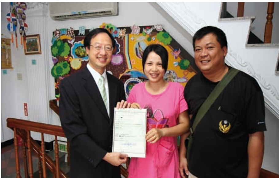
部長親自頒發結業證書給新移民配偶

內政部部長江宜樺於99年5月24日下午至國立成功大學參加「民主向前行～從人權角度談新移民適境照護」論壇之後，為貼近新移民，傾聽他們的心聲，並鼓勵新移民對家庭的努力，親臨移民署臺南市服務站視導「溫馨相約鳳凰城」講座，並頒發結訓證書，肯定移民署配合各機關提供新移民在臺所需的最佳照護。參加本次活動的新移民共有越南籍配偶11人，臺灣眷屬6人。江部長於活動中除深切歡迎新移民成為臺灣的一份子外，更關心她們融入臺灣新生活的狀況。