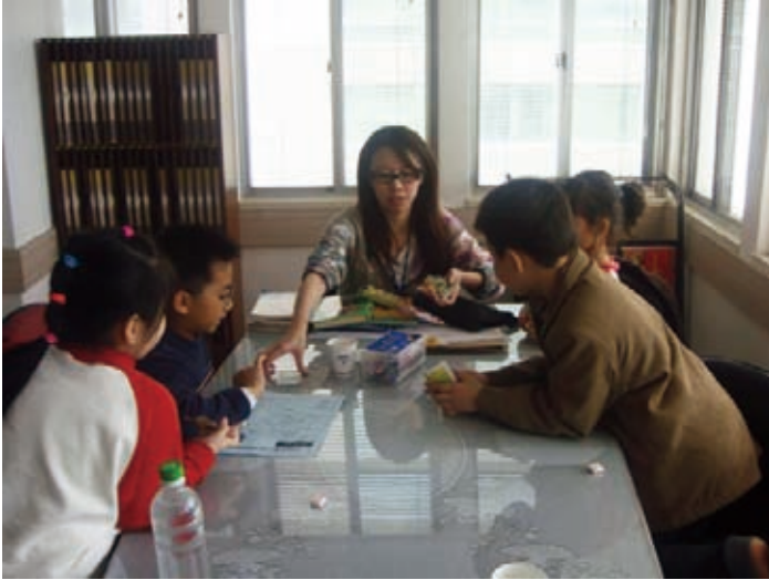
志工帶領新移民子女作活動