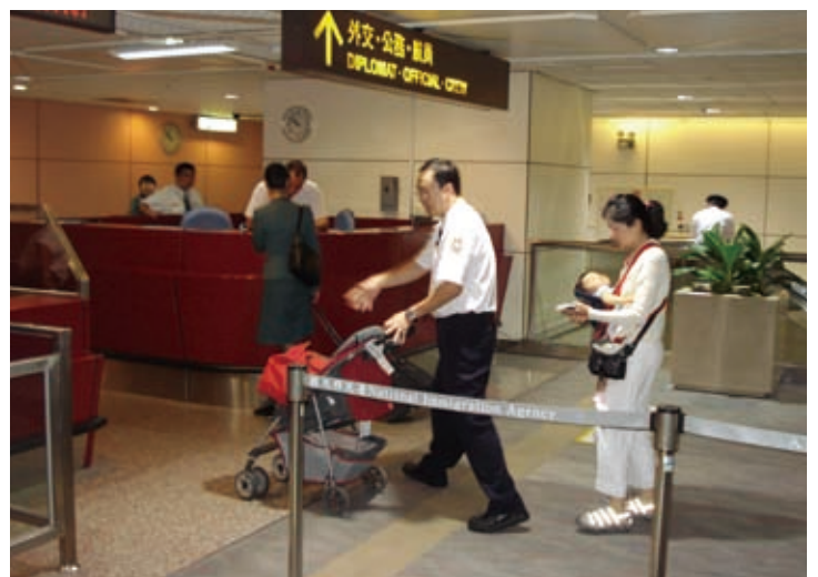
移民署國境事務大隊同仁協助博愛查驗櫃檯旅客通關服務