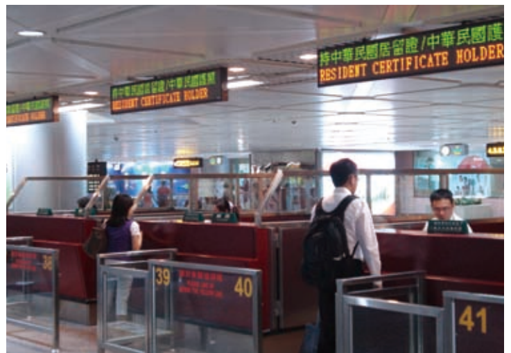
桃園國際機場外僑人士通關專屬櫃檯