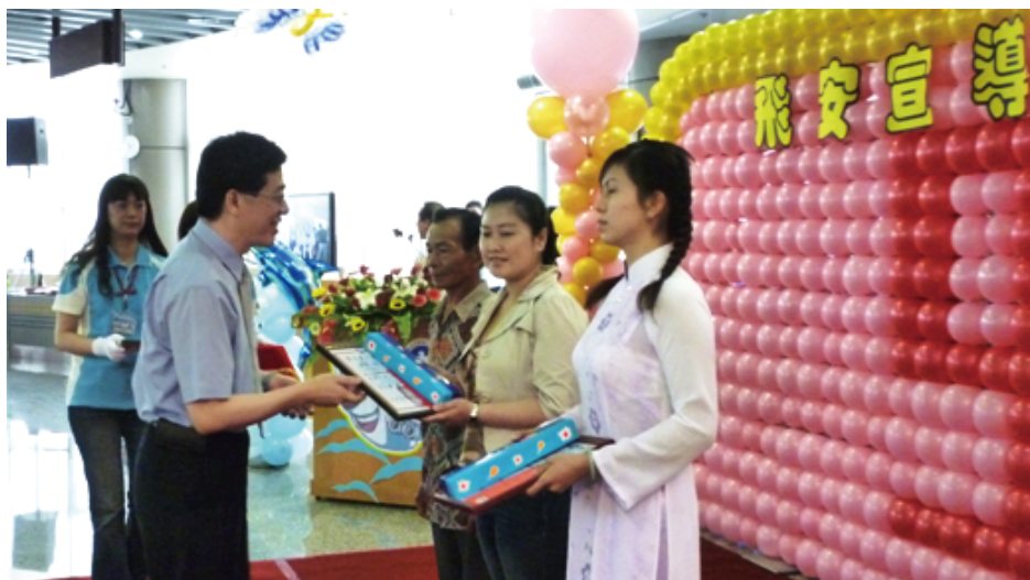
移民署謝立功署長向得獎人道賀並頒發獎金與獎品

新移民輔導及拓展多元文化，向來不遺餘力，延續98年主辦新住民之子「畫我媽咪」繪畫比賽獲得廣大迴響之後，這次再配合公部門及民間團體辦理「新住民朗讀比賽」，99年7月份，將再配合縣政府辦理「新住民嘉年華會」，賡續關懷澎湖縣內的新住民，輔導新住民快速融入臺灣社會，共同建構多元化的生活環境。