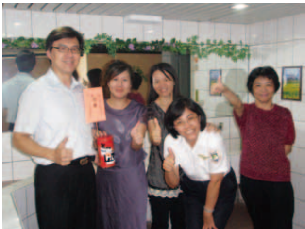
移民署臺中市服務站舉辦「茅廁清潔、創意文化競賽」女公廁冠軍組頒獎情形