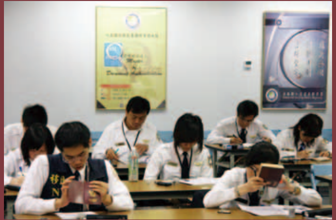
證照辨識達人比賽情景

除了國境管理實務職能競賽，移民署於11月24日在桃園機場諾富特飯店舉行一年一度的國境管理國際研討會，會中各國駐臺官員對移民署在人蛇查緝及防制人口販運方面的成績大表肯定。移民署長謝立功在會中表示，人蛇偷渡是一項全球性的犯罪問題，有賴各國政府通力合作防制。另外，為配合政府向各國爭取我國民眾免簽證待遇，移民署近年來，不斷藉由舉辦國境管理國際研討會、定期派員