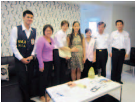
臺南市服務站移輔人員、通譯、社工與專勤隊同仁，在阿緣生產前至家中進行關懷，了解阿緣需求並致贈本署百寶袋