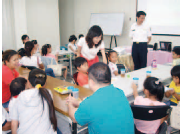
舉辦體驗營讓新移民子女抒發成長歷程留下美好的回憶

移民署臺南縣服務站為讓新移民子女抓住暑假的尾巴，於8月25日邀請新移民子女在服務站內舉辦「多元文化體驗營」，活動透過繪本閱讀、影片欣賞，增進新移民子女了解文化差異與尊重多元文化，活動內容並有別出心裁的「伊是咱的寶貝—新移民子女心聲快遞送」，讓參加的孩子們能將成長歷程與心得抒發出來，為夏天留下美好的回憶。