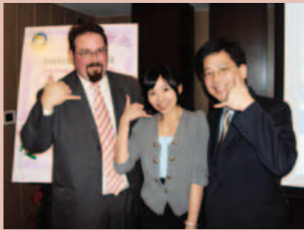
美國國務院監督及打擊人口販運處無任所大使Luis CdeBaca、署長謝立功及同仁合影