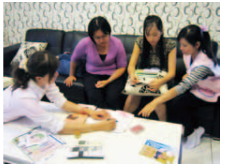
臺南市服務站移輔人員透過通譯為阿緣進行初次入境關懷、解說在臺居留相關法令及社會福利資源

「阿緣」這位剛到臺灣的越南籍婚姻新移民，懷著九個月的身孕，先生在完成停留轉居留手續後，即因事業忙碌而續返越南的工作崗位，公婆已年邁，又居住在鄉下，只得讓她隻身在臺南市待產。臺南市服務站於通知她領取外僑居留證時，獲悉阿緣的情況，隨即協同專勤隊、越語通譯、社工員以及衛生所人員，一起前往她家訪視並送達居留證。