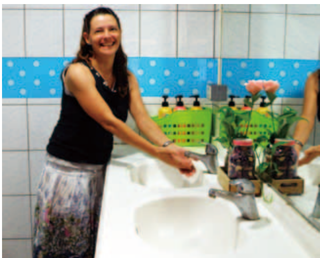
移民署臺中市服務站廁所布置成果連外籍人士都稱讚

移民署臺中市服務站，為了給洽公民眾一個全新的感受，針對服務站內包括公廁及員工專用的5間男女廁所，由員工分組進行「茅房創意競賽」，結果令人驚奇。