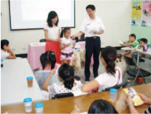
移民署臺南縣服務站舉辦多元文化體驗營讓新移民子女分享心聲