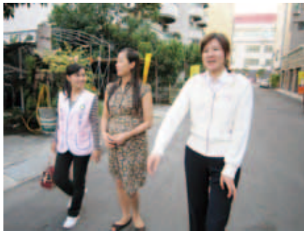
臺南市服務站移輔人員與通譯陪同阿緣外出散步、認識居家附近環境