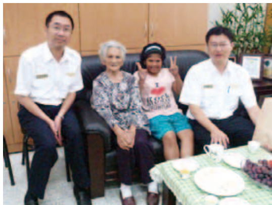
苗栗縣服務站同仁與林小妹妹及奶奶合影