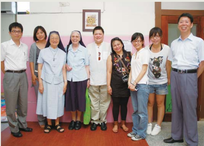
兩岸講師參訪移民署宜蘭庇護所

為強化兩岸四地整體區域性防制人口販運力量，移民署特別邀集大陸、香港、澳門及臺灣等四地專家學者共同與會，為兩岸四地合作機制，再創歷史新契機。移民署長謝立功表示，「人口販運」係跨境且嚴重危害基本人權之犯罪。臺灣被美國國務院選列為全球打擊人口販運3個成效最佳國家之一，為因應兩岸四地交流發展，將與大陸、香港及澳門等地區專家學者進行交流，並肩捍衛基本人權。