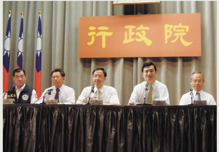
內政部長江宜樺召開跨部會記者會

本次研討會不僅促進兩岸四地接軌「共同打擊人口販運」的防制及對策，並加強與非政府組織之合作關係。為提升防制的成效，兩岸四地的專家學者，包括國內臺灣桃園地方法院檢察署黃主任檢察官錦秋，分別就人口販運案件偵查起訴現況、被害人處遇現況及其防制對策等進行探討及交流。可謂「兩岸四地攜手合作，再跨一大步！」