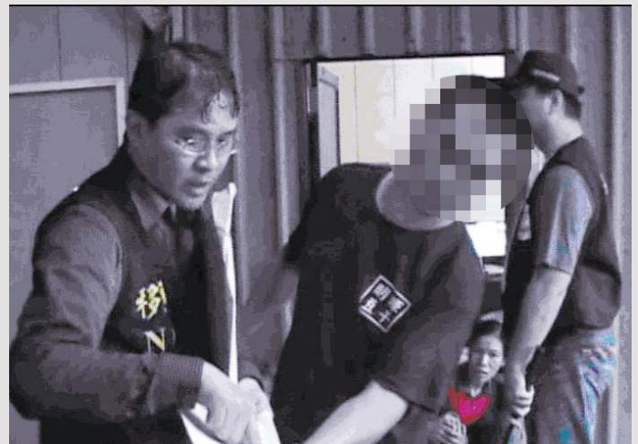
移民署新竹縣專勤隊於查緝現場搜索不法事證