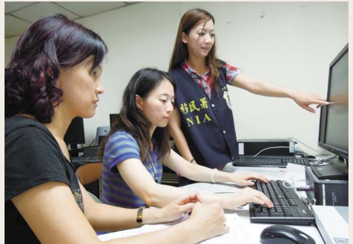
✎ 旅行社業者學習使用線上申請系統

最重要的申請程序、應備文件以及線上申請等議題，移民署多次主動與旅行業舉行座談會進行說明會，透過近距離與業者良性溝通，讓業者能對政策及各項行