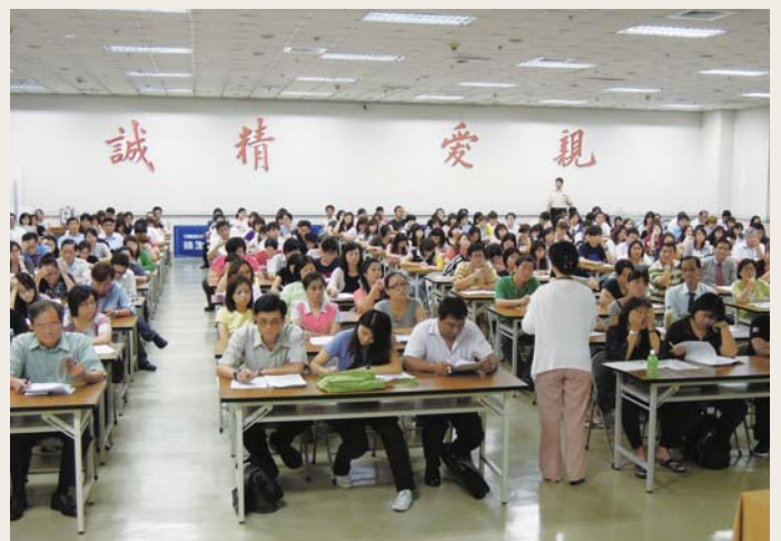
✎ 上百家旅行業者參加說明會，熱烈討論交換意見

開放陸客自由行的政策，政府不斷透過跨部會協商機制，本於「機會極大化，風險極小化」的原則，努力將風險降到最低，希望帶動臺灣觀光產業的同時，也不致造成民眾對於國家安全的疑慮。