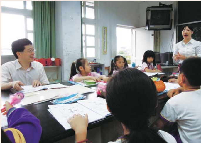
↑ 移民署長謝立功(左一)與小朋友們一同參與新移民母語傳承課程，跟著老師學習越南語

民國100年6月2日上午8時在新北市土城區安和國小，有一位新成員加入該校新移民母語學習課程，這位新同學就是移民署長謝立功，他透過親身體驗越南籍新移民嚴沛滢女士如何教導小朋友學習越南母語，同時體驗小朋友上課的心情。