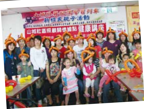
苗栗縣山城志工協會 新移民親子活動