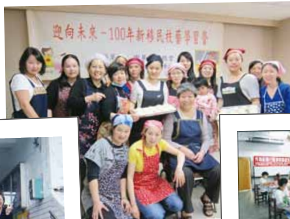
中華救助總會100年 新移民技藝學習營