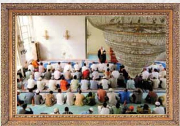
移民組第三名：Kaohsiung Mosaue Restu Rizkyta Kusoma(印尼籍)