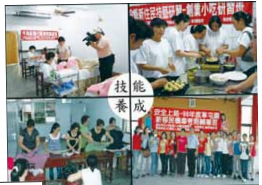
社團法人南投縣愛鄉文教 協會技能養成班