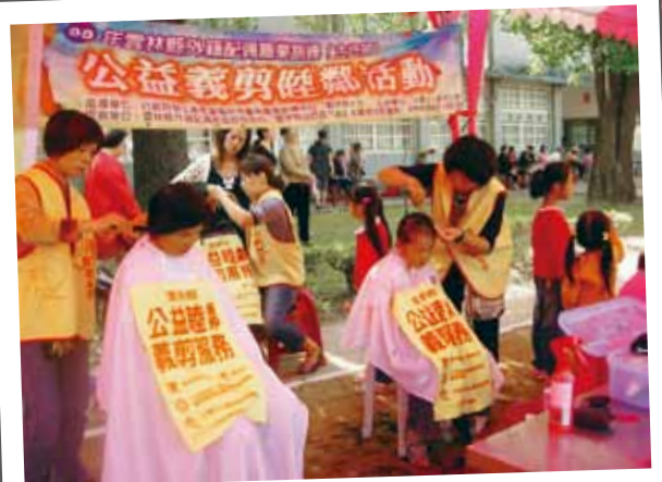
社團法人雲林縣社會關懷協會 公益義剪睦鄰活動