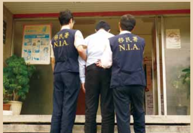
↑ 移民署臺中市第一專勤隊會同臺中市第一服務站同仁查獲非法仲介雄哥集團

這次特別感謝臺中市第一專勤隊的鼎力支持，透過站隊合作、資源共享，移民署才能發揮打擊人口販運真正的力量，保障新移民，善盡維護人權的國際責任。