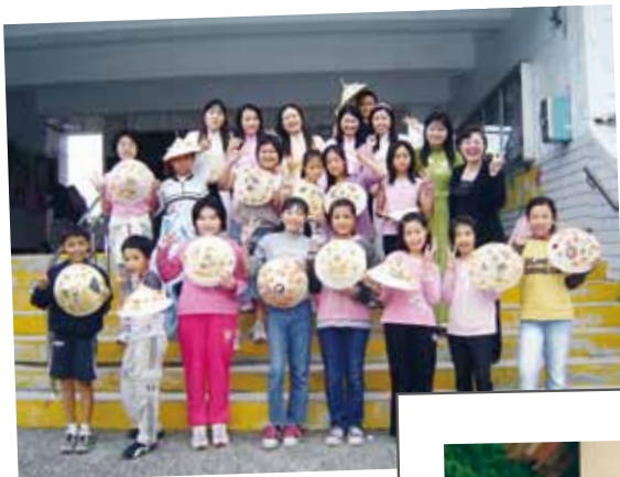
社團法人臺東縣外籍配偶協會