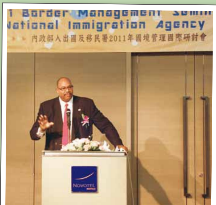
美國海關暨邊境保護局(CBP)駐香港辦事處代表Robert White發表演講

鑑於各國最新的國境管理模式非常值得借鏡，移民署每年均定期透過舉辦研討會等方式，建構與各國間重要交流平台。期望藉此研討會之舉行，汲取先進國家境管經驗，並促進多方的合作關係與交流互動，積極參與區域性移民合作，特別是有關人員訓練、資訊交換和業務經驗分享及人口販運方面，與各國都有很大合作空間，期盼能與有關國家洽簽合作備忘錄（MOU），建立更完善的合作方式，也唯有建立更緊密的國際合作網絡及夥伴關係，才能有效共同打擊跨國（境）犯罪及不法活動。未來移民署將持續做好國境把關的工作，以維護國家安全。