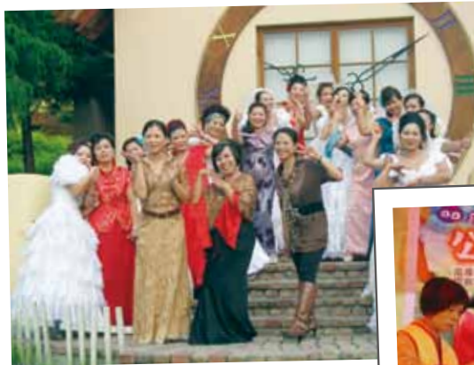
社團法人台中縣喜樂文化推廣協會 多元文化學習