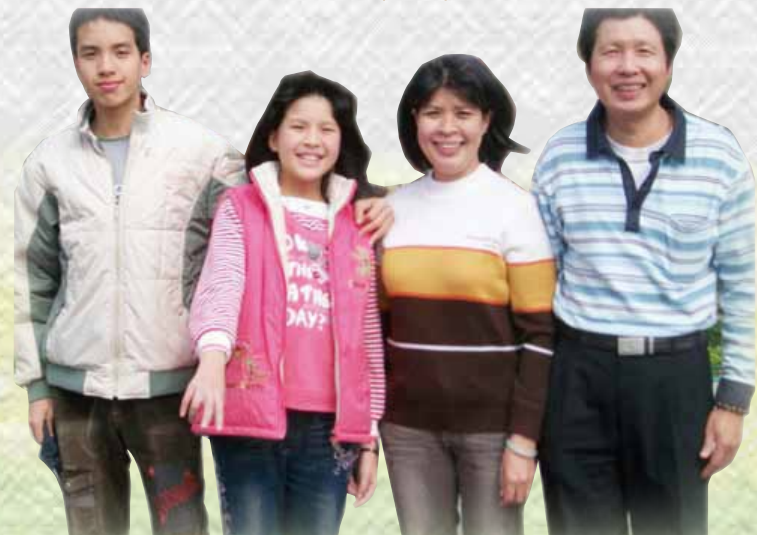
來自越南的蔡氏清水(右二)認真學習不放棄的愛