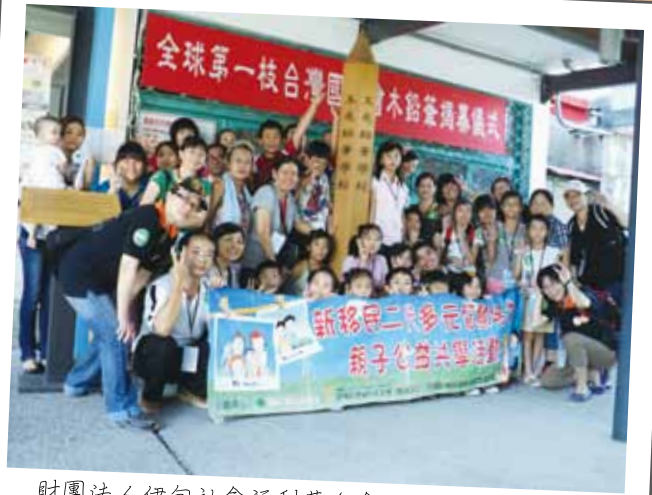
財團法人伊甸社會福利基金會 新移民二代多元智慧培力親子公益共學活動