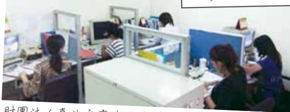
財團法人臺北市賽珍珠基金會 外籍配偶諮詢專線服務