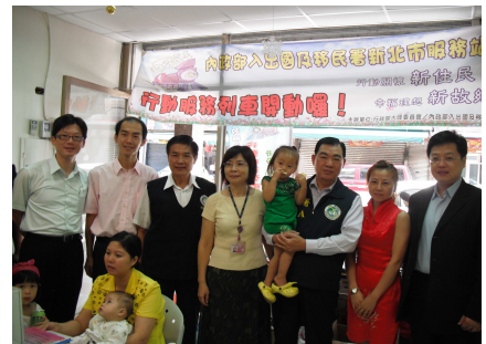
移民署副署長何榮村（右三）與與會長官、貴賓合影留念

今年度活動獲得陸委會補助，陸委會法政處副處長胡原龍也帶領科長魯仲尼隨車服務。這趟金山之旅，移民署副署長何榮村親臨活動現場指導，他首先致贈小禮物感謝熱心出借場地予服務站使用的劉星宏傳道，對於行動服務列車帶給地方居民的便利性及親近性有很高的評價，副署長何榮村並期許新北市服務站明年度繼續辦理行動服務列車，陸委會法政處副處長胡原龍也答應明年度繼續補助新北市服務站辦理下鄉服務。紅樹林電視臺也來採訪行動服務及大陸配偶在臺生活狀況。