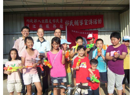
移民署連江縣服務站參與馬祖熱情潑水節泰好玩移輔活動。

馬祖的 7 月天和臺灣一樣 34 度高溫，太陽公公的熱情令離島小朋友期待消暑良方「潑水」活動的到來，連江縣政府有感於此，7 月 31 日於南竿鄉介壽澳口公園引爆歡樂氣氛，吸引許多縣民、新移民、小朋友前來現場瘋狂玩水，不管大人、小孩一起上演濕身秀，歡呼、尖叫聲連連，玩水之際也讓炎炎夏日消暑不少；現場還有泰國傳統舞蹈、熱舞秀、新移民走秀等表演和 9 個公務單位的聯合宣導活動，以及專門販賣異國美食的園遊會，像是泰式叉燒涼麵、泰式捲餅、越南捲餅和點心等都買得到，讓大家有看有玩還有得吃，度過難得充滿異國風情的週日下午。