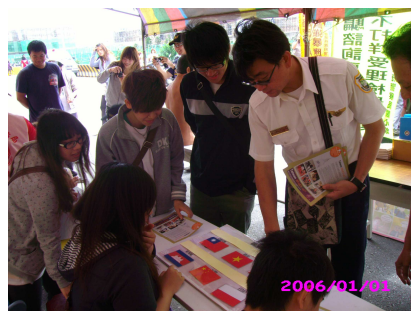
民眾參與國旗貼貼闖關遊戲