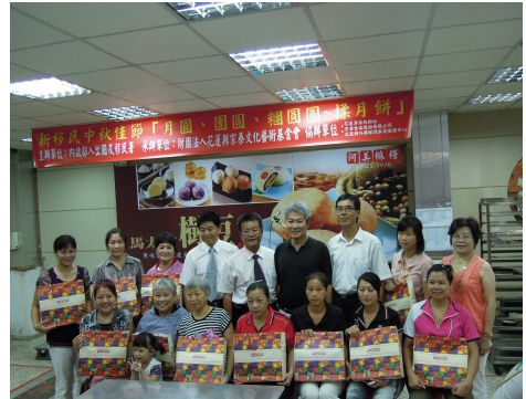
參與活動的新移民朋友開心地合影留念

此次活動報名踴躍，來自大陸、越南、印尼、柬埔寨等地的新移民，大家知道有這麼一個特別且有意義的活動，呼朋引伴的邀請自己的家鄉好友，將整個會場擠得水泄不通，熱鬧滾滾，大家對於親手做月餅相當好奇，看到眼前一堆的麵皮及內餡，七嘴八舌的討論著，不知該從何處下手，有的人還真的是「油皮、酥皮，傻傻搞不清楚啊！」經過糕餅師父詳細的解說與示範，大家手忙腳亂的完成了「月餅處女秀」，有些人還在月餅上刻字留念呢！沒想到一個好吃的月餅，做法也充滿了大學問喔！