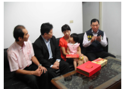
移民署副署長何榮村（右一）至大陸籍配偶阿晴家中關懷訪視

阿晴本來在寧波的商業專櫃賣衣服，她與先生是在寧波認識，進而戀愛結婚，先生是一位個性溫和、體壯黝黑的臺灣捕魚郎，在近海捕魚維生，通常出海一次要 4 天，最長 1 個禮拜，只有風浪大時，才無法出海，有時 3、4 個月也無法出海，因此家中經濟狀況不是很穩定，兩人育有 1 女，年僅 2 歲，因為有先天性過敏體質，使得阿晴沒辦法出去工作。