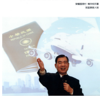
何前署長精熟法令，被同仁尊為「移民法規之父」，甚至還編寫「申請出國手續須知」一書。