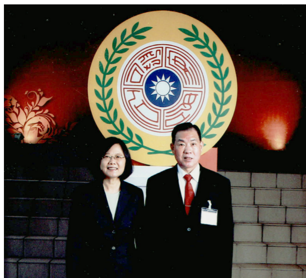
106年1月19日何前署長參加國安團隊春節茶會，與蔡英文總統合影。