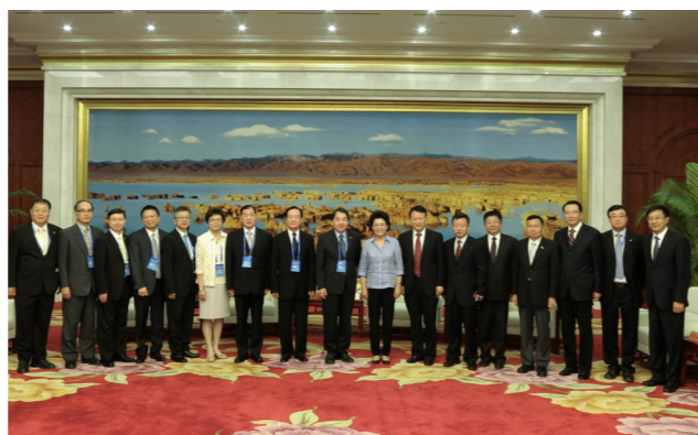
104年7月28日至8月2日何前署長（左7）率本署同仁至大陸地區寧夏市參與第7屆兩岸旅遊交流圓桌會議，雙方合影留念。

後排，如果我們堅守不增加那排就按照順序排，旅館跟遊覽車擴張就不會這麼快，照制度也能細水長流。