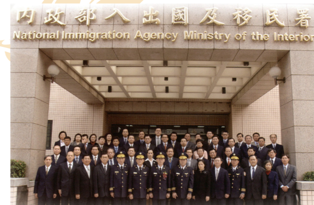
96年1月2日移民署成立時，吳前署長與科長級以上幹部合影。何前署長（前排左5）當時職務為主任秘書。

再來就是民國96年移民署的成立，移民署前身是境管局，被人稱作黑機關，而是以暫行組織規程在運作。而竟然就從民國62年暫行到民國95年，整整暫行了34年。每年立法院審預算時都說黑機關要法制化，終於在民國96年的1月2日移民署成立，是內政部入出國及移民署組織法以中央政府組織再造新的規劃去訂定的法律。