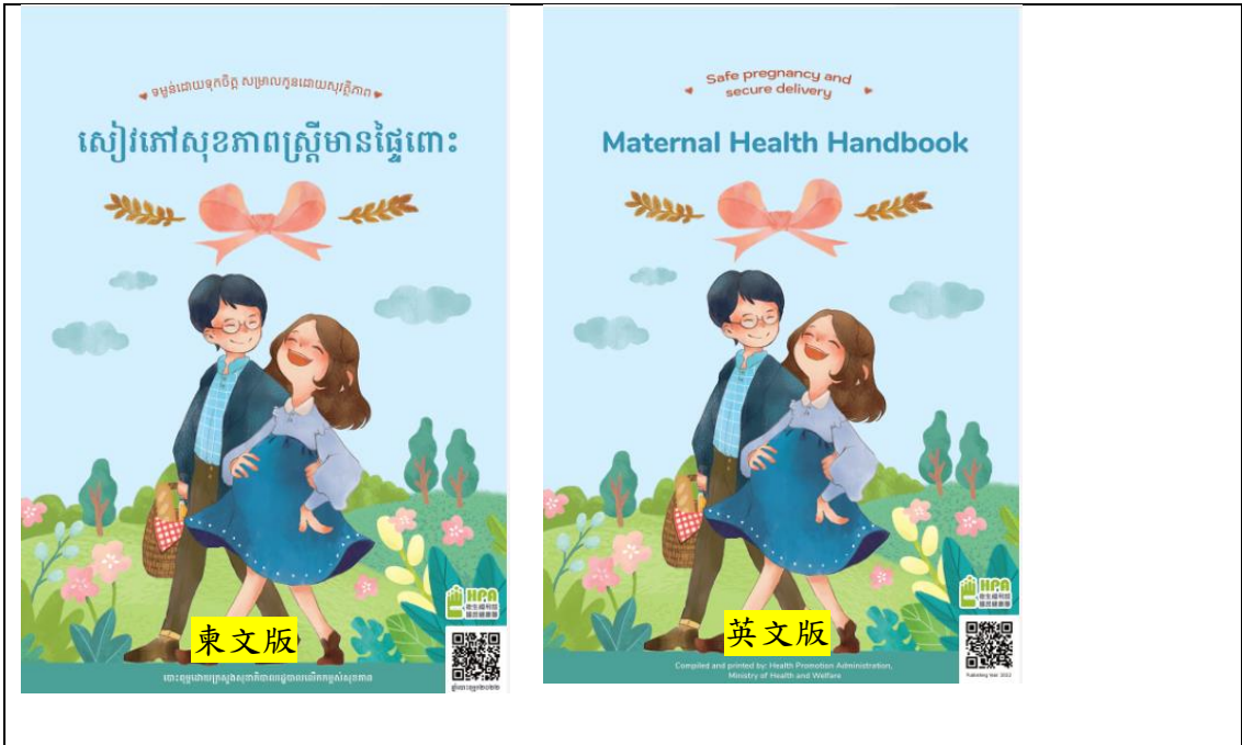
多國語言版爸爸孕產育兒衛教手冊